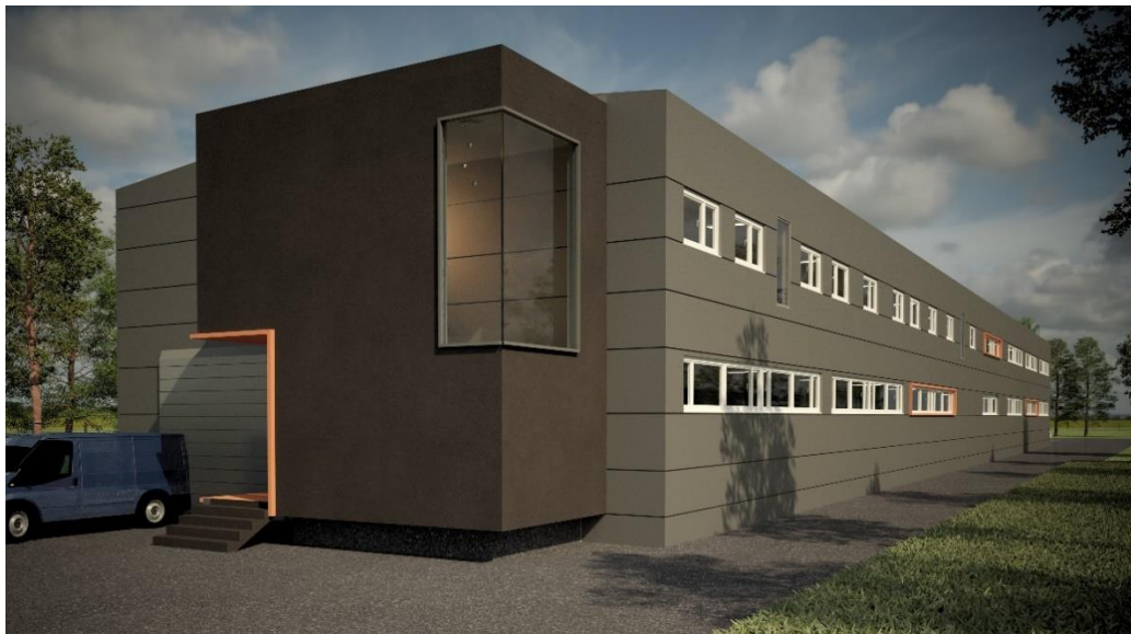
Slika 5 Industrijska hala [16]