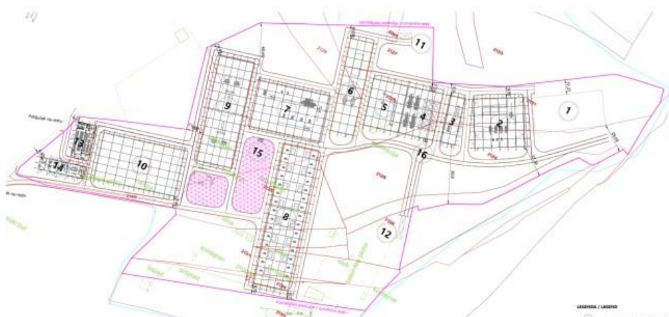
Slika 4 Projekt industrijskog kompleksa [15]

seizmičke i klimatske promjene. Implementacija rješenja za smanjenje negativnog utjecaja na okoliš, kao što su energetske učinkovite zgrade, sustavi za reciklažu i po mogućnosti korištenje obnovljivih izvora energije. Planiranje sustava za zbrinjavanje industrijskog otpada i otpadnih voda. Projektiranje sustava za zaštitu od požara, sigurnosnih kamera, kontrola pristupa i drugih sigurnosnih mjera. Osiguranje radnih uvjeta koji minimiziraju rizike po zdravlje radnika i poboljšavaju njihovu udobnost i produktivnost.(slika 4.) [13]