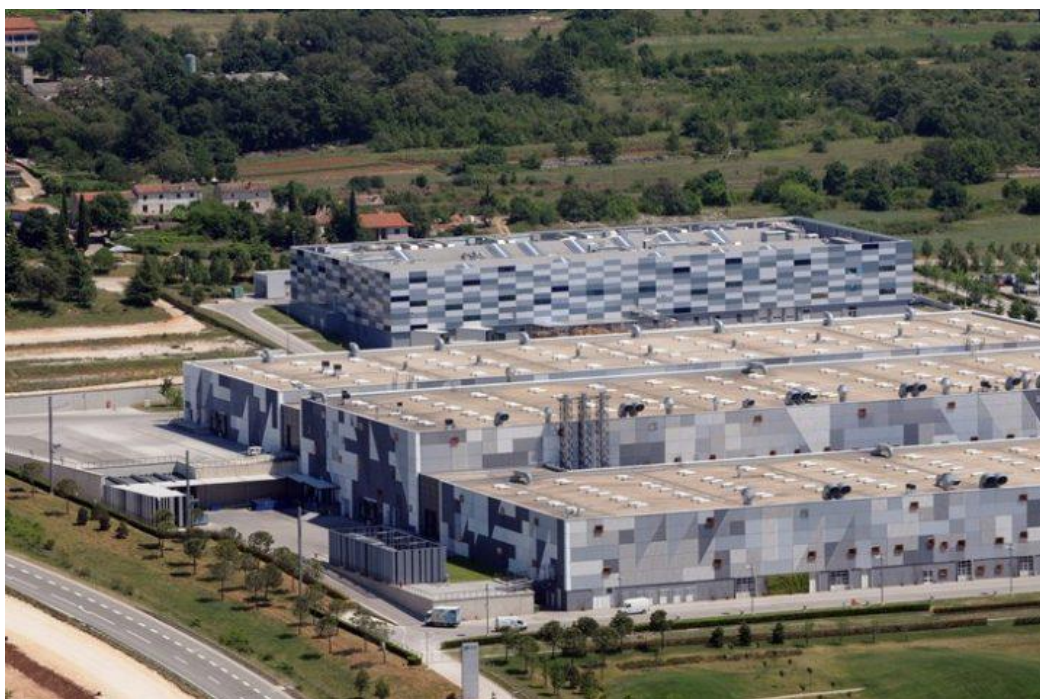
Slika 8 Višekatni industrijski objekti [19]