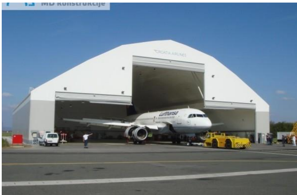
Slika 6 Hangar [17]

Hangari su veliki, otvoreni prostori koji se obično koriste za skladištenje velikih predmeta ili vozila, kao što su zrakoplovi, vozila ili veliki strojevi. Građeni su da izdrže teške vremenske uvjete, često s naglaskom na otpornost na vjetar, kišu i snijeg.(slika 6.)