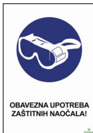
Slika 7: Obavezna upotreba zaštitnih naočala

Zaštitne naočale se primjenjuju prilikom obavljanja manjih poslova s motornom pilom ili za kratkotrajno korištenje alata poput brusilica i bušilica. Njihova svrha je zaštita od potencijalnih ozljeda uzrokovanih raspršenim materijalom ili iskrama tijekom rada s tim alatima. [8].