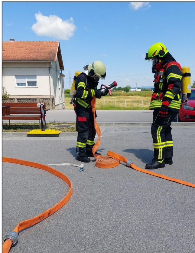
Slika 6. Praktičan rad polaznika usavršavanja [19]

Često primijenjena “nastavna metoda” koja to i nije u nastavi je prezentiranje pomoću projektoru i računala prilikom čega predavač čita tekst sa prezentacije. Iako se u praksi često koristi, nije nastavna metoda jer nema pedagoškog, didaktičkog i metodičkog pristupa. Kumulativno dolazi do demotivacije, pospanosti, nezainteresiranosti, dezorijentiranosti u gradivu i frustracije. Umjesto toga, pripremljeni sadržaji se polaznicima mogu dostavljati elektronskom poštom ili online nastave. Na ovaj način nema gubljenja vremena, a vrijeme za odrasle polaznike je vrlo dragocjeno.