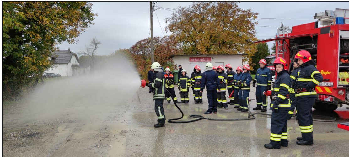
Slika 2. Predavač prezentira rad vatrogasnih sprava [15]

Odgojni zadatak polaznike usmjerava zajedništvu i timskom radu. U timu vatrogasci moraju brinuti jedni o drugima, moraju biti marljivi i pravovremeno izvršavati svoje zadatke, moraju brinuti o poštivanju etičkog kodeksa vatrogastva i o preciznosti izvršavanja svojih zadataka.