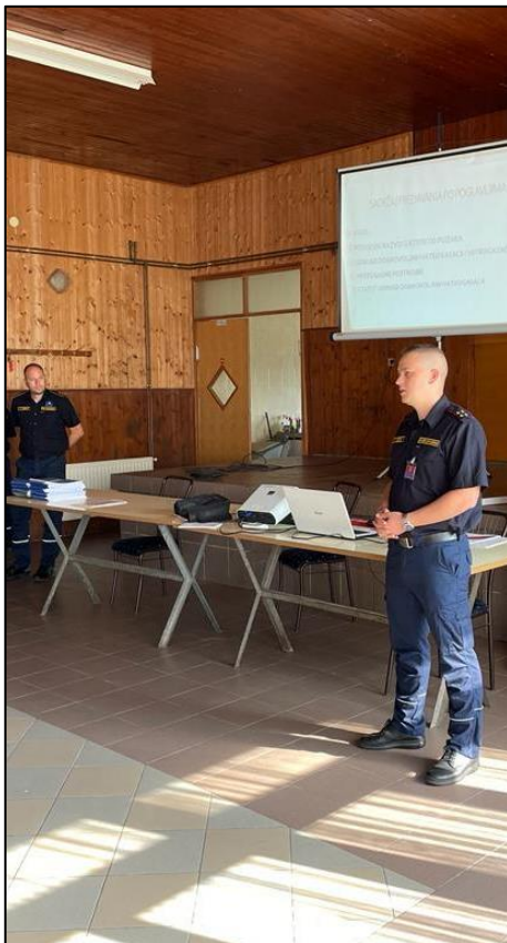
Slika 5. Izvođenje nastave verbalnom metodom [18]

Polaznici nakon teorijske nastave uče i radeći, odnosno izvodeći vježbe. To su prakseološke metode. Primjenjujući prakseološke metode dolazi do uključivanja polaznika u rad, polaznik sudjeluje u raspravi, izvodi zadatke, te primjenjuje znanje koje je naučio u teoriji. Predavač prilikom ove metode mora biti strpljiv te imati razumijevanja za polaznike kojima treba više vremena za izvođenje zadataka i vježbi. Polazniku treba jasno ukazati na pogreške, te sugerirati kako da zadatak pravilno izvede. Poželjno je da polaznik sam uvidi svoje greške. Predavač demonstrira vježbu, a zatim ju polaznici samostalno izvode. Kada se dogodi pogreška, predavač ukazuje na istu, ponavlja vježbu, a zatim ju polaznik samostalno ponavlja.