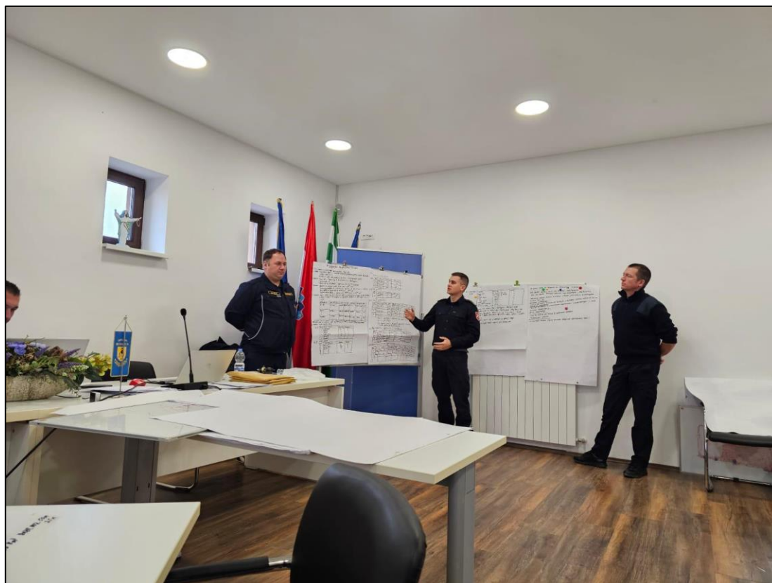
Slika 7. Polaznik prezentira usvojene nastavne sadržaje [20]

Postavljanjem jasnih pravila ponašanja na nastavi predavač šalje jasnu poruku što očekuje od polaznika, od discipline u radu, poštivanja pravila, ugodnog radnog prostora i nastavne klime, te da ima zapovjedni stav. U vatrogastvu je bitno da svatko zna svoju ulogu i zadaću. Ovakvim detaljima predavač može znatno utjecati na svijest polaznika, dobiti polaznikovo poštovanje, te postići polaznikovu veću koncentriranost i motiviranost na nastavno gradivo.