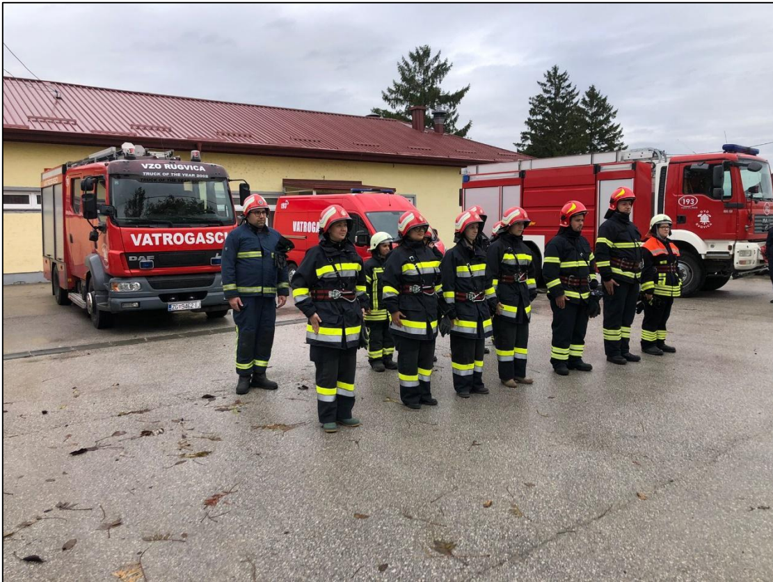
Slika 1. Skupina polaznika na osposobljavanju za vatrogasno zvanje [14]

Kod Ustrojstva zaštite od požara polaznici uče o povijesnom razvoju zaštite od požara, ustroju u vatrogasnim postrojbama, te udrugama dobrovoljnih vatrogasaca i vatrogasnih zajednica.