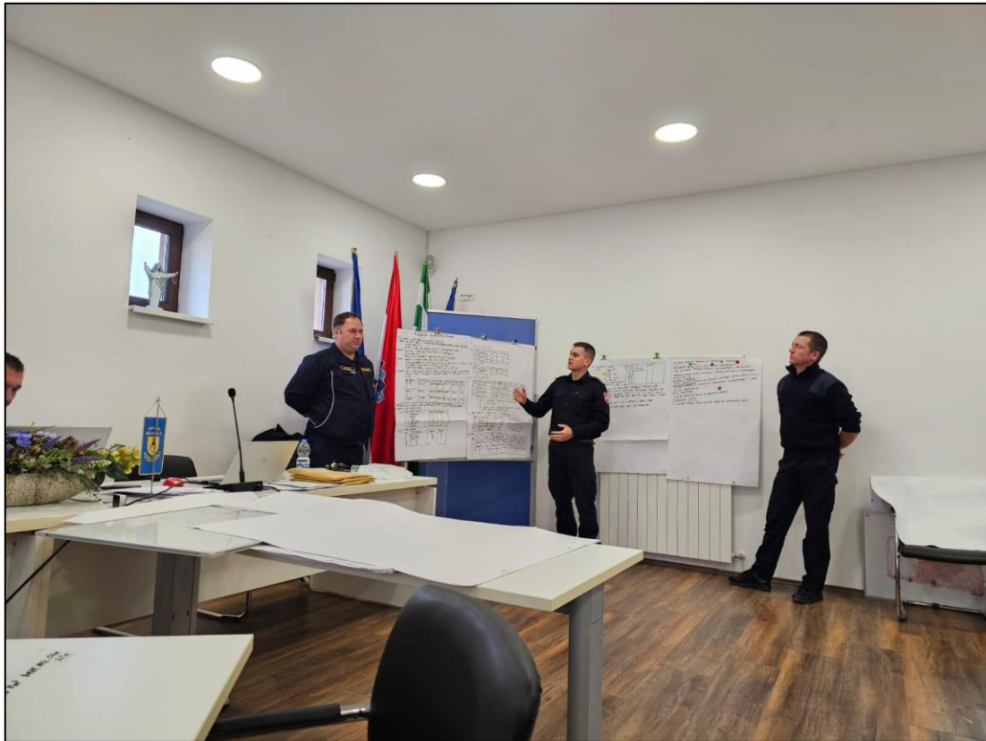
Slika 7. Polaznik prezentira usvojene nastavne sadržaje [20]

Postavljanjem jasnih pravila ponašanja na nastavi predavač šalje jasnu poruku što očekuje od polaznika, od discipline u radu, poštivanja pravila, ugodnog radnog prostora i nastavne klime, te da ima zapovjedni stav. U vatrogastvu je bitno da svatko zna svoju ulogu i zadaću. Ovakvim detaljima predavač može znatno utjecati na svijest polaznika, dobiti polaznikovo poštovanje, te postići polaznikovu veću koncentriranost i motiviranost na nastavno gradivo.