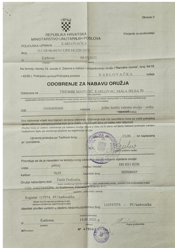
Slika 1. Odobrenje za nabavu oružja.[7]

Opći uvjeti za izdavanje odobrenja za nabavu oružja fizičkoj osobi su: