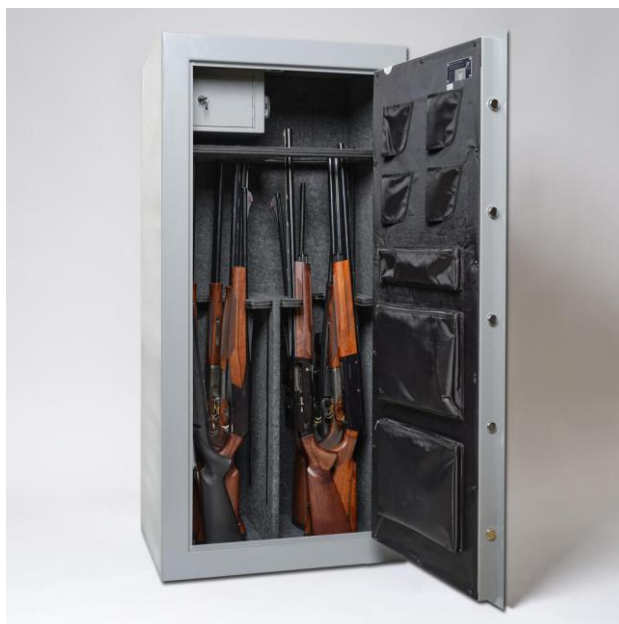
Slika 6. Ormar za zajedničko spremanje oružja i streljiva.[13]

Oružje i streljivo moraju se čuvati u stambenom ili drugom prostoru koji se nalaze u mjestu prebivališta ili boravišta vlasnika ili korisnika oružja i streljiva zaključani u ormaru od čvrstog materijala (slika 6.), sefu ili sličnom spremištu koje neovlaštene osobe ne mogu otvoriti alatom uobičajene uporabe.[1]