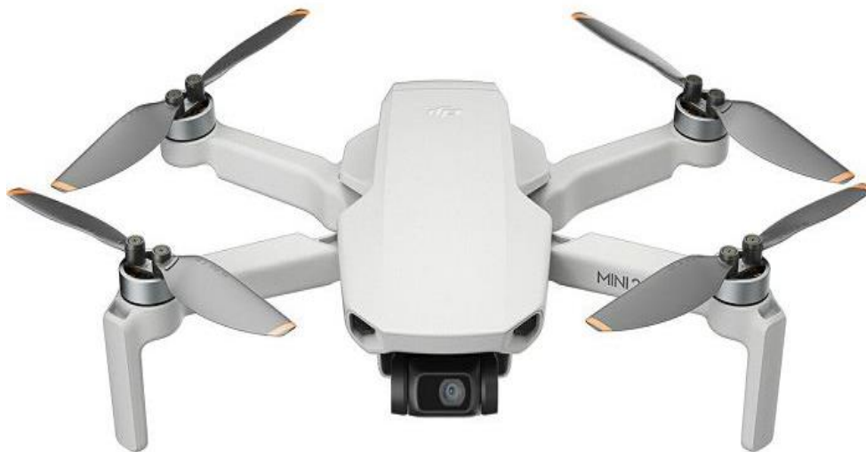
Slika 2. Dron [12]

se u redovnoj komunikaciji koristi riječ dron, nego bespilotna letjelica premda između njih postoji razlika u stupnju automatizacije.