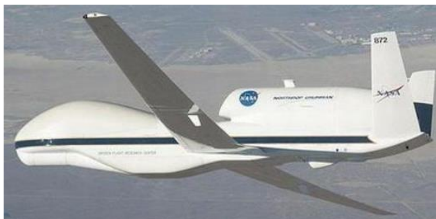
Slika 1. Беспilotna letjelica „Global Hawk” [6]

istraživanja ograničena je na korištenje aerosnimki uglavnom radi lakše navigacije na terenu. Jedan od glavnih razloga ograničene upotrebe metoda daljinskog istraživanja je taj što su fotografije i oprema iz zraka skupi i često zahtijevaju uredski rad. S druge strane, rezultati dobiveni daljinskim mjerenjem ponekad ne mogu zadovoljiti sve potrebe stvarnog gospodarenja šumama [7].