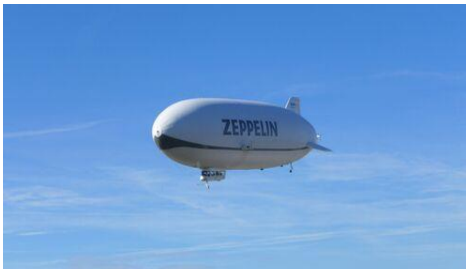
Slika 3. Zeppelin [13]

Bespilotne letjelice nadalje se mogu podijeliti prema konstrukciji, upotrebi, doletu i pogonskoj skupini [14]. U Tablici 1. prikazane su vrste bespilotnih letjelica klasificirane po svakoj od navedenih skupina.