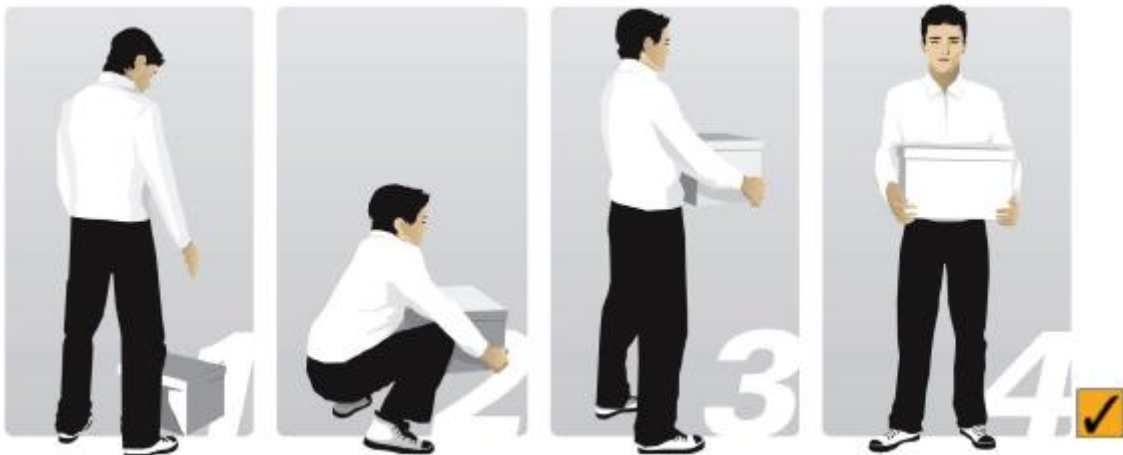
Slika 1. : Pravilan način ručnog podizanja tereta [8]

→ Tijekom prenošenja predmeta ako je potrebno radnik u svakom trenutku može uzeti pauzu. [8]