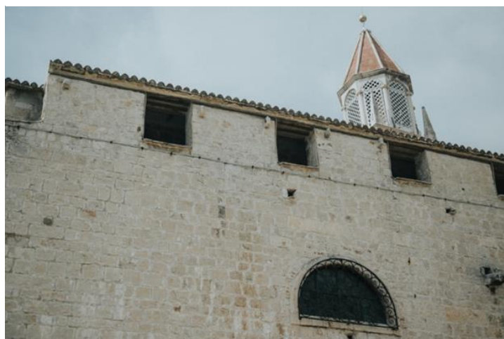
Slika 5. Samostan sv. Nikole