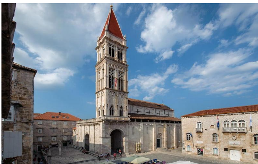
Slika 2. Katedrala sv. Lovre