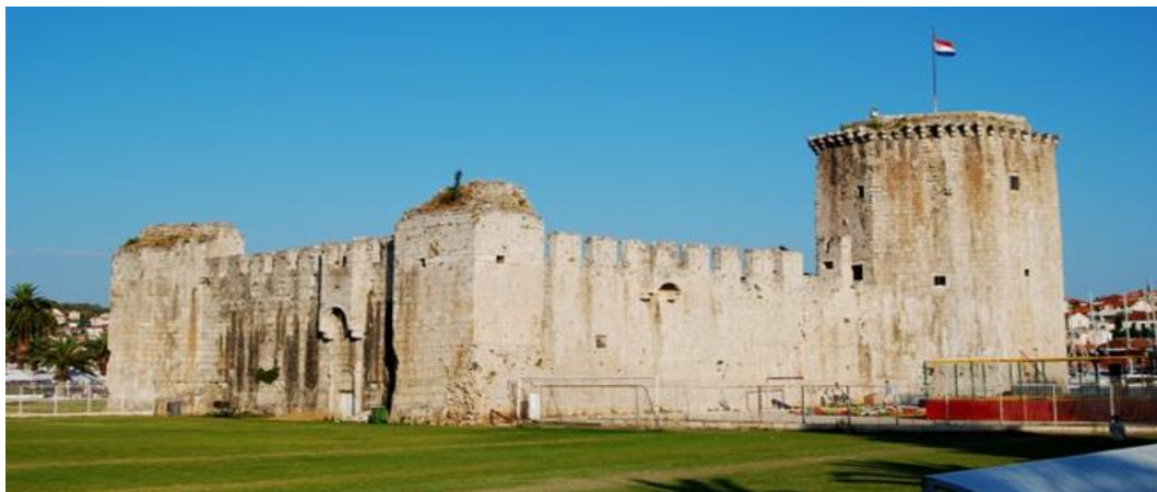
Slika 1. Tvrđava Kamerlengo