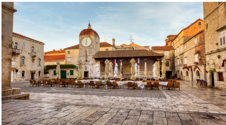
Slika 3. Gradska loža