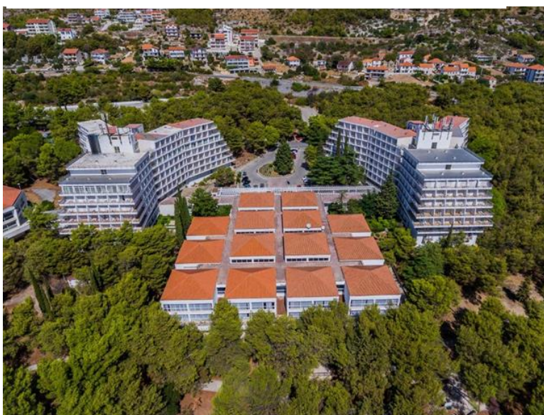
Slika 6. Hotel Medena