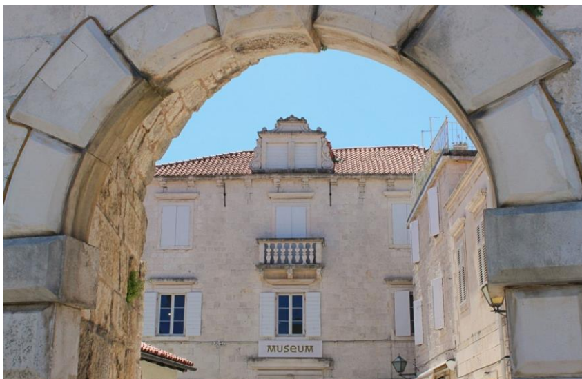
Slika 4. Gradski muzej