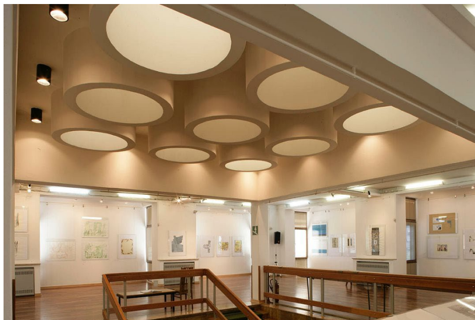
Slika 2. Galerija "Vjekoslav Karas"