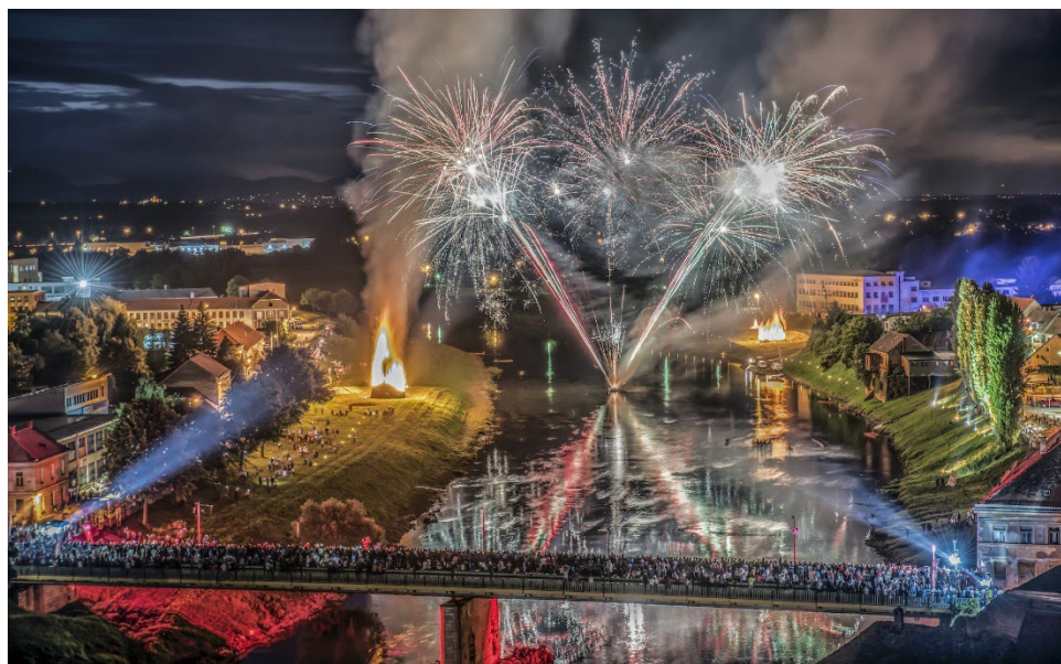
Slika 4. Ivanjski krijes