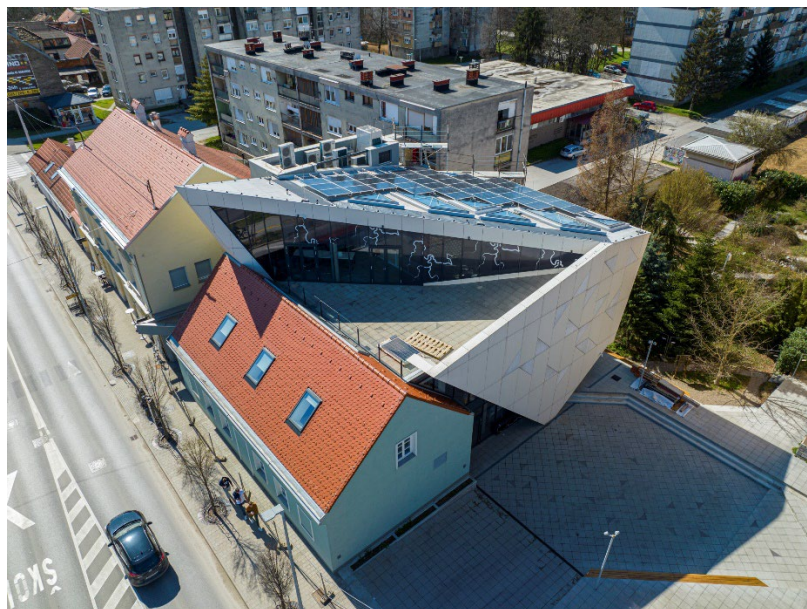
Slika 5. Nikola Tesla Experience Center