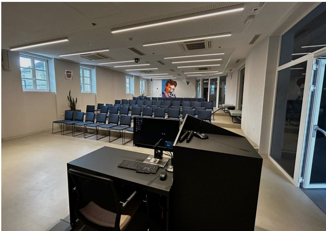
Slika 7. Multimedijaska dvorana