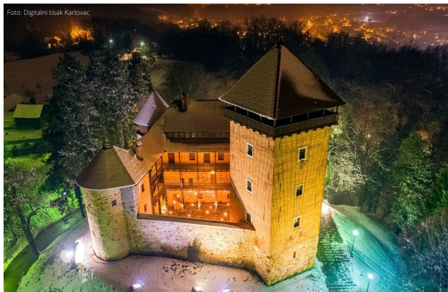
Slika 3. Stari grad Dubovac