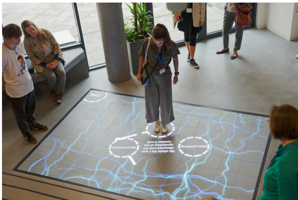
Slika 6. Fun Fact