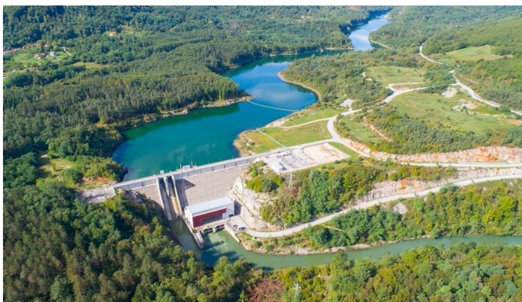
Slika 15. HE Lešće [27]

nizvodno od Ogulina, blizu mjesta Lešće i Generalskog Stola. Donja Dobra nastaje spajanjem Ogulinske Dobre i Zagorske Mrežnice koje regulira HE Gojak. HE Lešće koristi vodni potencijal rijeke Dobre, stvarajući akumulacijsko jezero iza HE Gojak. Elektrana je visoko automatizirana i upravlja se daljinski iz HE Gojak. Izgradnja je počela 2005., a puštena je u rad 2010. Ima dvije glavne proizvodne jedinice snage 20,6 MW svaka i agregat biološkog minimuma snage 1,09 MW. Proizvedena električna energija prenosi se preko 110 kV za glavne jedinice i 35 kV za ABM. Izgradnjom HE Lešće poboljšana je lokalna infrastruktura, što je unaprijedilo gospodarsku iskorištenost područja, posebno u uslužnim djelatnostima. Godišnja proizvodnja električne energije u razdoblju 2010-2016 iznosila je 102 GWh. Elektrana ima certificiran integrirani sustav upravljanja kvalitetom, okolišem, energijom te zaštitom zdravlja i sigurnosti prema normama ISO 9001:2015, 14001:2015, 50001:2018 i 45001:2018. HE Lešće je dio grupe Glavne elektrane Gojak, zajedno s HE Gojak i HE Ozalj 1 i 2, i spada u Proizvodno područje Zapad, s upravljanjem kroz Centar proizvodnje Zapad [21].