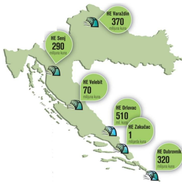
Slika 8. Hidroelektrane u Republici Hrvatskoj [31]

U Republici Hrvatskoj postoje nekoliko značajnih hidroelektrana koje igraju ključnu ulogu u proizvodnji električne energije.