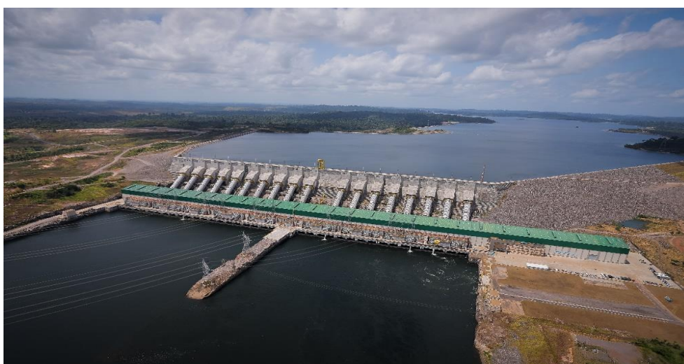
Slika 6. Belomonte hidroelektrana [30]

Belomonte (Belo Monte) - Ova hidroelektrana se nalazi na rijeci Xingu u Brazilu i ima kapacitet od oko 11.000 MW.