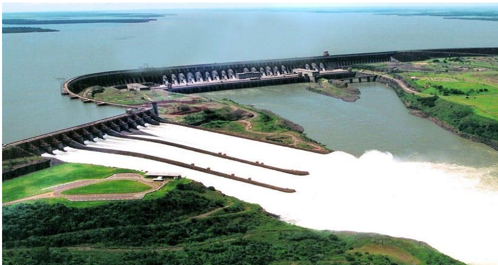
Slika 4. Itaipu hidroelektrana [30]