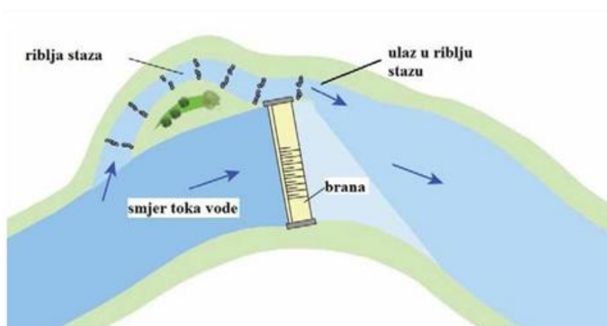
Slika 2. Prikaz riječne brane i riblje staze [29]

Ako nije izgrađena riblja staza, ribe ne mogu migrirati uzvodno oko hidroelektrane (Slika 2). Bez alternativnog prolaza, ribe često moraju proći kroz turbine, gdje mnoge stradavaju, ozlijeđene su ili pod stresom. Osim ozljeda od dijelova turbina, ribe trpe i zbog promjena tlaka, kavitacije (isparavanje vode i stvaranje mjehurića zbog rotacije turbina), turbulencije i trenja zbog velike brzine vode. Riječne jединke mogu se ozlijediti na rešetki na ulazu u vodozahvat, osobito pod jakim pritiskom vode ili prilikom čišćenja rešetke. Ovi problemi značajno narušavaju ekologiju rijeka i biološku raznolikost, s nepovratnim posljedicama [20].