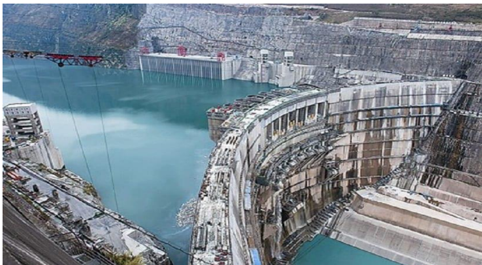
Slika 5. Xiluodu hidroelektrana [30]

Belomonte (Belo Monte) - Ova hidroelektrana se nalazi na rijeci Xingu u Brazilu i ima kapacitet od oko 11.000 MW.