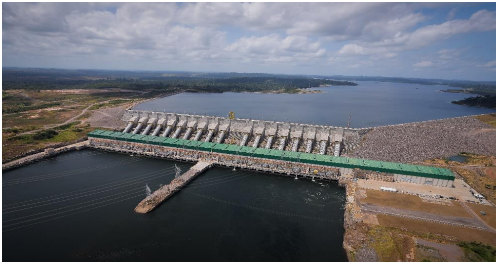
Slika 6. Belomonte hidroelektrana [30]

Belomonte (Belo Monte) - Ova hidroelektrana se nalazi na rijeci Xingu u Brazilu i ima kapacitet od oko 11.000 MW.