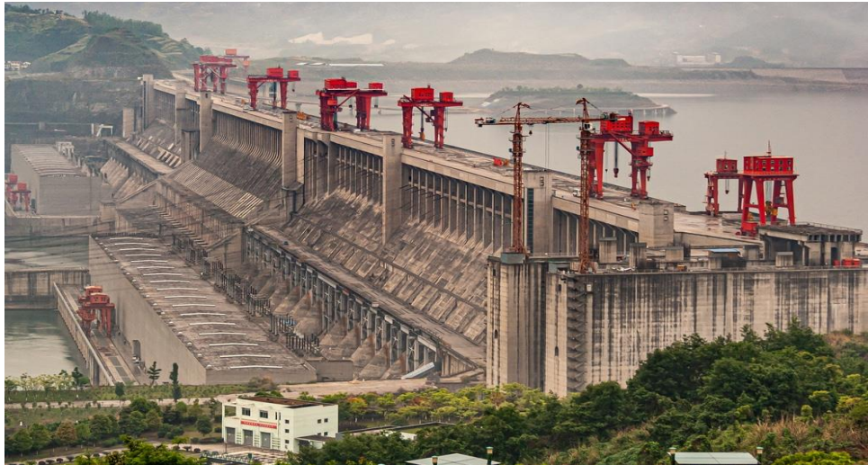
Slika 3. Najveća hidroelektrana na svijetu: Tri klanca u Kini [30]