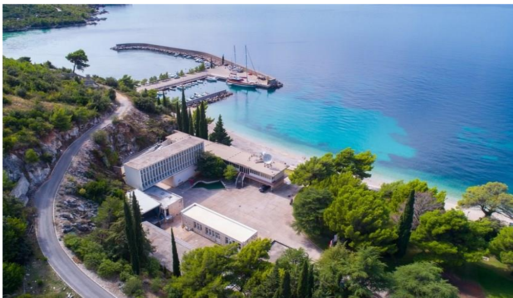
Slika 13. HE Dubrovnik [27]

dijelova i tehnoloških sustava koji omogućuju proizvodnju električne energije, kao i pružanje pomoćnih usluga elektroenergetskim sustavima obje države. HE Dubrovnik je povezana s elektroenergetskim sustavom Republike Hrvatske putem kabela veze do transformatorske stanice Plat u duljini od 950 metara. Također, povezana je s elektroenergetskim sustavom Republike Bosne i Hercegovine putem dalekovodne veze do rasklopnog postrojenja Mokro polje u duljini od 12 kilometara. Organizacijski, HE Dubrovnik je samostalni pogon unutar Sektor za hidroelektrane, povezan s HE Zavrle koja se nalazi u blizini strojarnice. HE Dubrovnik igra ključnu ulogu u osiguravanju energetske stabilnosti i održivosti regije, pružajući stabilan izvor električne energije te važne pomoćne usluge elektroenergetskim sustavima obje države na čijem se teritoriju nalazi [21].