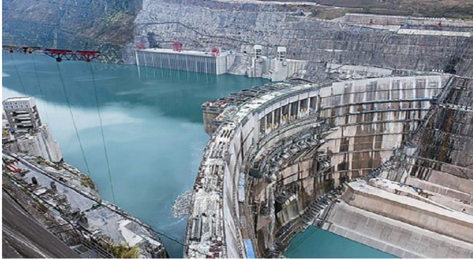
Slika 5. Xiluodu hidroelektrana [30]

Belomonte (Belo Monte) - Ova hidroelektrana se nalazi na rijeci Xingu u Brazilu i ima kapacitet od oko 11.000 MW.