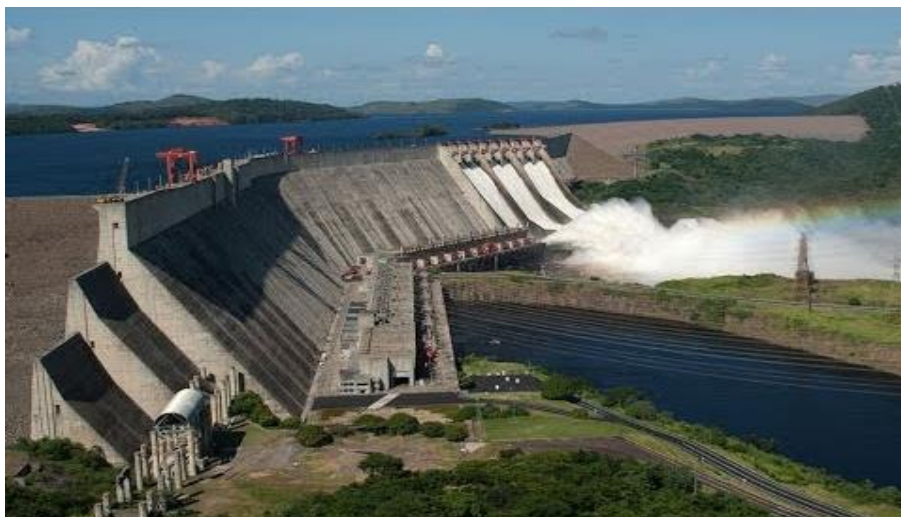
Slika 7. Guru hidroelektrana [30]

Ove hidroelektrane ne samo da proizvode značajnu količinu električne energije, već često imaju i veliki utjecaj na okoliš i lokalne zajednice zbog izgradnje brana i promjena u vodnom ekosustavu [26].