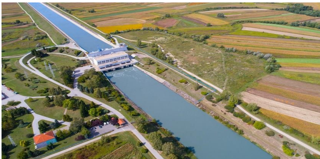
Slika 14. HE Varaždin [27]

dio u Republici Sloveniji, ima površinu od 2,8 km 2 i kapacitet od 8 hm 3 za dnevno uređenje protoka vode. Sastoji se od akumulacijskog jezera s obodnim nasipima i dovodnim kanalom, pokretnog i nasutog dijela brane, ulazne građevine, strojnarnice te odvodnog kanala. Glavna postrojenja hidroelektrane uključuju dva glavna agregata s Kaplan turbinama, svaki s raspoloživom snagom od 47 MW, te malu rekonstruiranu hidroelektranu (MHE) s Kaplan agregatom snage 0,635 MW. Ova mala hidroelektrana služi za ispuštanje biološkog minimuma nizvodno u staro korito rijeke. Ukupna instalirana snaga HE Varaždin iznosi 94,635 MW, s ukupnim instaliranim protokom od 450 m 3 /s (operativno 500 m 3 /s). Prosječna godišnja proizvodnja električne energije iznosi 450 GWh, dok je rekordna maksimalna proizvodnja zabilježena 2014. godine s 636 GWh, a minimalna 2003. godine s 370 GWh. HE Varaždin ima certificirani Integrirani sustav upravljanja kvalitetom, okolišem, energijom te zaštitom zdravlja i sigurnosti prema normama ISO 9001:2015, 14001:2015, 50001:2018 i 45001:2018. Također, pruža pomoćne usluge sustavu kao što su tercijarna regulacija, crni start i otočni pogon. Organizacijski, HE Varaždin pripada grupi Glavne elektrane Drava i dio je Proizvodnog područja Sjever, a upravljanje proizvodnjom provodi se kroz Centar proizvodnje Sjever [21].