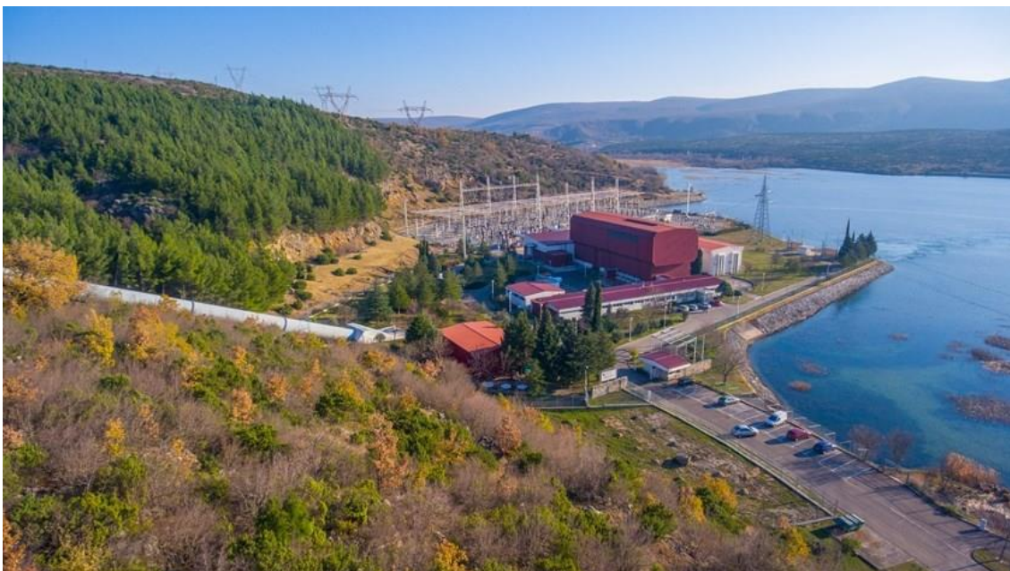
Slika 10. RHE Velebit [27]

Organizacijski, RHE Velebit je dio Proizvodnog područja Jug, a upravljanje proizvodnjom provodi se kroz Centar proizvodnje Dalmacije [21].