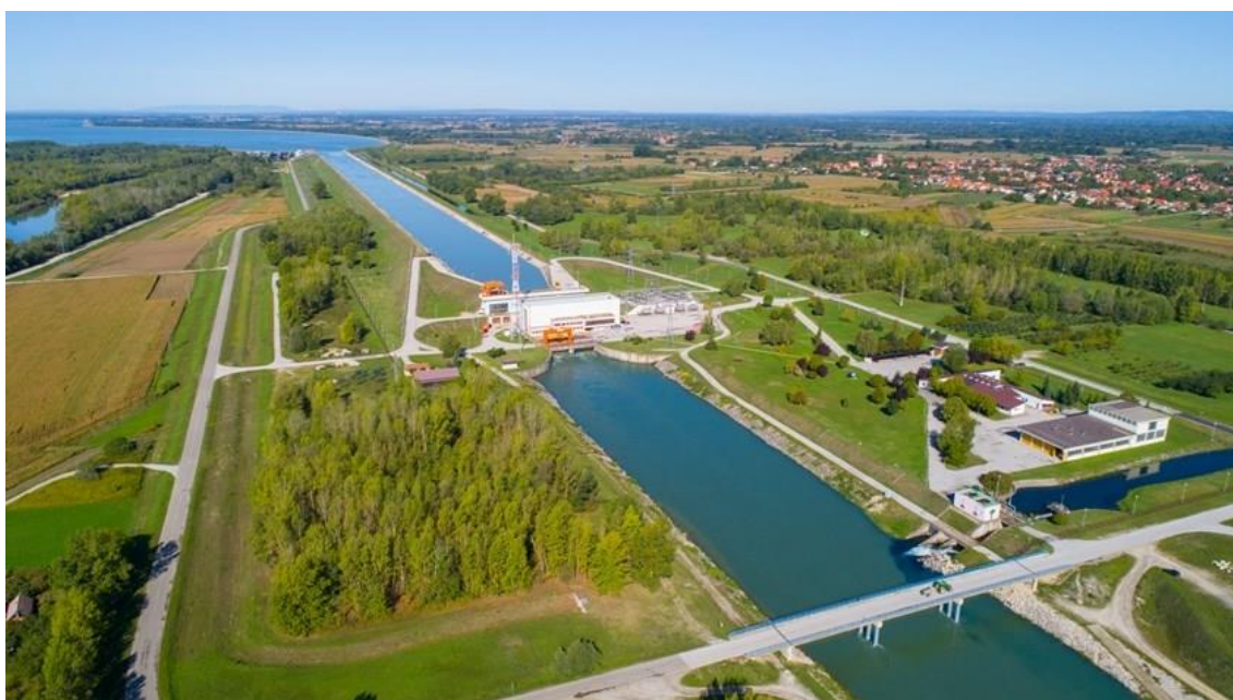
Slika 12. HE Dubrava [27]

produkcija električne energije HE Dubrava iznosi 350 GWh, dok je rekordna maksimalna godišnja proizvodnja zabilježena 2014. godine s 544 GWh. Elektrana pruža tercijarnu regulaciju kao pomoćnu uslugu elektroenergetskom sustavu. Osim što je ključni proizvođač električne energije, HE Dubrava igra važnu ulogu u očuvanju okoliša, zaštiti od poplava te podršci poljoprivredi i drugim sektorima koji ovise o vodi. Njezina funkcionalnost doprinosi stabilnosti elektroenergetskog sustava i održivosti regije. HE Dubrava, kao dio mreže hidroelektrana na Dravi, predstavlja integrirani sustav koji spaja ekonomsku korist s ekološkom odgovornošću, čineći je vitalnim dijelom infrastrukture sjeverozapadne Hrvatske [21].