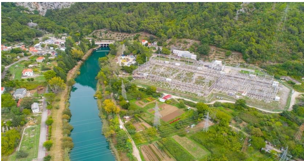
Slika 9. HE Zakušac [27]