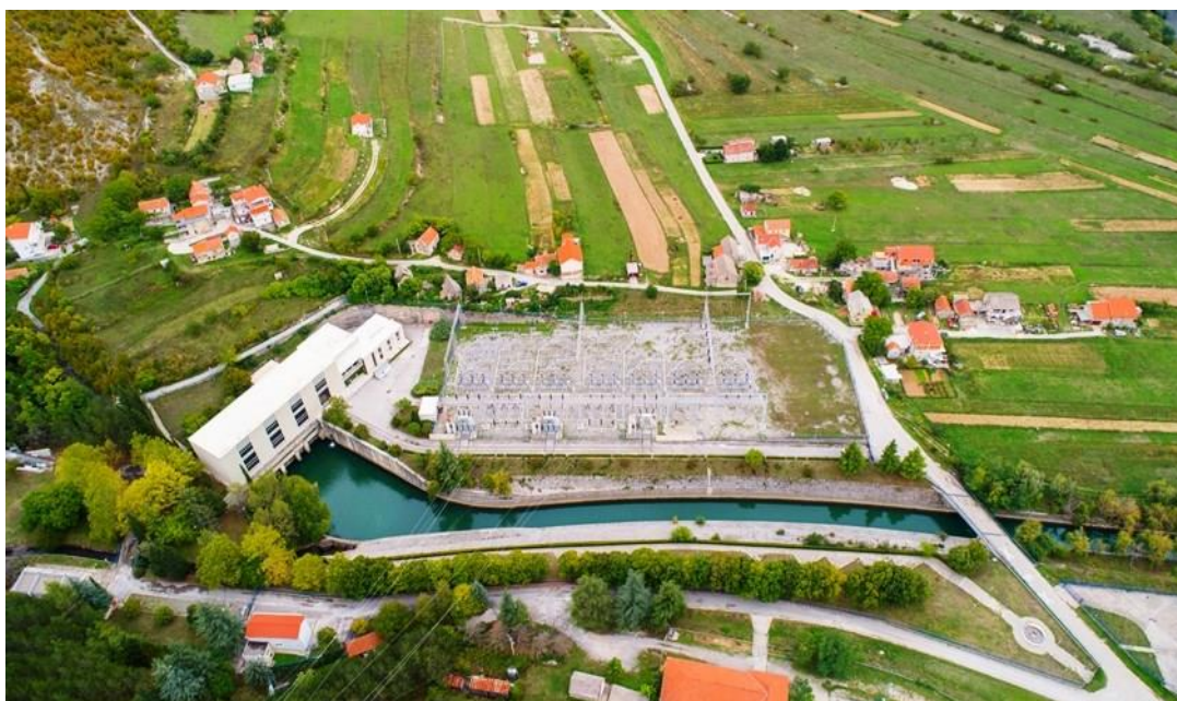
Slika 11. HE Orlovac [27]

poplava, gospodarenje vodama te podršku poljoprivredi i drugim sektorima. Njezina integracija s Crpnom stanicom Buško blato dodatno optimizira upravljanje vodama i energetske učinkovitost na širem području. HE Orlovac predstavlja vitalnu komponentu infrastrukture Hrvatske, koja spaja ekonomsku učinkovitost s održivim korištenjem prirodnih resursa, što je ključno za dugoročnu energetske sigurnost i održivost regije [21].