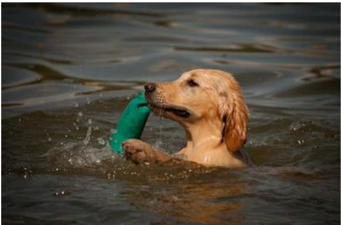
Slika 9 Štene retrivera u vodi - trening aporta sa igračkom