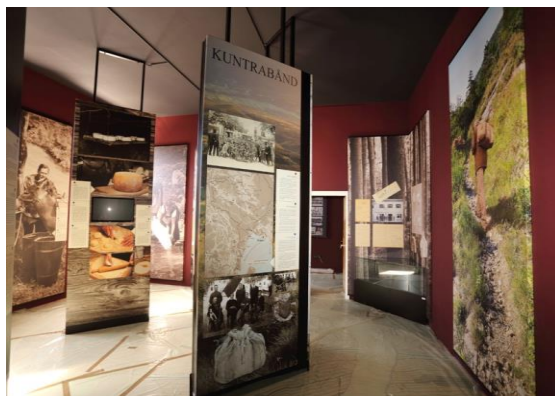
Slika 3. Unutrašnjost muzeja Vlaški puti