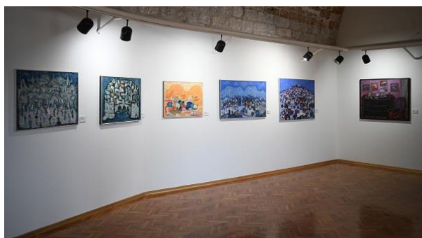
Slika 10. Ekspoziti atelijera Pulitika