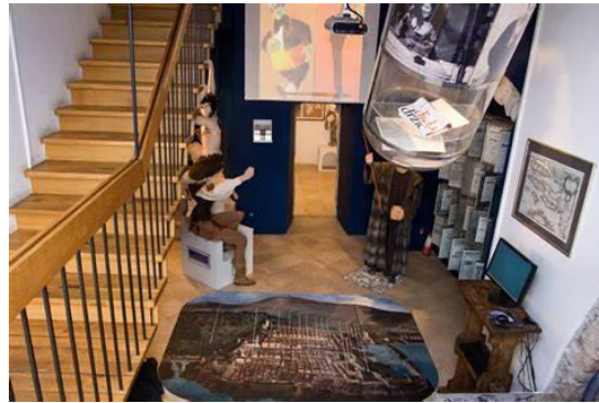
Slika 11. Ekspoziti doma Marina Držića