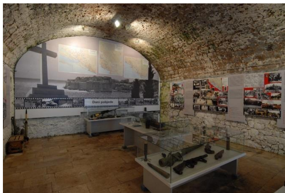
Slika 7. Ekspozicija muzeja Domovinskog rata