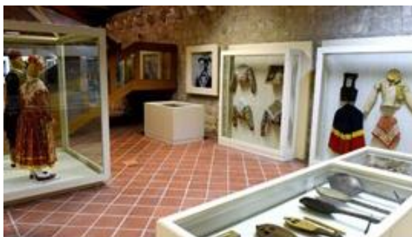
Slika 4. Ekspozicije Etnografskog muzeja (narodne nošnje i instrumenti)