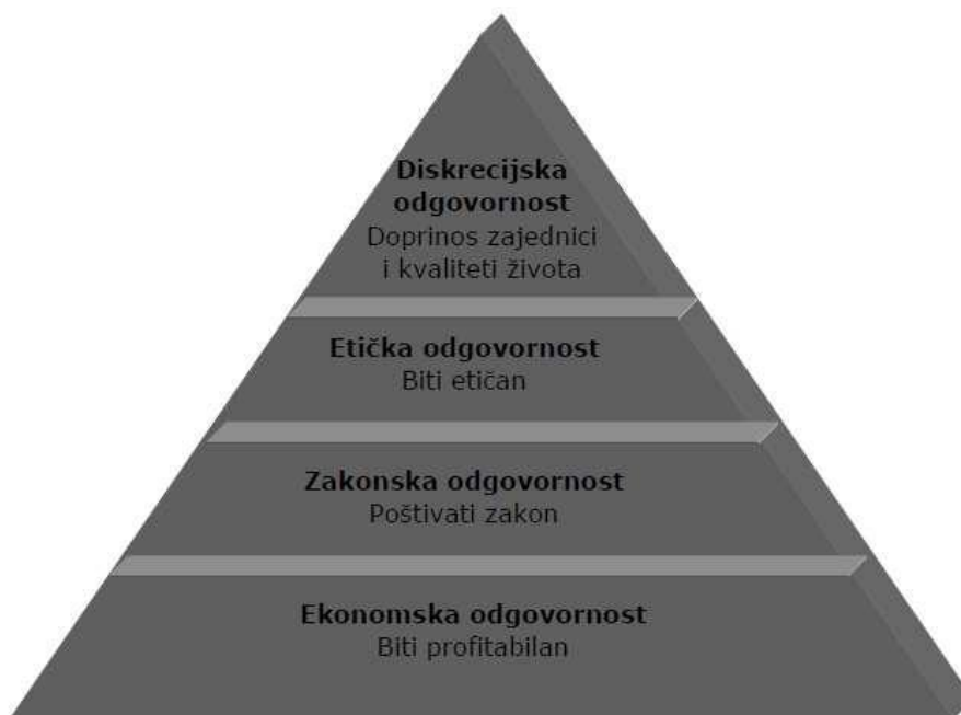
Slika 3. Hijerarhija društvene odgovornosti poduzeća