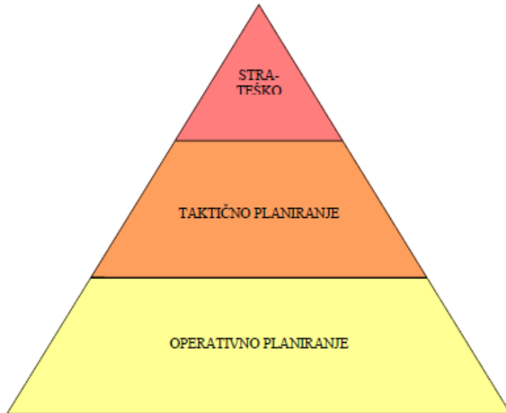
Slika 2. Razine planiranja