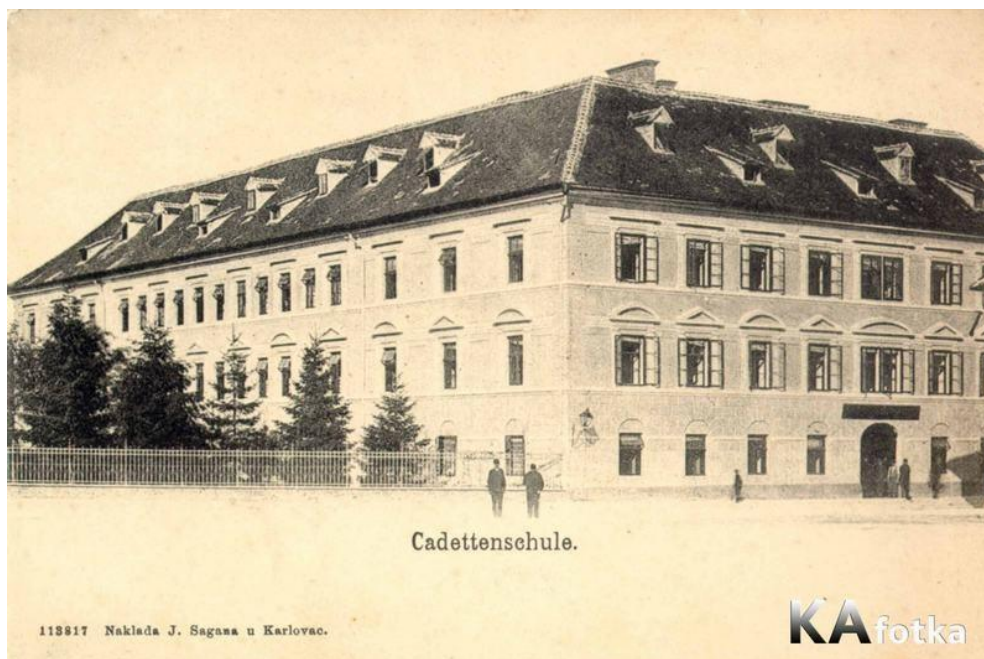
Slika [1] Veleučilište ili kadetska škola Karlovac 1900-1940