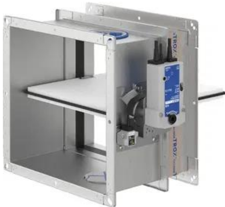
Slika 10. Pravokutna protupožarna zaklopka za odvajanje prodora kanala između požarnih sektora [14]

Ona se može prenositi koritom s beskonačnim lancem, transporterima ili pneumatski. Svi uređaji ugrađeni su u samu građevinu ili su provedeni kroz zidove pilane. Da bi se spriječilo širenje požara na mjestima prodora kroz protupožarni zid potrebno je osigurati zaklopku otpornu protiv požara najmanje jedan do dva sata (Slika 10.) [12].