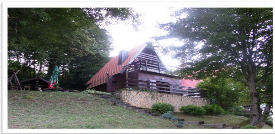
Slika 6 : Mrežnička vikend kuća