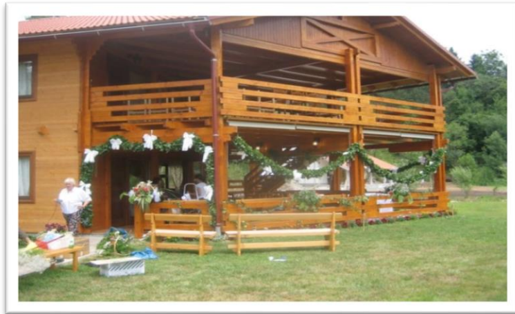
Slika 8: Mrežnička kuća