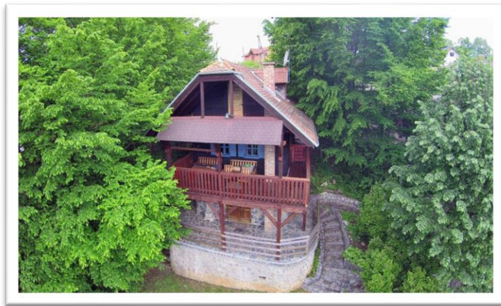
Slika 9: Drvena kuća (App Bozović)