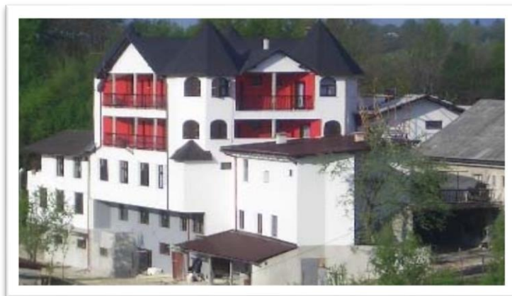
Slika 3 : Hotel Frankopan