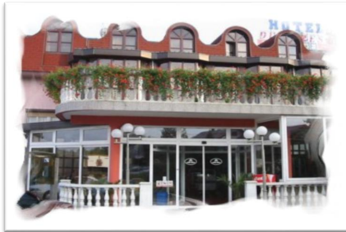
Slika 2: Hotel Duga Resa