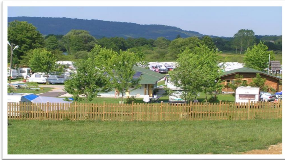
Slika 6 : Kamp Slapić