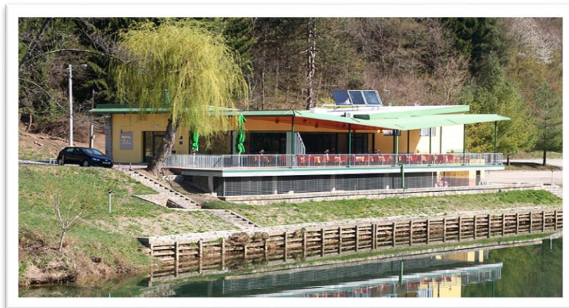
Slika 5: Motel Dobra