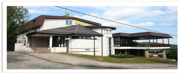
Slika 4: Motel Roganac