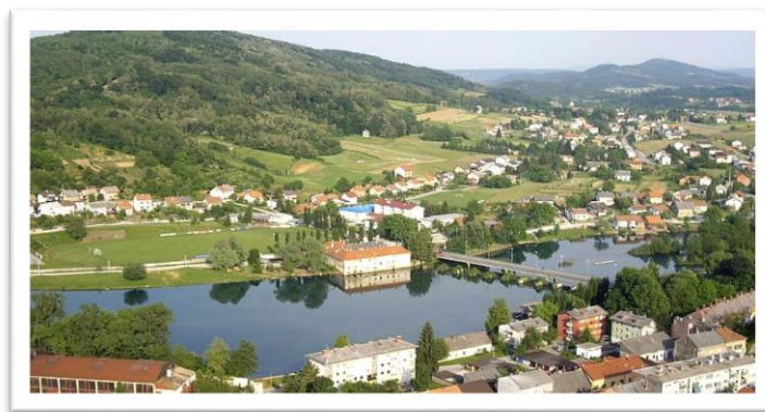
Slika 1: Grad Duga Resa

IZVOR : Turistička zajednica grada Duge Rese, www.tz-dugaresa.hr , (05.11.2015.)