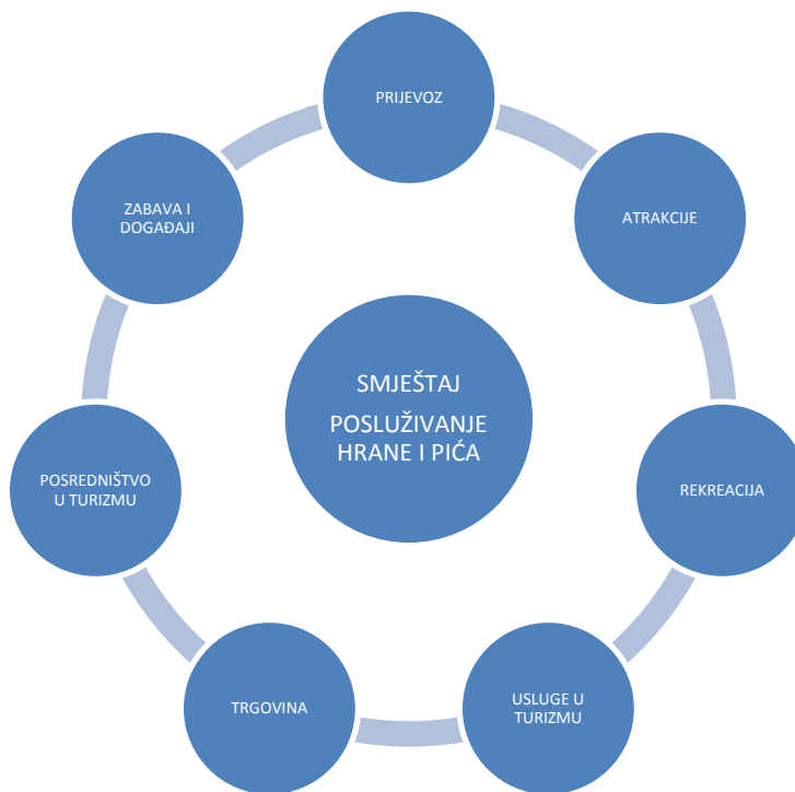
Shema 1: Ugostiteljstvo – temelj razvoja turizma

IZVOR : Čavlek, N., Bartoluci, M., Prebežac, D., Keser, O. i suradnici: Turizam