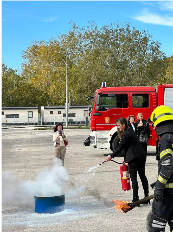
Slika 2 Gašenje simuliranog požara vatrogasnim aparatom