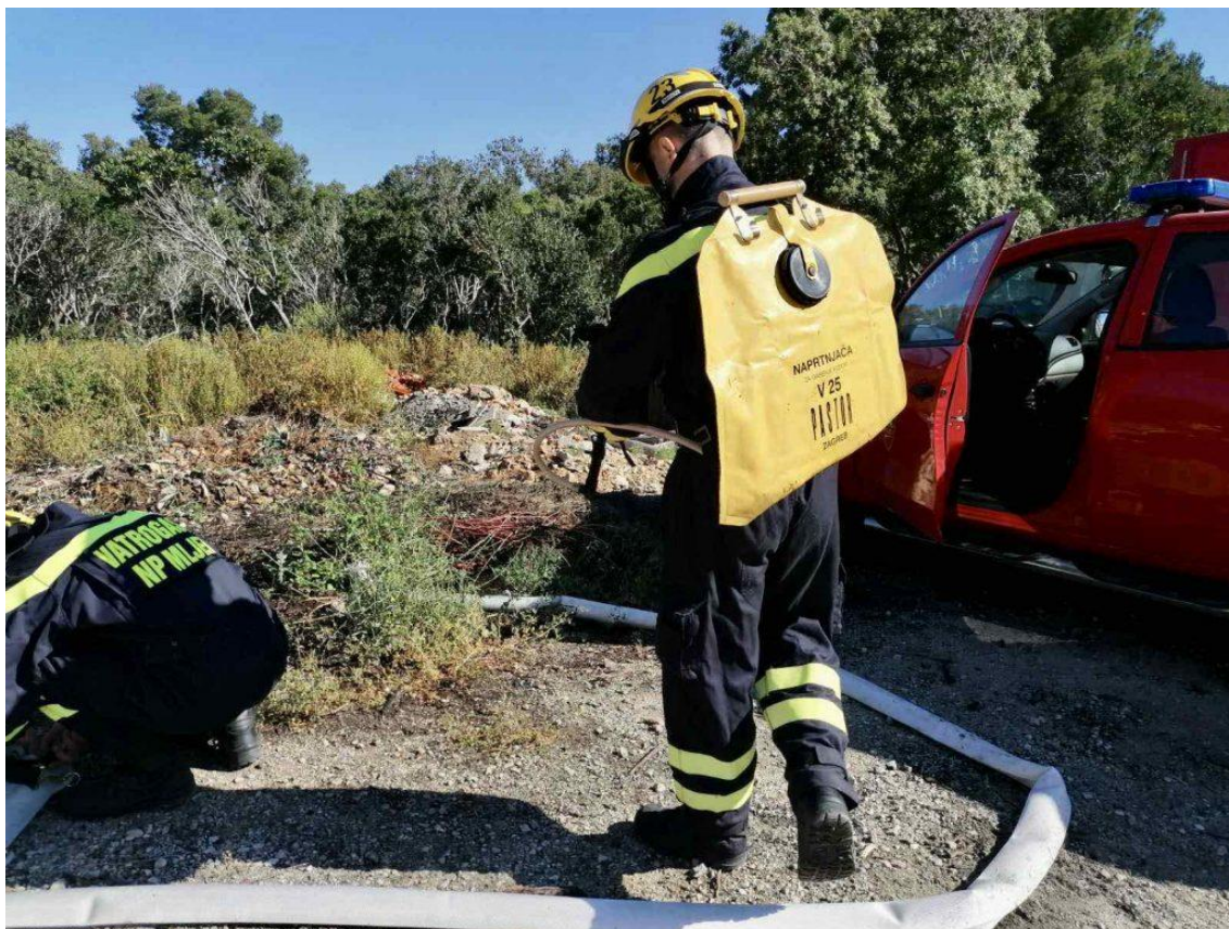
Slika 3 Gašenje šumskog požara