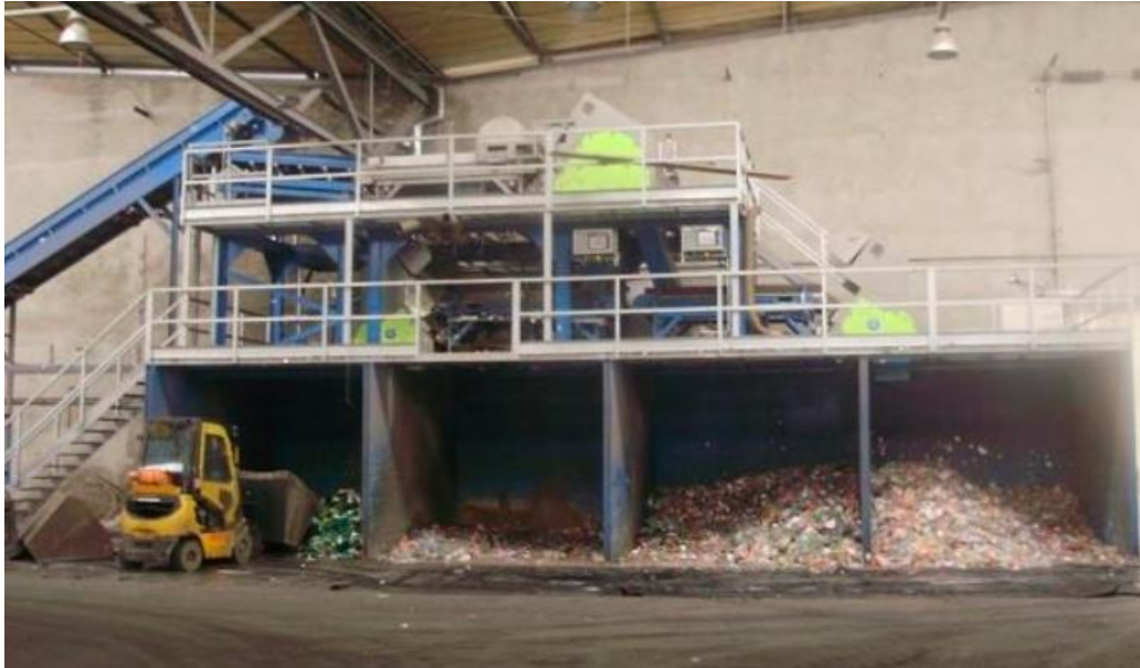
Slika 3. Sortirnica tvrtke Drava International [12]

Sortirnica prikazana na slici 2. funkcionira tako da sortira plastične boce prema boji, čime se sortira 98% plastične ambalaže u prvoj fazi, a veliki postotak efikasnosti govori i o kvaliteti, a postoje i senzori koji se koriste za eliminaciju neprihvatljivih vrsta plastike te trake za odvajanje naljepnica s boca. [13] Dio PET flekica koristi se za proizvodnju PET folije, dok se manji dio PET flekica zajedno s HD-PE granulama koristi dalje za proizvodnju PET pretformi i čepova koji se dobivaju postupkom brizganja. Brizganjem se dobije određena pretforma iz koje se daljnjim zagrijavanjem i puhanjem dobiva određeni oblik i volumen boce.[11]