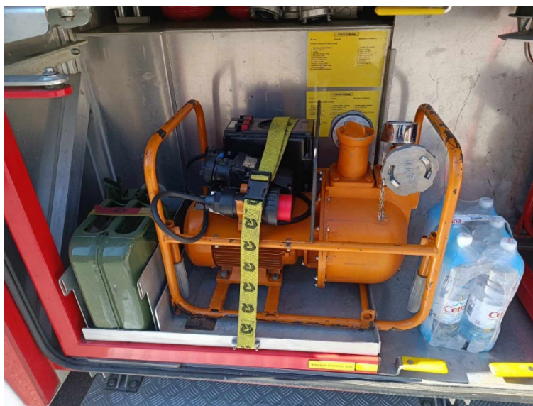
Slika 23. Pumpa za pretakanje opasnih tvari [6]

Pumpa za pretakanje opasnih tvari je stvorena za brzo premještanje velike količine vode. Najčešća upotreba ovih pumpi je kod poplava kada u kratkom vremenu treba ispumpati veliku količinu vode u neki propust, odvodni kanal ili preko nasipa.