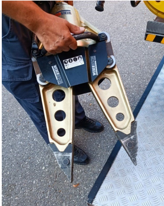
Slika 9. Hidraulična razupora [6]

Kao i hidraulične škare današnji razupirači su najvećim dijelkom rađeni od visoko kvalitetnih laganih aluminijskih legura. Vrhovi su im rađeni od tvrdih materijala otpornih na trošenje. Stoga je bitno zahvat s limom koji se razupire ostvariti upravo tim dijelom. Za hidraulični razupirač možemo reći da radi dvoradno, odnosno da osim razupiranja može vršiti i funkciju stiskanja iako je konstrukcijski napravljen tako da mu je sila razupiranja uvijek veća od sile koju može ostvariti stiskanjem. [16]