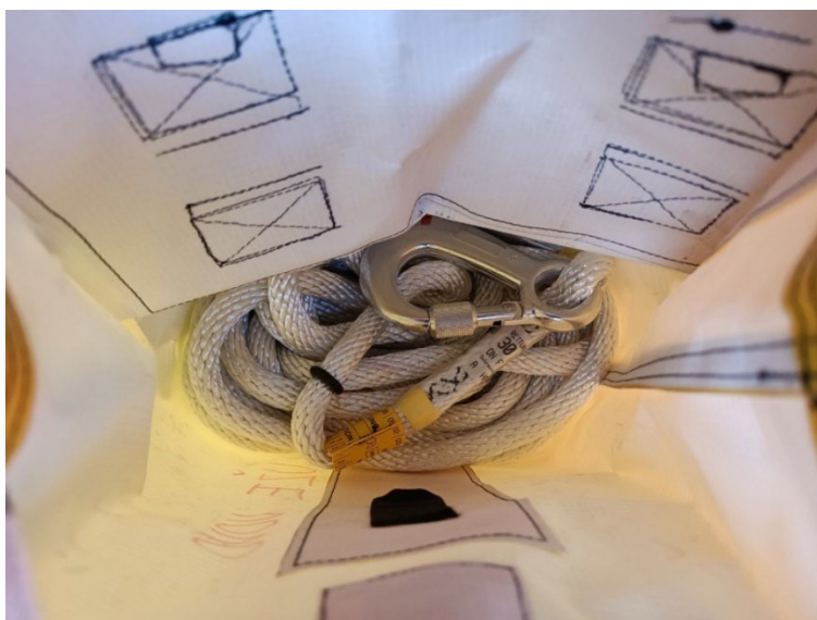
Slika 5. Penjačko uže [6]

Radno uže koristi se za razna osiguranja, povezivanja i podizanja tereta. Na prvi pogled moramo ga razlikovati od penjačkog užeta po boji. Ono je crvene boje. Radna užad ne smije se koristiti kao penjačka. No, nažalost, u praksi se često stara penjačka užad pretvara u radnu što koji puta može biti kobno.