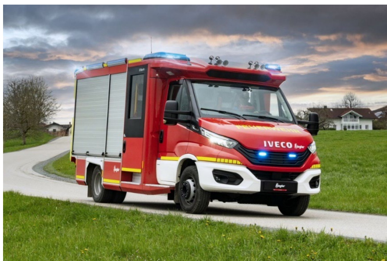
Slika 2. Tehničko vozilo srednje [7]

intervencije. To je vozilo čija je ukupna masa do 12000 kg, ima vitlo nazivne vučne sile do 50 kN, generator izmjenične struje nazivne snage od 15 do 20 kVA te dva reflektora, snaga svakog je po 1000W.(Slika 2.) [5]