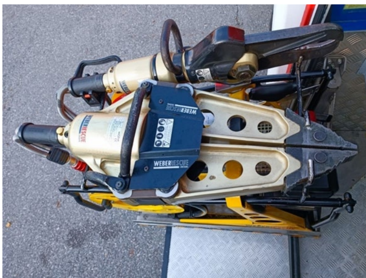
Slika 8. Hidraulične škare i razupora [6]

Oblik čeljusti napravljen je tako da zahvaća predmet i prikvači ga ka glavnom osovinskom vijku oštrice gdje je i sila rezanja najjača. Valja napomenuti da se kod rezanja punih profila osobito od materijala povišene čvrstoće, kao što su borni čelici, može dogoditi da se taj profil ne može odsjeći. Čim poslužitelj na škarama primijeti da dolazi do razmicanja osi škara, to je znak da se treba prekinuti sa započetom radnjom. Rezne oštrice škara neće puknuti, ali će se tijelo cilindra ili svinuti na mjestu spoja reznih oštrica s cilindrom ili će aluminijska legura na tom mjestu jednostavno puknuti i nepopravljivo oštetiti tijelo cilindra. [16]