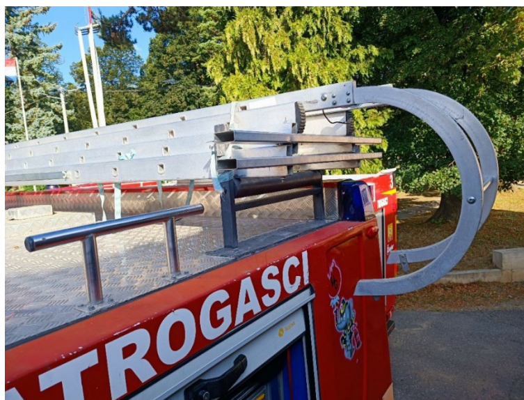
Slika 6. Ljestve kukače sa zaobljenim kukama [6]

Ljestve kukače koje su dobile naziv po tome što mogu imati jednu ravnu kuku ili zakrivljene kuke. (Slika 6.)