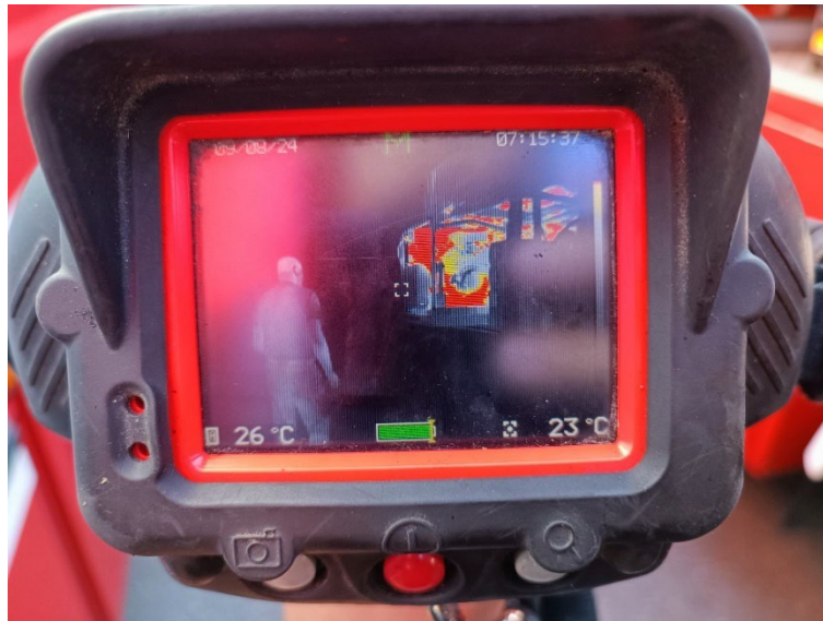
Slika 7. Termalna kamera [6]

Termalnom kamerom se pretražuje prostorija ako ima unesrećenih osoba koje se ne vide od dima ili u nastalim ruševinama. Također termalnom kamerom se može tražiti izvor topline pri nastanku gustoga dima ili se može pratiti temperatura požara dimnjaka.