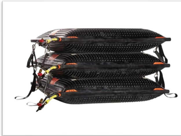
Slika 14. Zračni jastuci za podizanje tereta [6]

Pri upotrebi zračnih jastuka za podizanje tereta na intervencijama mora se paziti na njihovo postavljanje. Materijal zračnih jastuka nije otporan na jako oštre predmete. Ne smiju se podbacivati pod oštre dijelove predmeta koji se treba podignuti zbog njihovog oštećenja i probijanja.