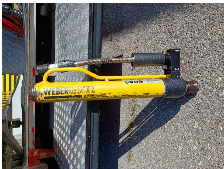
Slika 11. Hidraulični cilindar

Hidraulični cilindri se koriste samostalno ili s nastavcima za produženje, ali i često u kombinaciji s hidrauličnim razupiračem. Najčešće se koriste kod prometnih nesreća za razdvajanje prednjeg dijela vozila i armaturene ploče od unesrećenog.