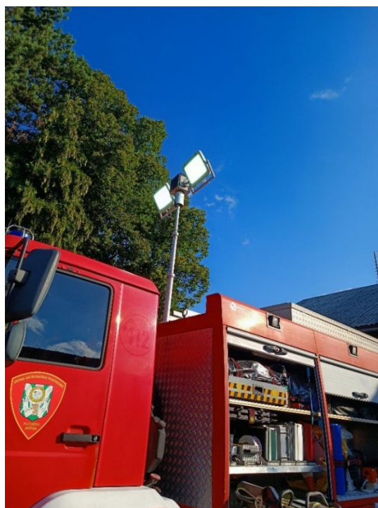
Slika 17. Stabilni reflektor na vozilu [6]