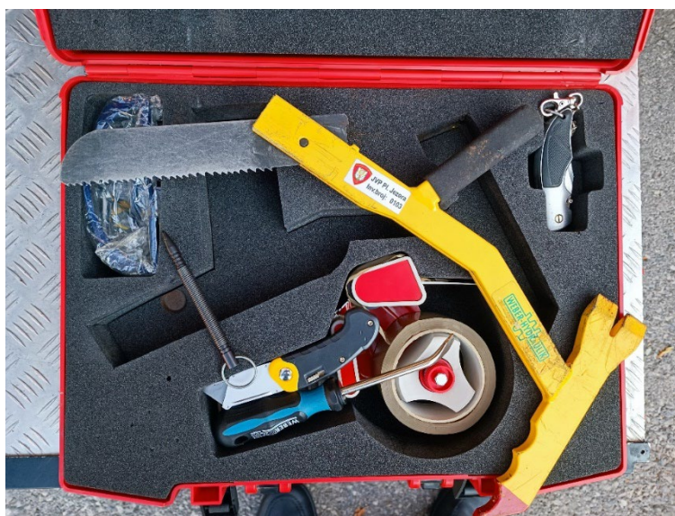
Slika 20. Razbijač višeslojnog stakla i razbijač bočnih stakala(udarna igla) [6]

Osim navedene opreme na intervenciji se koriste i neki drugi alati i naprave koje doprinose brzom oslobađanju putnika, očuvanju opreme i sigurnosti. Prvenstveno se misli na sljedeću opremu: prostirka za odlaganje hidrauličnog i pneumatskog alata, rezači višeslojnog stakla i razbijač bočnih stakala (slika 20.), podmetači, bridni jahači, rezač pojasa, navlaka za zračni jastuk u volanu i suvozačev zračni jastuk, polimerna pokrivala za zaštitu od prorezivanja, ubodna pila, motorna cirkulacijska pila (slika 21.), ručni alat, ugradbeno vitlo na vatrogasnom vozilu (slika 22.), naprave za stabilizaciju vozila. Dio opreme će biti prikazan na sljedećih nekoliko slika. [16]