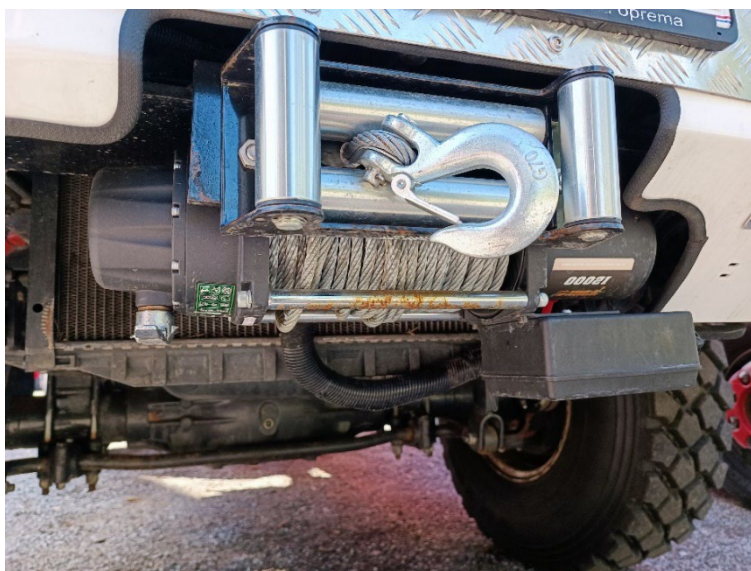
Slika 22. Ugradbeno vitlo na vozilu [6]

Motorna cirkulacijska pila služi za rezanje metalnih, čeličnih i betonskih površina. Višenamjenska uporaba ove pile omogućava vatrogascima brži i lakši pristup na mjestu intervencije gdje je potrebno napraviti ulaz ili nešto presjeći.