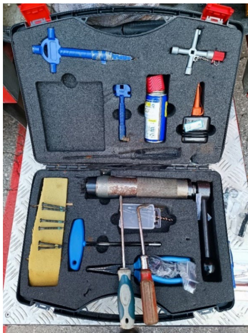
Slika 27. Alat za otvaranje vrata na objektu [6]

Za otvaranje vrata na stanovima i kućama kada ostane ključ u bravi ili pukne, koriste se specijalni vijci, alat za lom cilindra, ručni natezač cilindra, multifunkcijski set ključeva (slika 27.) i aku bušilica (slika 28.).