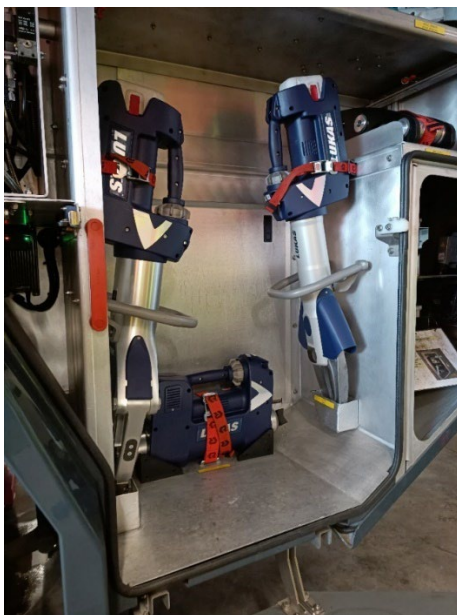
Slika 13. Baterijski hidraulični alat [6]

Veliku prednost ima hidraulični alati na baterijski pogon. (Slika 13.) Danas se sve više koriste baterijski alati čije su pumpe pogonjene elektromotorom koji se napaja iz baterije. Prednost je svakako kraće vrijeme da bi se uređaj doveo u rad, manje prostora koji se zauzima u vatrogasnom vozilu, rad bez buke, rad bez ispušnih plinova, bez ograničenja pri kretanju (cijevi se ne pletu), manja težina (što je posebno bitno kada se alat mora prenositi dalje od vozila) i ono što je najbitnije, veća sigurnost. Naime, najveća ugroza za vatrogasce pri radu s ovim alatom je bila puknuće visokotlačnog uljnog crijeva pri čemu nastaju nesagledive posljedice, a toga kod baterijskih alata nema. [17]