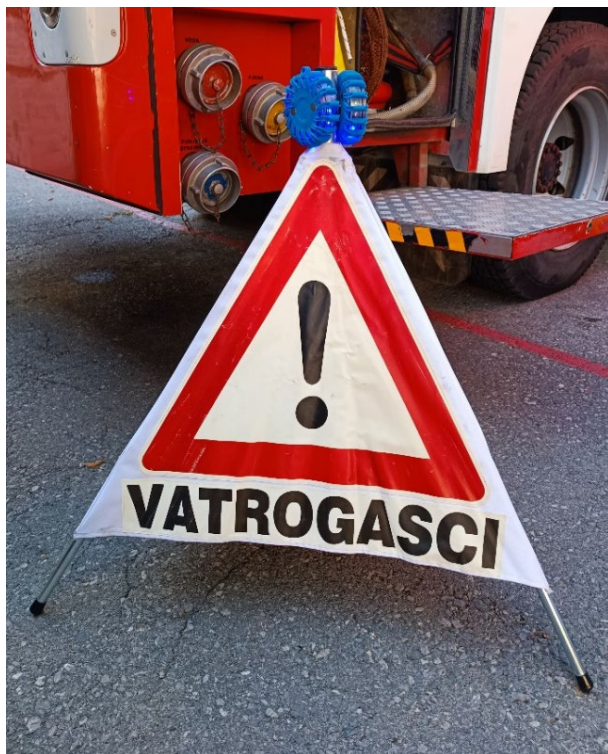
Slika 18. Trokut upozorenja [6]

Stabilni reflektori se najčešće koriste noću. Većina reflektora koje vatrogasci koriste su led reflektori. Za rad led reflektora je potrebna manja količina struje, a njihovo osvjtljenje je puno bolje nego kod reflektora koji imaju žarulju sa žarnom niti. Nabava reflektora na vozilima nije toliko česta već se mijenjaju kada pregore.