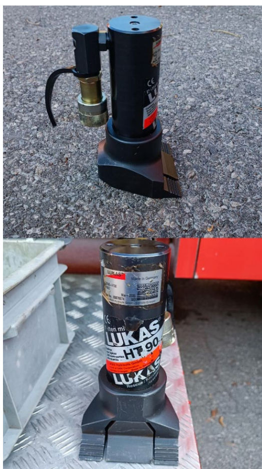
Slika 29. Medvjeda šapa [6]

Vrata možemo u hitnim situacijama otvarati specijalnim razupiračem za nasilno otvaranje vrata popularno zvan “medvjeda šapa“. (Slika 29.)