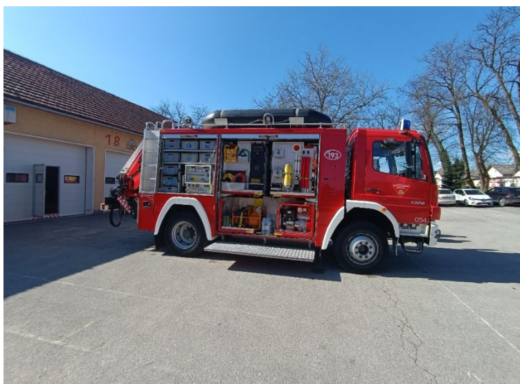
Slika 3. Tehničko vozilo teško s kranom [6]

masa vozila iznosi 16 000 kg. Posada vodila može biti najmanje 3 člana ili za najviše 6. Vozilo ima vitlo nazivne vučne sile od 150 kN, te generator trofazne izmjenične struje nazivne snage 15-20 kVA i rasvjetni stup s tri reflektora , svaki po 1000 W.(Slika 3.)[5]