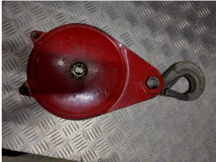
Slika 4. Kolotura za privlačenje tereta [6]

Postoji nepomična i pomična kolotura, kao i razni sustavi kolotura.