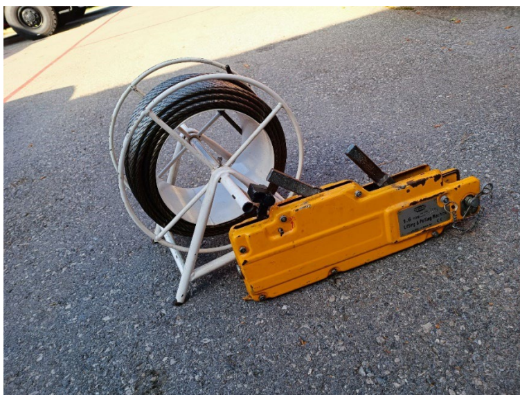
Slika 16. Univerzalni uređaj za vuču [6]

U prometnim nesrećama može se očekivati da unesrećena vozila neće uvijek stajati na svojim kotačima, što znači da mogu biti prevrnuti na bok ili krov te nisu sigurna za rad dok se ne osiguraju. Vozilo će možda biti u poziciji klizanja niz kosinu ili će biti nestabilno i prijetit će opasnost od prevrtanja. Prva zadaća spasilaca bi tada bila stabilizacija vozila s univerzalnim uređajem za vuču. Osim stabilizacije s ovim uređajem može se pomicati teret, samostalno ili uz pomoć kolotura. (Slika 16.) [16]