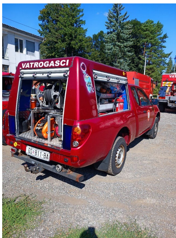
Slika 1. Tehničko vozilo malo [6]

Tehničko vozilo malo, Mitsubishi, godina proizvodnje 2006., pogon 4x4, za prijevoz 3 vatrogasaca. U vozilu se nalazi hidraulični alat, visokotlačno vitlo i spremnikom pjene u slučaju manjeg požara, alat i oprema za rad s motornom pilom, motorna pila, reflektor za osvjetljavanje. Vozilo služi za manje tehničke intervencije poput uklanjanja zmija, stršljenova, drveća s prometnica.