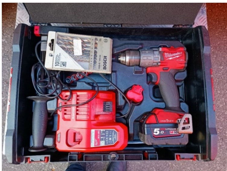
Slika 28. Aku bušilica [6]

Alat za otvaranje vrata na objektu se koristi kada je potrebno otvoriti vrata ukoliko se zaglavi ključ ili zablokira cilindar.