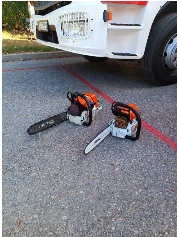
Slika 26. Motorne pile [6]

Motorne pile u vatrogastvu služe za izvršavanje zadataka pri tehničkim i požarnim intervencijama. Koriste se za rušenje stabala, potkresivanje grana i raspiljavanje trupaca koji su opasni za ljude i objekte, pravljenje protupožarnih prosjeka, za oslobađanje prikliještenih osoba pri spašavanju, za pravljenje prolaza za prolazak vozila, za stvaranje puteva navale ili puteva spašavanja te za stvaranje otvora za odvođenje dima i topline, za piljenje drvenih konstrukcija, za stvaranje otvora u zidovima, stropovima i podovima. Moguće je i stvaranje otvora u ledu.