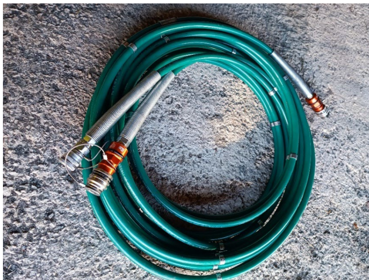
Slika 12. Hidraulične cijevi za pogon hidrauličnog alata [6]

Jedan od glavnih dijelova hidrauličnog alata su hidraulične cijevi. Hidraulične cijevi nalazimo u svim hidrauličnim alatima, osim kod kombiniranog hidrauličnog alata s ručnom mehaničkom pumpom ili hidrauličnog alata s baterijskim pogonom. Radni tlakovi u cijevima iznose i preko 700 bara te je zbog sigurnosti rukovatelja hidrauličnim alatom posebnu pažnju potrebno posvetiti da se cijevi ne oštete. [16] (Slika 12.)