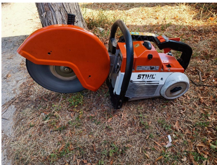
Slika 21. Motorna cirkulacijska pila [6]

Motorna cirkulacijska pila služi za rezanje metalnih, čeličnih i betonskih površina. Višenamjenska uporaba ove pile omogućava vatrogascima brži i lakši pristup na mjestu intervencije gdje je potrebno napraviti ulaz ili nešto presjeći.