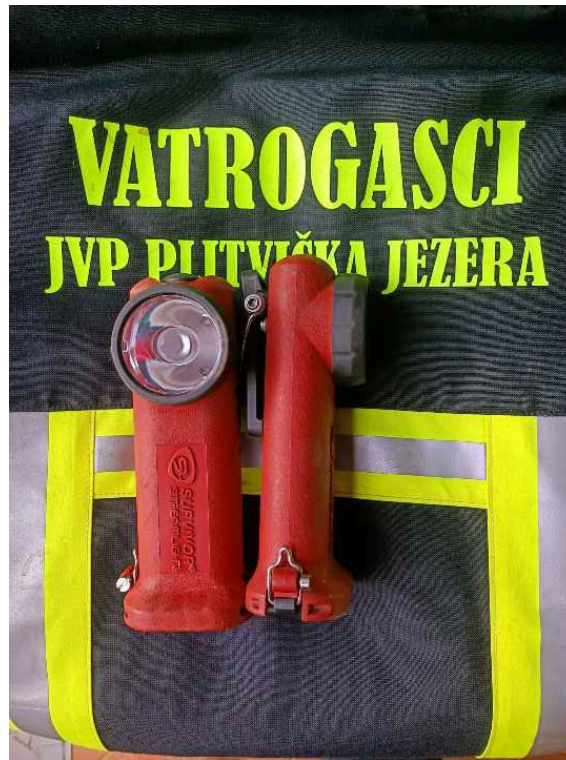
Slika 19. Baterijske lampe [6]

Prijenosna baterijska lampa proizvođača streamlight. Ovaj model je jedan od najčešće upotrebljivanih i najpouzdanijih modela svjetiljke kod vatrogasaca. Namijenjena je za nošenje na vatrogasnoj jakni. Kvaliteta ovih baterija omogućava vatrogascima siguran rad. Baterija ima tri načina svjetljenja, titrajući odnosno bljesak za signalizaciju, nisku svjetlost i visoku svjetlost. Visoka svjetlost ima najjači snop svjetlosti, preko 450 m, ali duljina trajanja svjetljenja je kraća u odnosu na nisku svjetlost i bljesak za signalizaciju. Velika prednost ovih baterija je što se pune na 220 V i što se mogu puniti auto punjačima 12V.