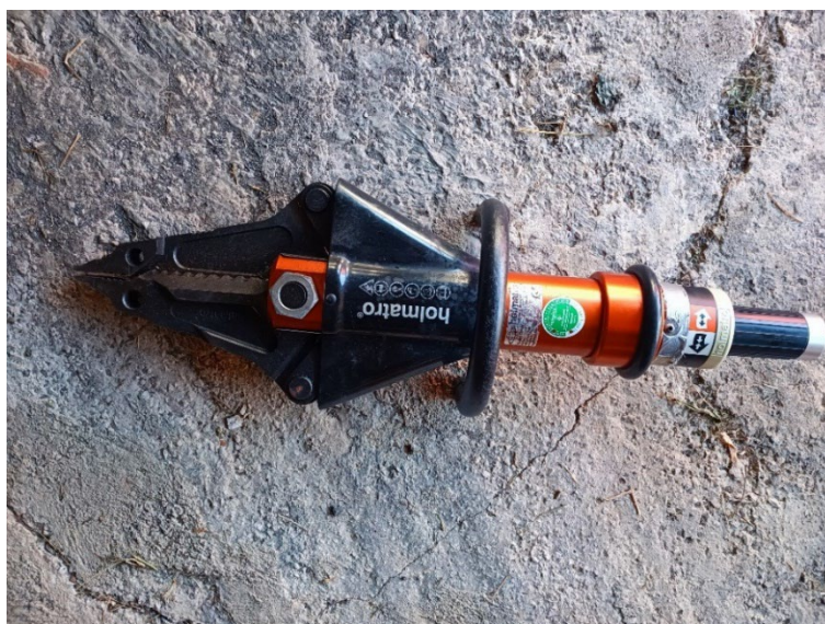
Slika 10. Kombinirani hidraulični alat [6]

Kombinirani hidraulični alat vatrogascima omogućava brži rad. Njegova najveća prednost je što može služiti kao hidraulična razupora te kao hidraulične škare. Za rezanje dijelova automobila i spašavanje iz istog je jako učinkovit, snaga mu je zadovoljavajuća.