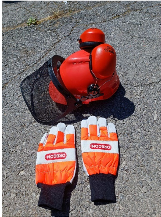
Slika 24. Kaciga, antifoni i anti vibracijske rukavice [6]

Kaciga pri radu s motornom pilom služi za zaštitu glave, važna je zbog mogućeg pada grana sa stabla. Antifoni služe za smanjenje buke koje proizvodi motorna pila. Anti vibracijske rukavice smanjuju vibracije koje prenosi motorna pila na osobu koja radi s motornom pilom te pruža sigurnost u slučaju da ne dođe do oštećenja i povrede ruku.