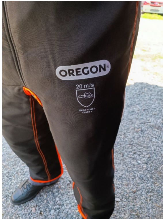
Slika 25. Zaštitne hlače [6]

Zaštitne hlače upotrebljavaju se pri radu s motornom pilom. Pružaju sigurnost, smanjuju moguće opasnosti koje bi mogle nastati. Njihova najveća uloga je sprječavanje posjekotine koje može nastati od lanca koji se nalazi na vodilici pile.