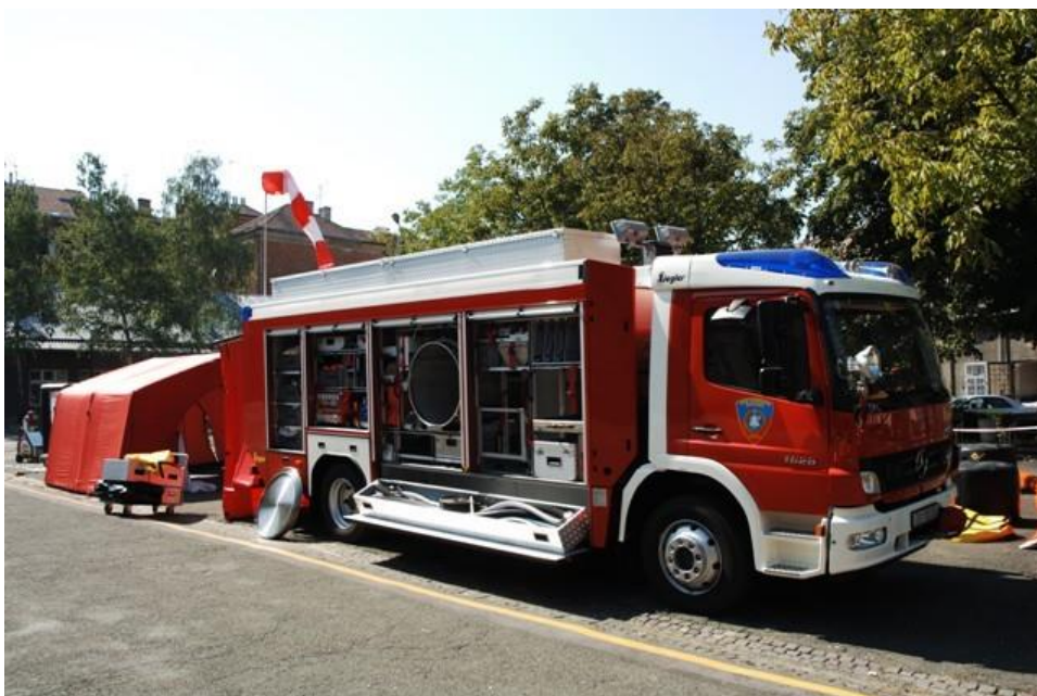
Slika 17. Akcidentno vozilo [28]

Akcidentno vozilo (prikazano na slici 17.) ili vozilo za opasne tvari dio je organizacijske skupine vozila i opreme koja se naziva taktička jedinica. Uz njega su tu još i vozilo za gašenje požara te tehničko vozilo.