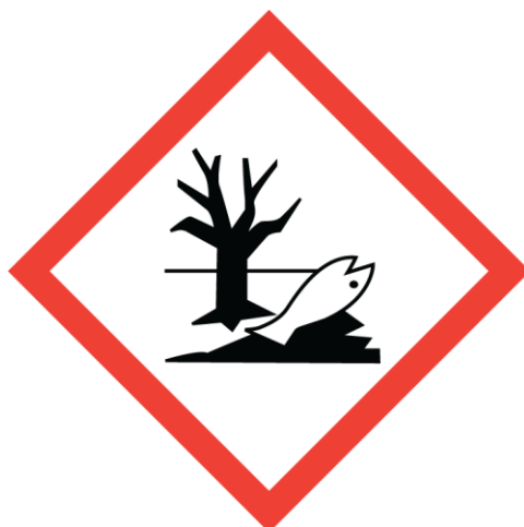
Slika 2. Piktogram opasnosti [10]