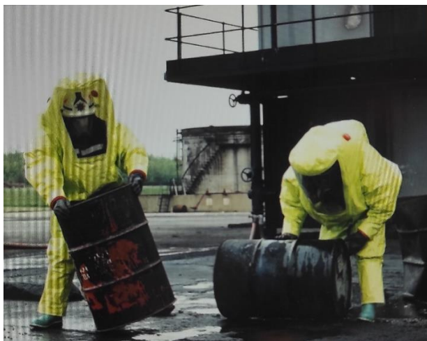
Slika 18. Odijelo za zaštitu od nagrizajućih tekućina [23]