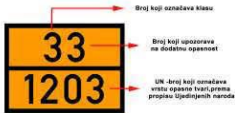
Slika 13. Listica opasnosti [24]

Bilo koje vozilo koje prevozi opasne tvari mora biti propisno označeno, u skladu sa ADR – om. Oznaka je ploča narančaste boje s crnim obrubom debljine 15 mm. (prikazano na slici 13.) Podijeljena je crnom vodoravnom linijom debljine također 15 mm na dva jednaka dijela. Brojevi u poljima visoki su 100 mm te moraju biti debljine 15 mm. Uvjet je da brojevi budu čitki i vidljivi čak i nakon 15 minuta direktne izloženosti vatri. Narančasta boja mora biti reflektirajuća, a dimenzije cijele ploče 400x300 mm.