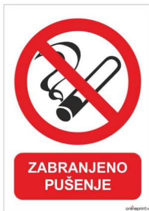
Slika 6. Znak zabrane pušenja [15].

U luci, u područjima u kojima se rukuje opasnim tvarima zabranjeno je: