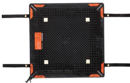
Slika 20. Visokotlačni jastuk za zaustavljanje istjecanja [23]

Kako bi se istjecanje zaustavilo jastuk se postavi na pukotinu većeg promjera, pričvršćuje se zateznim trakama te napuhuje zrakom sve dok istjecanje ne stane. Napuhivanje se izvodi preko sigurnosnog ventila kako se ne bi prekoračio tlak koji jastuk podržava, a da bi se jastuk napuhao mogu se koristiti boca aparata za disanje, nožna ili ručna crpka i sl. bitno je ne prekoračiti tlak u jastuku jer bi u suprotnom došlo i do oštećenja samog jastuka, ali i cisterne, spremnika ili cjevovoda na koji je jastuk postavljen. Ukoliko se radi o istjecanju kiseline na jastuk se navuče protukiselinska zaštita.