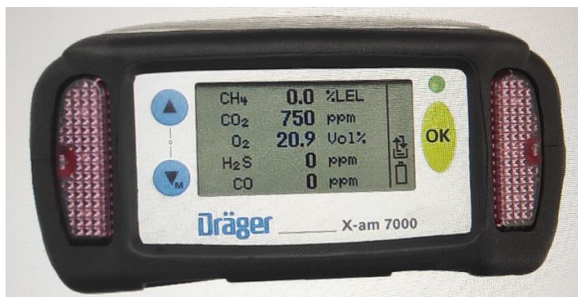
Slika 19. Eksploziometar [23]