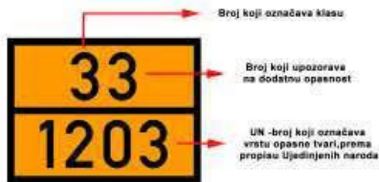
Slika 13. Listica opasnosti [24]

Bilo koje vozilo koje prevozi opasne tvari mora biti propisno označeno, u skladu sa ADR – om. Oznaka je ploča narančaste boje s crnim obrubom debljine 15 mm. (prikazano na slici 13.) Podijeljena je crnom vodoravnom linijom debljine također 15 mm na dva jednaka dijela. Brojevi u poljima visoki su 100 mm te moraju biti debljine 15 mm. Uvjet je da brojevi budu čitki i vidljivi čak i nakon 15 minuta direktne izloženosti vatri. Narančasta boja mora biti reflektirajuća, a dimenzije cijele ploče 400x300 mm.