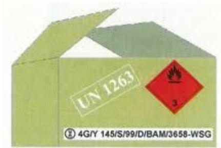
Slika 4. Prikaz pravilnog označavanja paketa opasne tvari [12]

Na slici 4. jasno se vidi kako ambalaža mora biti pravilno označena prilikom prijevoza opasnih tvari; UN – brojem opasne tvari, listicom opasnosti koja je propisana za taj UN broj te certifikacijskim kodom ambalaže. Oznake moraju biti trajne i vidljive te ne smiju biti prekrivene ili zaklonjene nekim dijelom ili dodatkom ambalaže ili nekom drugom oznakom ili obilježjem.