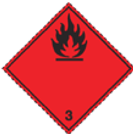
Slika 1. Oznaka opasnosti za zapaljive tekućine [9]

Zapaljivu tekućinu prepoznajemo po oznaci koju prikazuje slika 1.