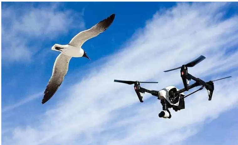
Slika 7. Opasnost za ptice

Iako trenutno nemamo dovoljno podataka o dugoročnim fiziološkim i ekološkim posljedicama, postoje indikacije da bi UAS mogli izazvati stresne reakcije kod životinja, što bi moglo utjecati na njihovu reprodukciju i opstanak.