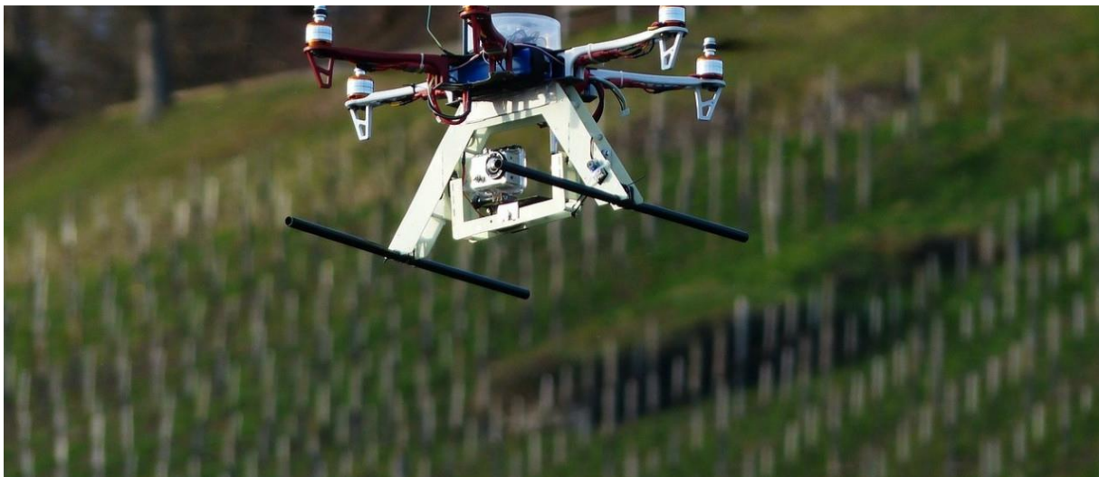
Slika 2. Primjena bespilotne letjelice u poljoprivredi

Snimanje iz zraka u Republici Hrvatskoj regulirano je Uredbom o obrani (NN 73/2013) i Uredbom o snimanju iz zraka (NN 130/2012). Pravilnikom o snimanju iz zraka utvrđuju se uvjeti pod kojima je moguće snimati snimke iz zraka kopna i teritorijalnih voda Republike Hrvatske, kao i uvjet pod kojima te slike mogu biti objavljene u javnosti. Snimanje iz zraka dozvoljeno je isključivo fizičkim i pravnim osobama koje su registrirane za tu djelatnost na trgovačkom sudu u Republici Hrvatskoj.