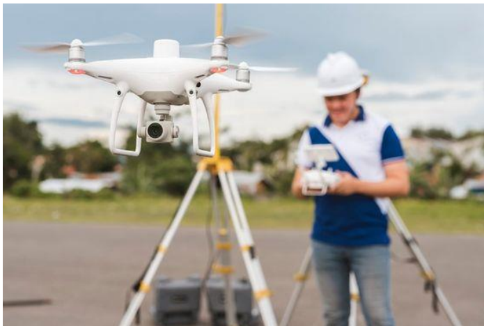
Slika 6. Беспилотна летјелија за ласерско скенирање ( LiDAR)

Od navedenih, najčešće se koristi lasersko snimanje iz zraka ( ALS ), pri čemu su avion ili helikopter platforme koje nose skener. Lasersko skeniranje iz zraka omogućuje najbolji pristup velikim površinama terena i nudi visoku pokretljivost skenera, dok je lasersko snimanje sa zemlje ( TLS ) pogodnije za ograničena područja, izuzetno strme terene te za pojedinačna detaljna snimanja. Iako je princip određivanja koordinata mjernih točaka u oba sustava identičan, oni se razlikuju po tehnologiji, stoga će svaki sustav biti zasebno prikazan, s naglaskom na laserskim skeniranjima iz zraka.