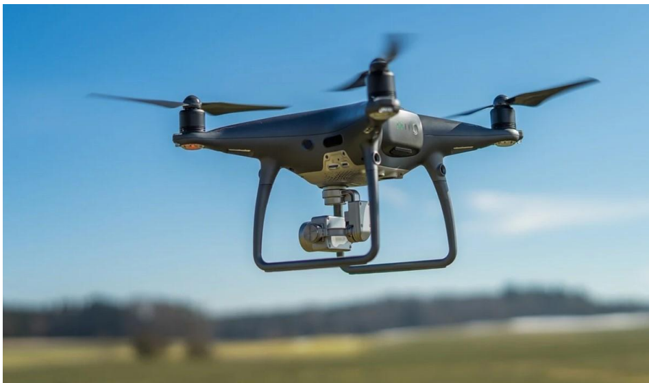
Slika 1. Bespilotna letjelica

U najširem smislu, letjelice se dijele na dvije glavne kategorije: svemirske letjelice i one koje lete unutar Zemljine atmosfere. Budući da je osnovni medij unutar Zemljine atmosfere zrak, ova druga skupina letjelica naziva se zrakoplovima. Zrakoplov koji je namijenjen letenju bez pilota a može biti daljinski upravljani ili programiran za autonomno djelovanje, definira se kao bespilotna letjelica ili dron. Postoji mnogo različitih tipova bespilotnih letjelica s različitim karakteristikama i mogućnostima, prilagođenih potrebama korisnika. Nekoliko skupina zatražilo je uspostavu referentnog standarda za međunarodnu zajednicu bespilotnih letjelica (UAV).