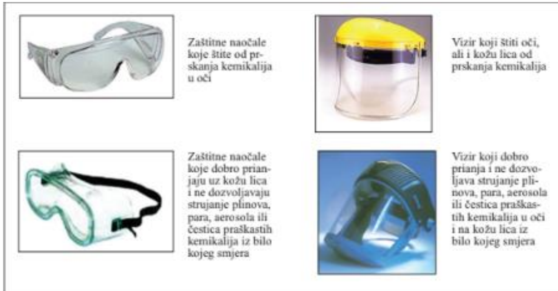
Slika 10. Zaštita očiju