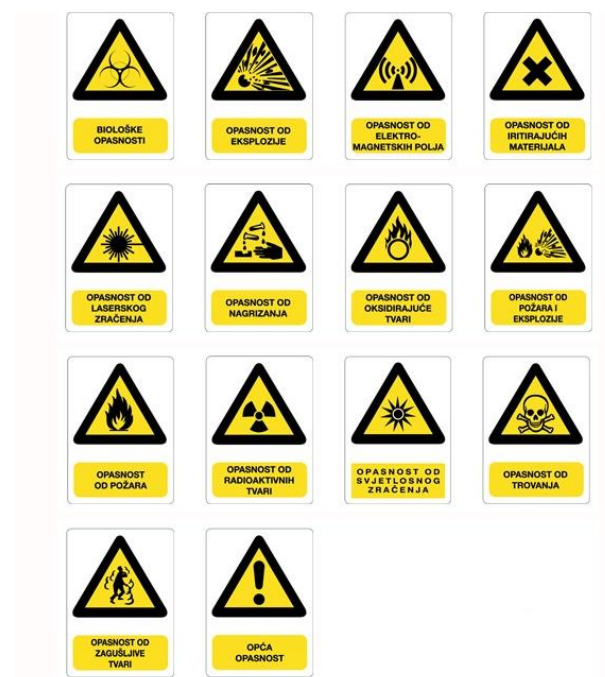
Slika 3. Znakovi opasnosti