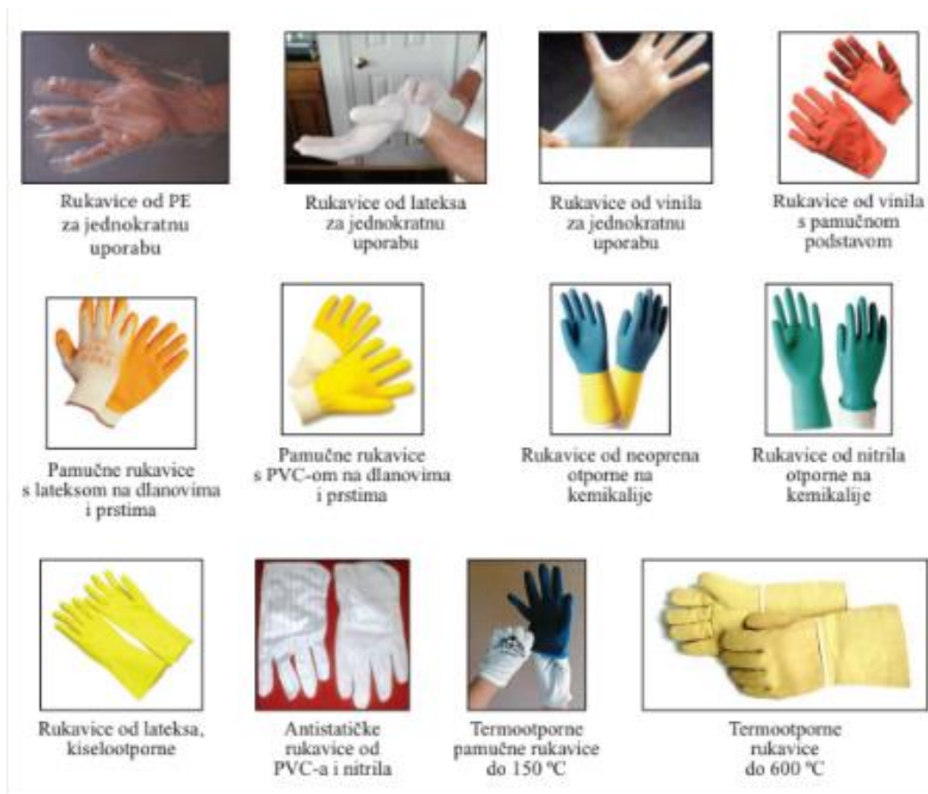
Slika 9. Zaštitne rukavice