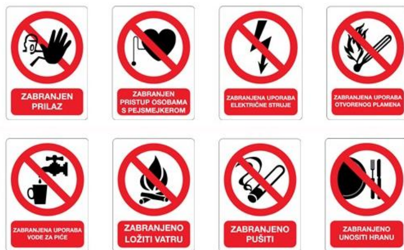
Slika 4. Znakovi opasnosti