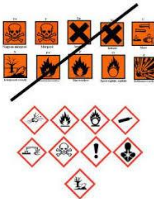
Slika 7. Znakovi i piktogrami opasnosti