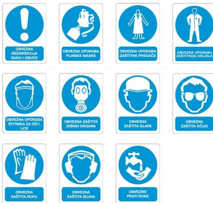
Slika 5. Znakovi obveza