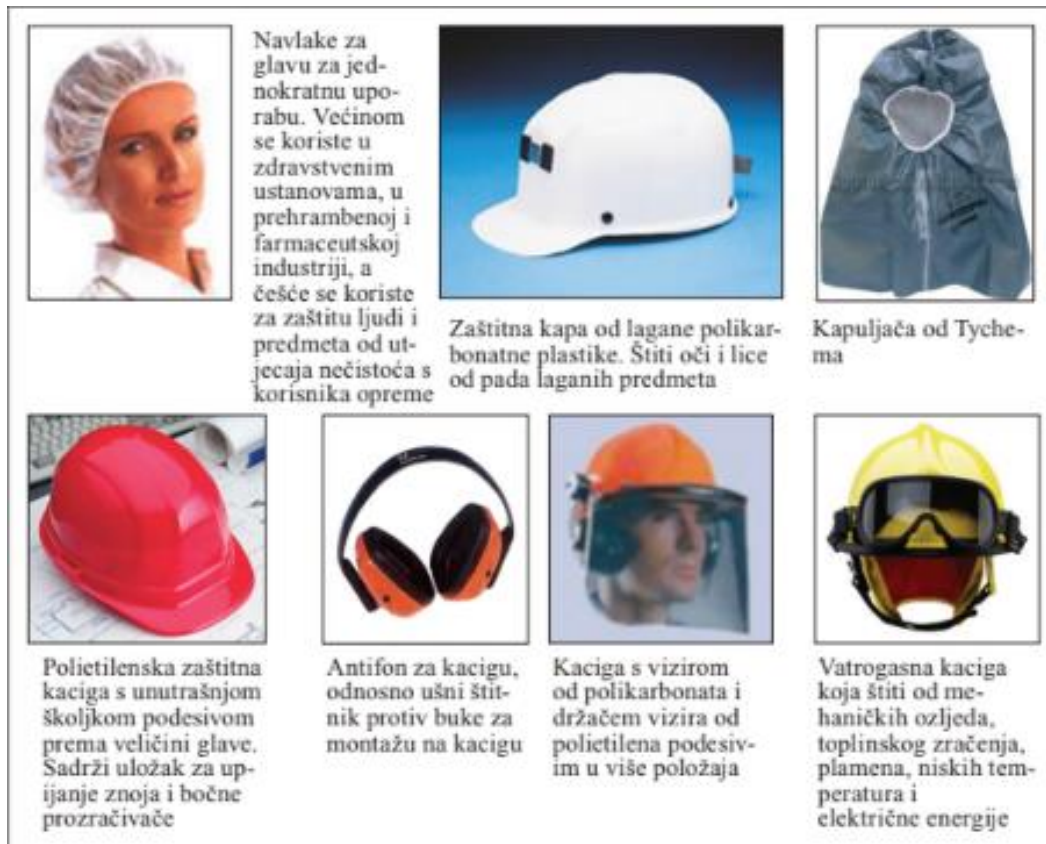
Slika 11. Zaštita glave