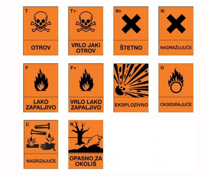
Slika 2. Označavanje otrova