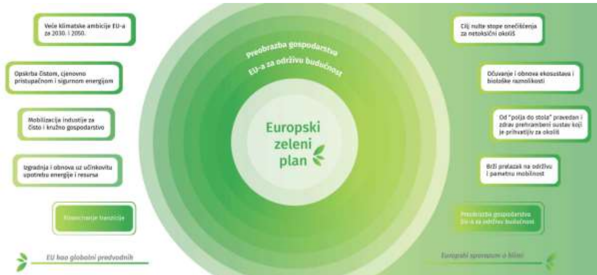
Slika 3: Shematski prikaz ciljeva Green deala Europske unije [25].

sektor koji će se u velikoj mjeri temeljiti na obnovljivim izvorima“, osigurati pristupačnu opskrbu energijom u EU i imati „potpuno integrirano, međusobno povezano digitalno tržište energije EU“ [24].