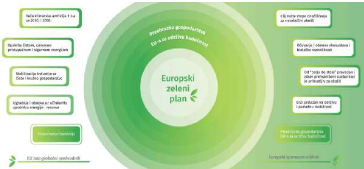
Slika 3: Shematski prikaz ciljeva Green deala Europske unije [25].

sektor koji će se u velikoj mjeri temeljiti na obnovljivim izvorima“, osigurati pristupačnu opskrbu energijom u EU i imati „potpuno integrirano, međusobno povezano digitalno tržište energije EU“ [24].