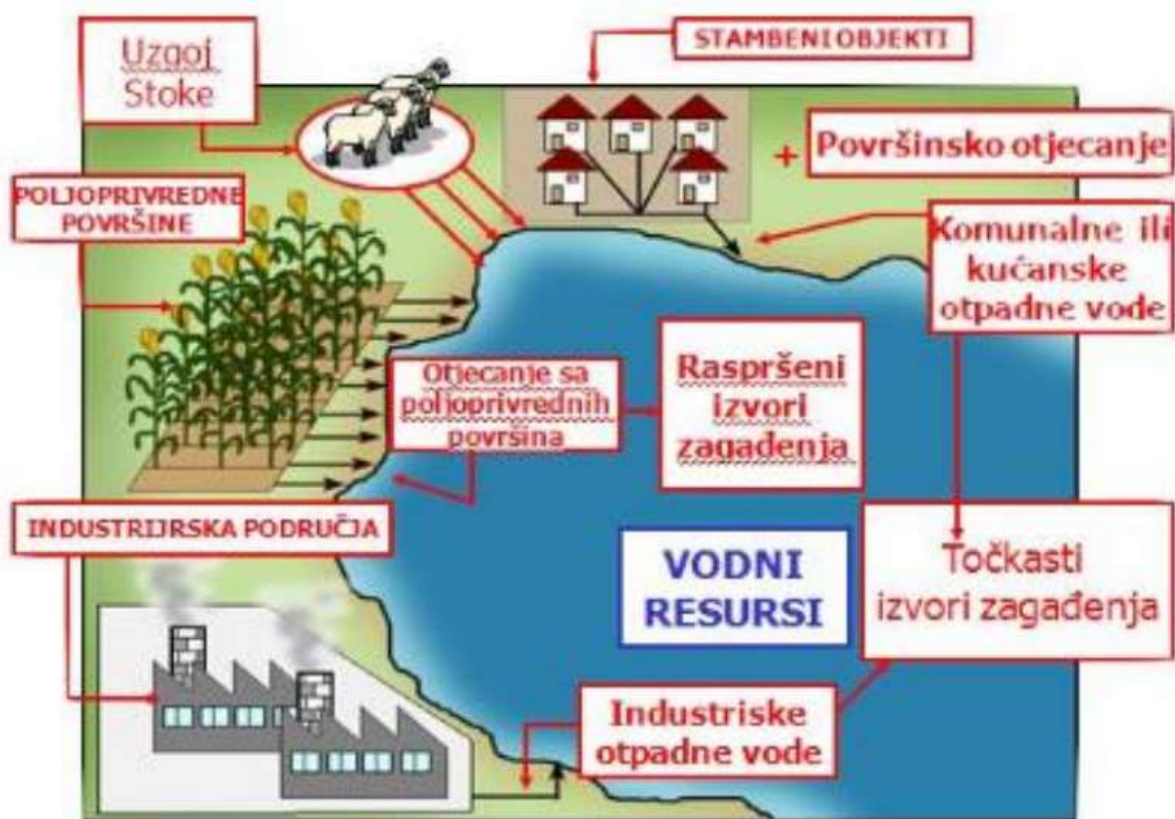
Slika 2: izvori nastanka otpadnih voda [9].

Izvori nastanka otpadnih voda prikazani su na slici u nastavku: