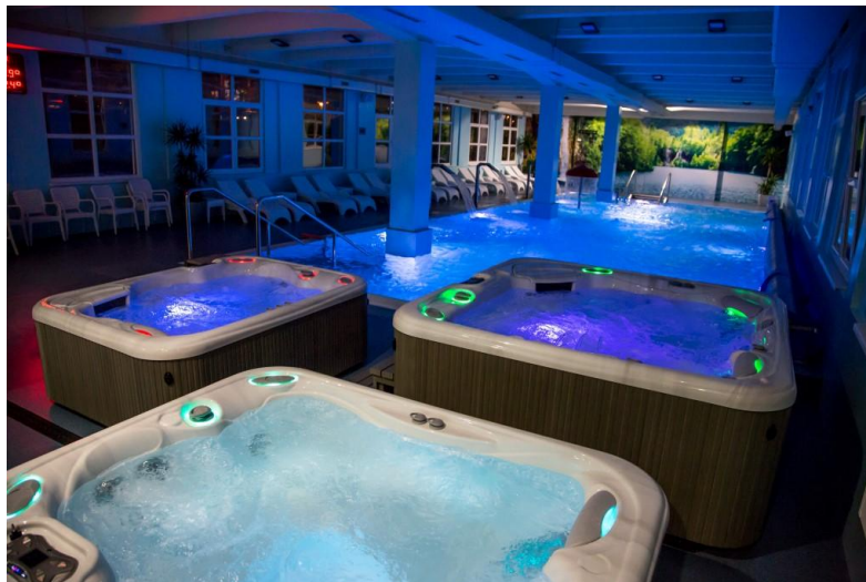
Slika 7: Bazen i jacuzzi-ji kao dio kompleksa "GoLife"

Projekcija prodaje i prihoda također je bitan element poduzetničkog pothvata. Ukupan prihod od prodaje čine proizvodi, roba, usluge i prava.