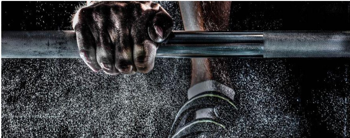
Slika 8: Motivacija i inovativnost

Ovaj poslovni pothvat zahtijeva ukupno 7 stalnih zaposlenika. Projekcija zaposlenika načinjena je na 8 - satnom radnom danu. Mjesečna bruto plaća menadžera iznosi 12.000,00 kn, tri trenera 21.000,00 kn, jednog knjigovođe 8.000,00 kn, jedne čistačice 7.000,00 kn te jednog trgovca 7.000 kn. Ukupne mjesečne plaće iznose 55.000,00 kn, što je godišnje 660.000,00 kn.