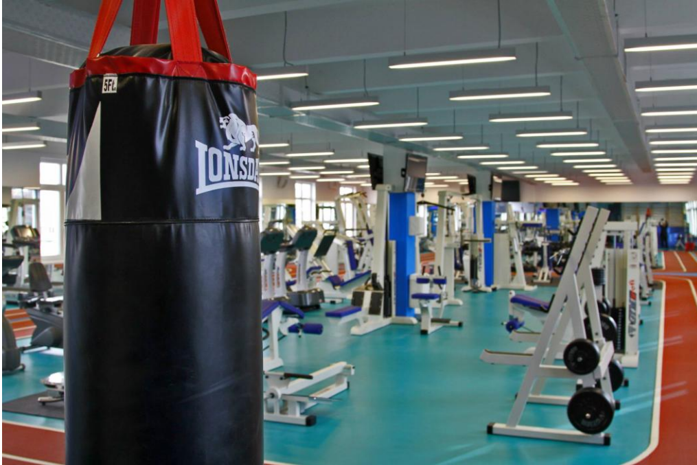
Slika 1: Fitness centar „GoFit“

Ono predstavlja procese u kojima se razvijaju inovativni procesi i proizvodi kreiranjem poduzetničke kulture u organizaciji, a može se javiti u različitim oblicima.