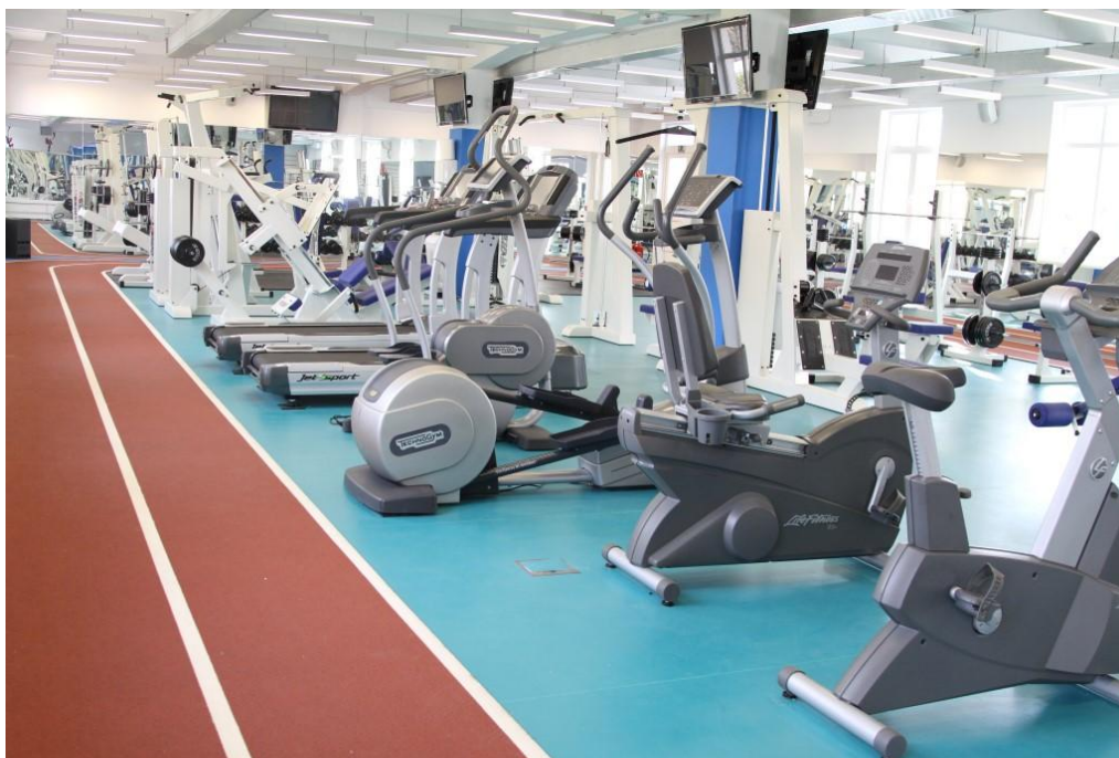
Slika 3: Teretana „GoFit“– interijer