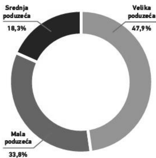
Grafikon 1: Ukupan prihod prema veličini poduzeća u 2013. godini