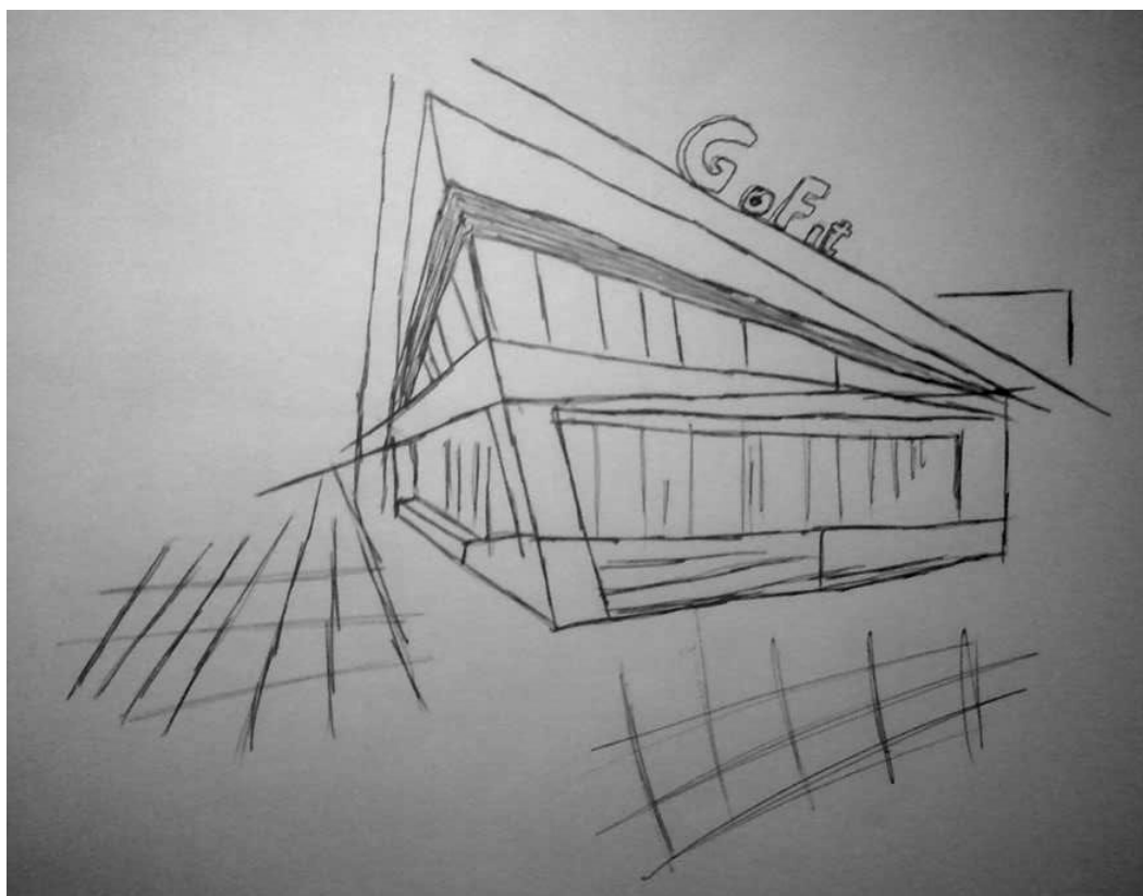
Slika 10: Skica objekta