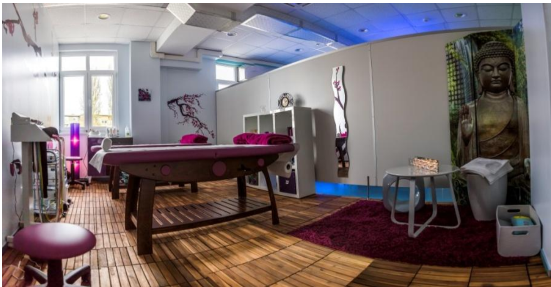
Slika 2: Wellness kao dio kompleksa "GoLife"

Učinkovitost ovog poduzetničkog projekta analizirala se u izračunima ocjena profitabilnosti, od kojih možemo izdvojiti sljedeće: razdoblje povrata, stopa prinosa, pravilo palca, točka pokrića, čista sadašnja vrijednost, interna stopa profitabilnosti, prosječna profitabilnost, analiza likvidnosti i analiza osjetljivosti. Svi izračuni su pokazali izrazitu profitabilnost i isplativost ovog poduzetničkog projekta otvaranja novog Fitness centra u Karlovcu.