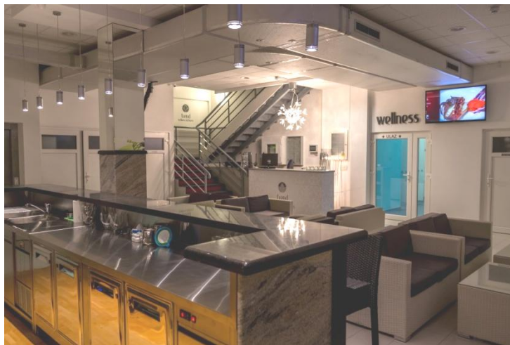
Slika 5: Recepcija i Caffe bar

Autor projekta vrlo je odgovorna, ambiciozna i kreativna osoba. Završava Tehničku školu u Karlovcu, smjer računalni tehničar za strojarstvo, zapošljava se na lokalnoj televiziji gdje radi već šest godina i stječe vrlo kvalitetno iskustvo na području poduzetništva, marketinga, inovativnosti i kreativnosti. Govori engleski jezik te posjeduje vrlo kvalitetna znanja na području informatike. Profesionalni cilj je daljna edukacija i usavršavanje, stoga ambiciozno kreće u novi pothvat: otvorenje Fitness centra.