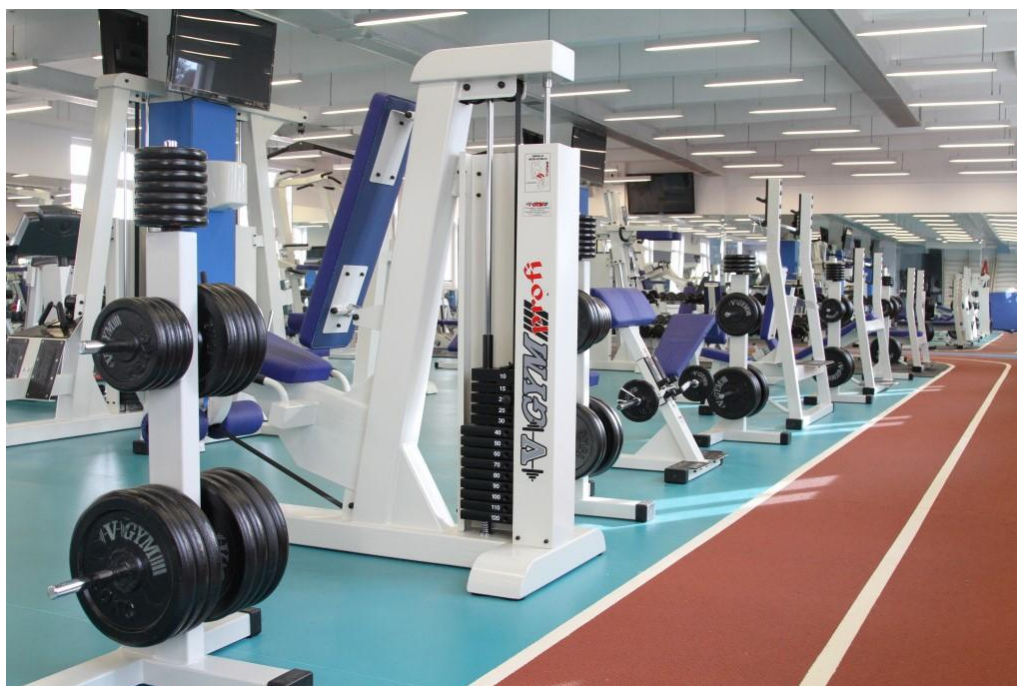
Slika 4: Teretana „GoFit“– interijer