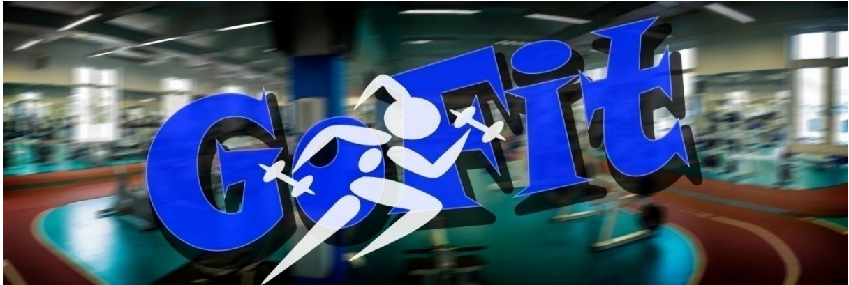
Slika 9. Zaštitni znak tvrtke