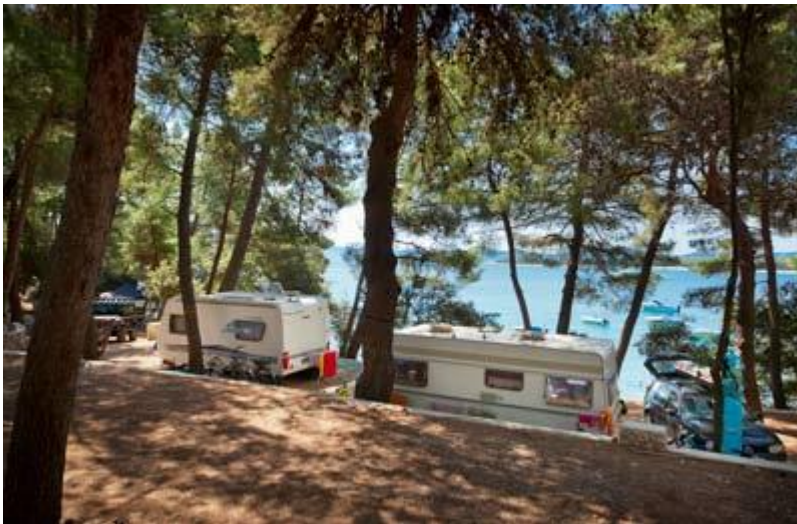
Slika 3: Kamp Baldarin