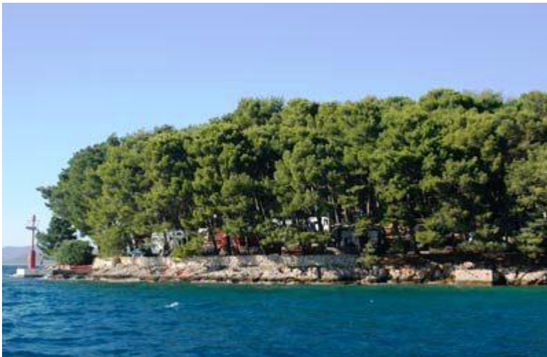
Slika 4: Kamp Bijar