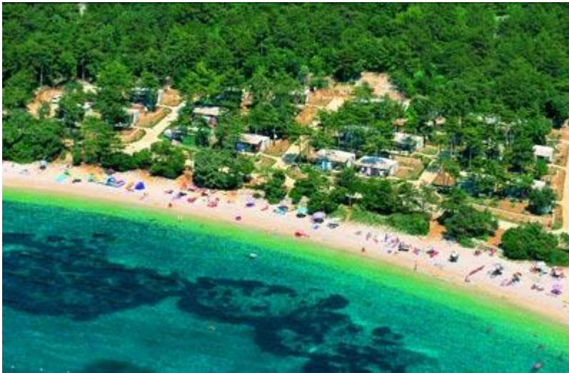
Slika 2: Kamp Slatina