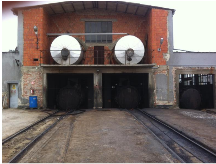
Slika 6. Operacioni cilindri impregnacije [1]