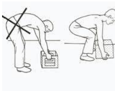
Slika 9. Nepravilan i pravilan način podizanja tereta [5]