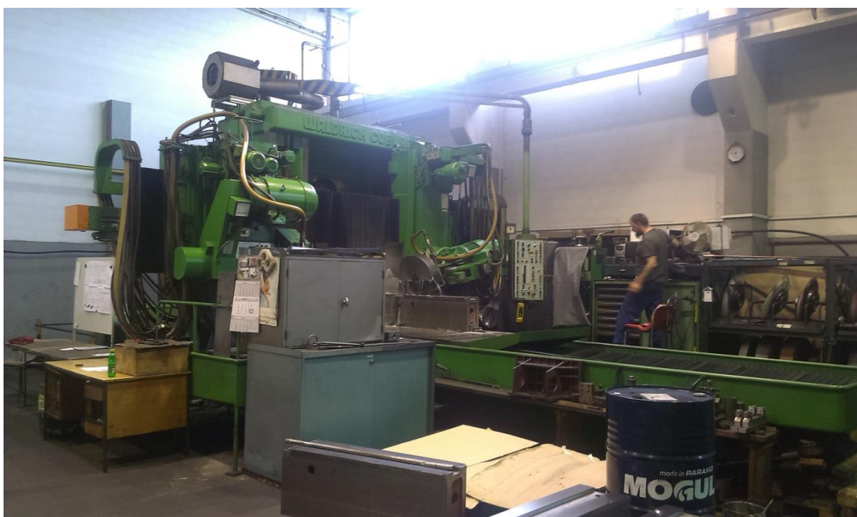
Sl.5: Teška strojna obrada [1]