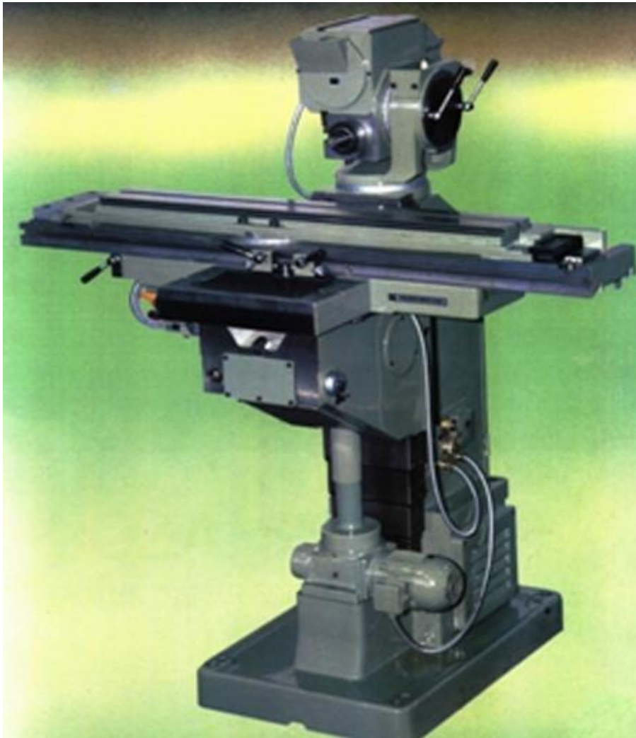
Sl.10: Uoza-55 [5]