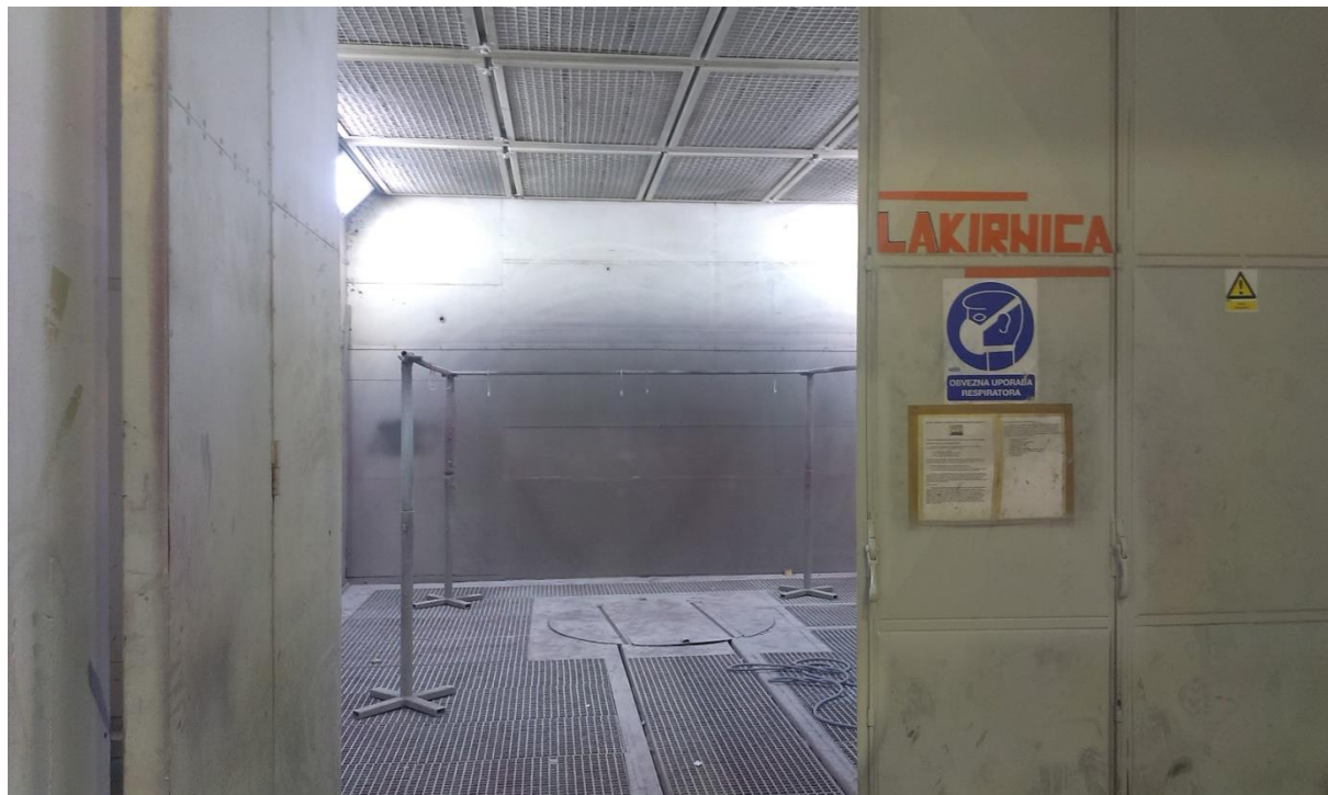
Sl.7: Kabina za ličenje [1]

Ličenje komada iz montaže se vrši u slučaju kad proces proizvodnje zahtjeva montažu (pripasivanje) komada, a nakon demontaže, ličenje, po zahtjevu radne operacije iz radne dokumentacije. Nakon sušenja komad se vraća u montažu.