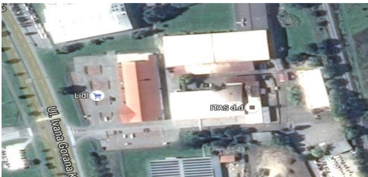
Sl.3: Prikaz iz zraka [2]