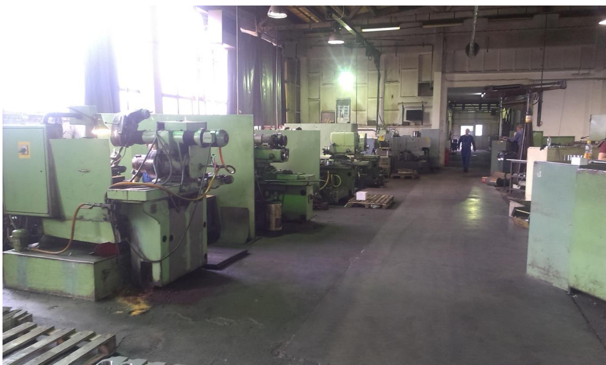
Sl.4: Laka strojna obrada [1]