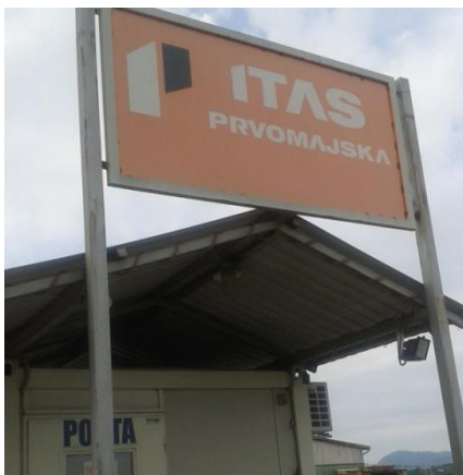
Sl.1: Logo tvrtke; ulaz u tvornicu [1]

Pod današnjim imenom, ITAS-PRVOMAJSKA d.d., tvrtka posluje od 01.01.2007. godine. Uspješno surađuje s više ino partnera za koje izrađuje alatne strojeve, a među kojima je najvažniji partner po broju narudžbi KUNZMANN iz Njemačke. Gaje sistem kontrole kvalitete ISO 9001:2008.