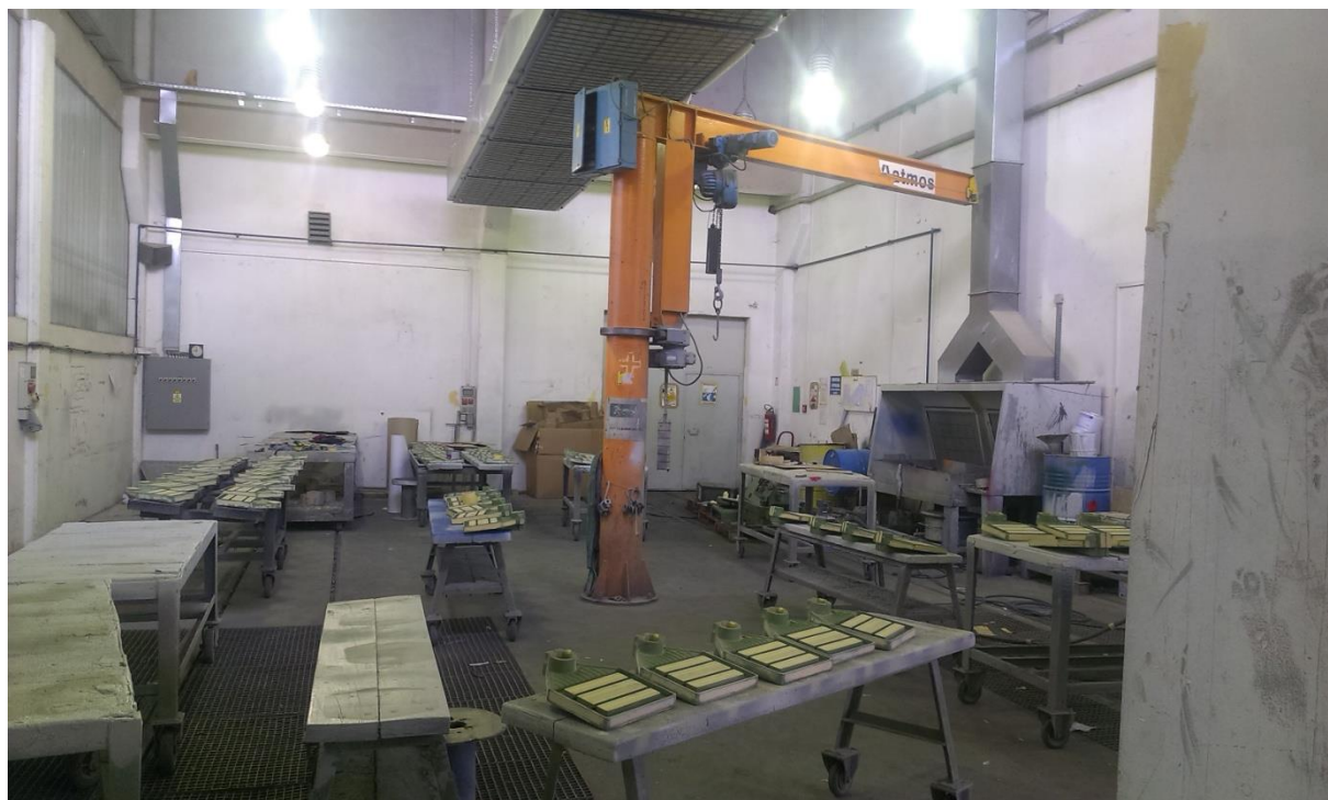
Sl.8: Ličiona [1]