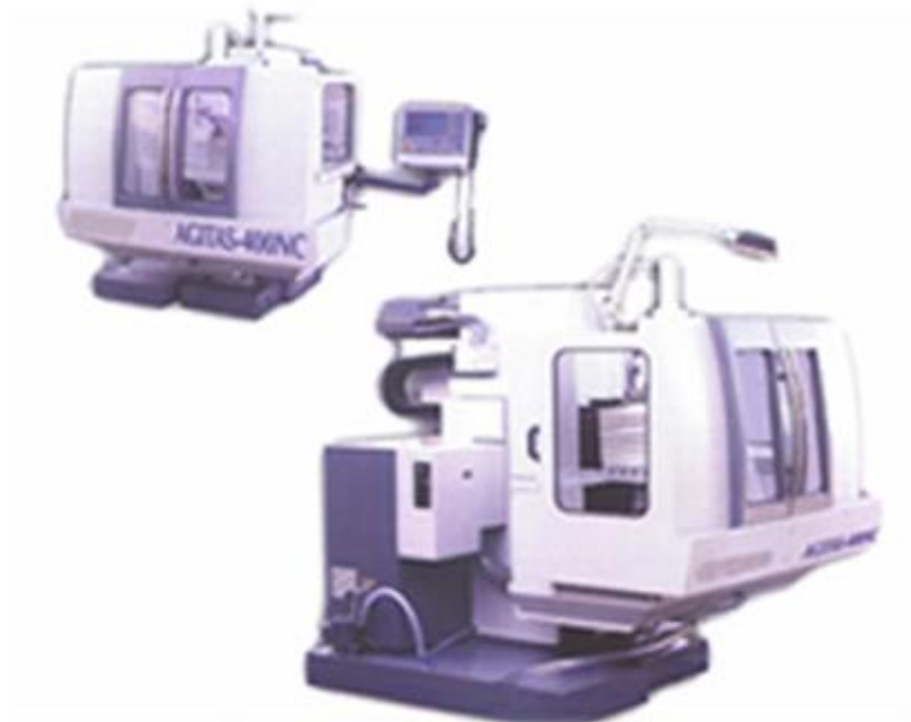
Sl. 9: Agitas [4]