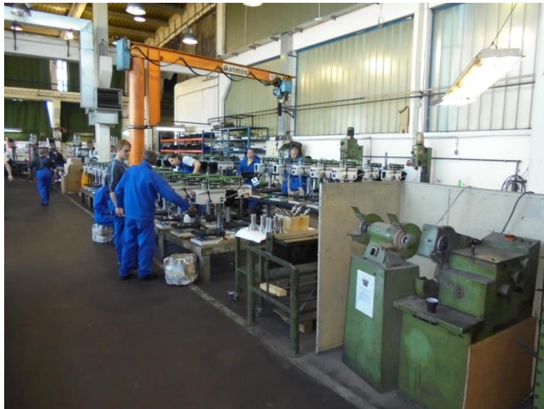
Sl.6: Montaža [1]

Nakon preuzimanja proizvoda (pribora ili strojeva) poslovođa montaže popunjava Predatnicu za skladište gotovih proizvoda (SGP).