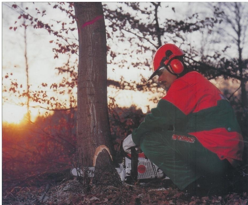
Sl. 5. Rušenje stabla[5]

Nakon obaranja stabla pristupa se kresanju grana koje treba kresati od donjeg dijela stabla prema vrhu i to sa suprotne strane debla od mjesta stajanja radnika kako bi izbjegao udar sjekire i ozljede nogu. Trupljenje debla smije započeti tek kada se deblo postavi na čvrsto i stabilno tlo. Pri pomicanju debla se mora koristiti i pomoćni alat kao što je okretaljka, capin, poluga i slično. Također valja voditi računa o tome da ne dođe do pada trupca na noge radnika koji obavlja trupljenje. Rukovanje drvnim materijalom je opasan posao i radnik se treba pridržavati određenih uputa i upozorenja za rad na siguran način.(Sl.5)