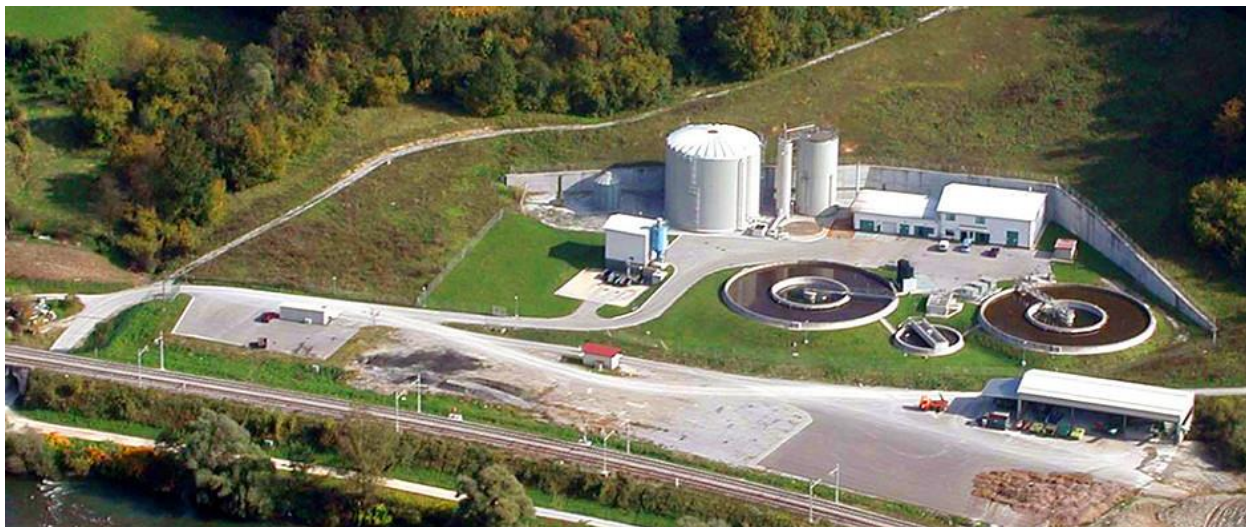
Slika8. Mehaničko-kemijsko-biološki urežaj