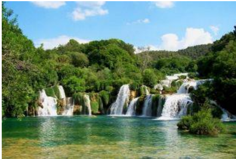
Slika12. Zastita voda uključuje načelo održivog razvitka i jedinstvo vodnog sustava

Zaštita voda uključuje načelo održivog razvitka i jedinstvo vodnog sustava radi osiguranja odgovarajućeg vodnog režima (količina i kakvoća voda), koji se temelji na odredbama Zakona o vodama , Državnog plana za zaštitu voda , propia iz područja zaštite voda od onečišćenja, te uvažavanju i drugih dokumenata, kao što su : Zakon o zaštiti prirode , Zakon o zaštiti okoliša , Nacionalna strategija zaštite okoliša i Nacionalni plan djelovanja na okoliš , Zakon o komunalnom gospodarstvu . U zaštiti voda važno je respektirati i međunarodne uvjete koje je Republika Hrvatska potpisala i potvrdila u postupcima ratifikacije, a odnose se na provedbu mjera i izgradnju vodnih građevina za zaštitu voda.