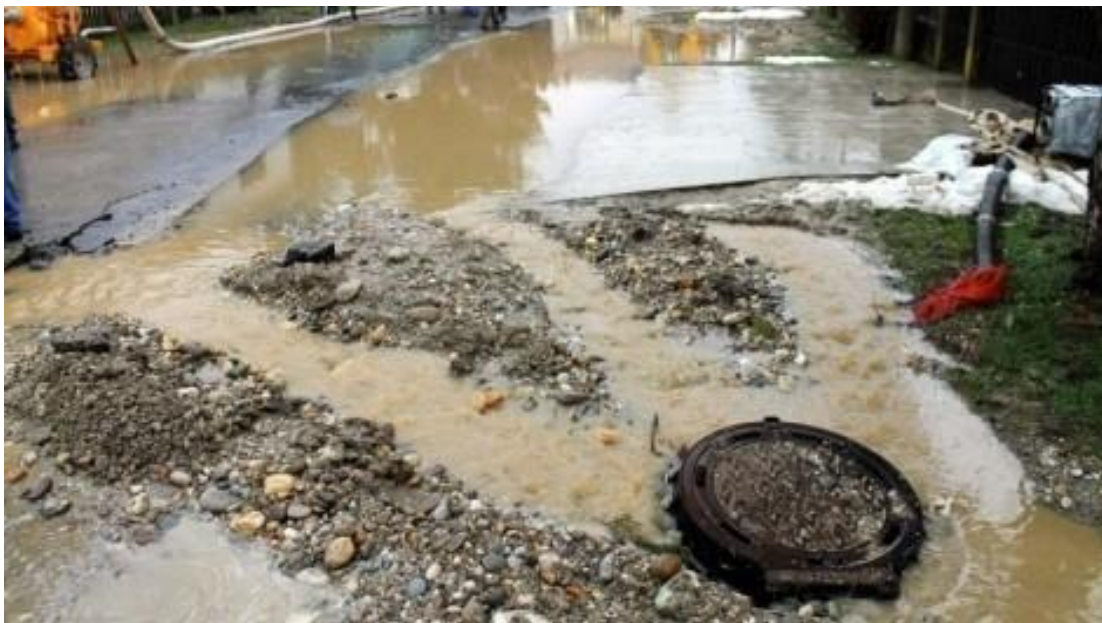
Slika4. Prikaz oborinskih otpadnih voda

Ove vode formiraju se kao površinski oticaj od padalina ili topljenog snijega sa urbanog područja. U ove vode se ubrajaju i otpadne vode od pranja uličnih površina, trotoara, kolnika... Količina i kvaliteta ovih otpadnih voda zavisi o inteziteta i učestalosti padalina, od načina održavanja javne higijene, od broja i intezititeta motornog prometa, vrste površinske obrade terena i prometnih površina, zagađenja atmosfere, klimatskih uvjeta... Po ukupnoj bakteriološkoj zagađenosti, oborinske otpadne vode su slične sanitarnim. Međutim, oborinske otpadne vode sa industrijskih površina nose značajne količine bakra, olova, arsena, sa asfaltnih površina naftne produkte što dodatno ugrožava sanitarne čvorove. Nažalost, praksa je da se ove vode ne pročišćavaju, jer se smatraju čistima, što nekad nije tako upravo iz navedenih razvoja.