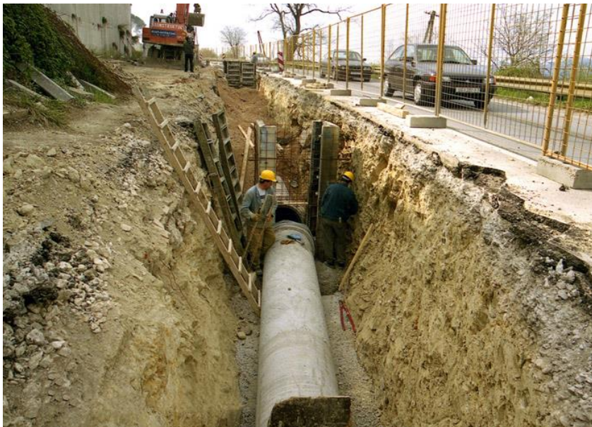
Slika5. Slika kanalizacijskog sustava

Kanalizacijski sustav odvodi otpadne tvari, ali i energiju (toplinu). Njima se odvođe kućanske (sanitarne) vode, industrijske otpadne vode i poljoprivredne vode.