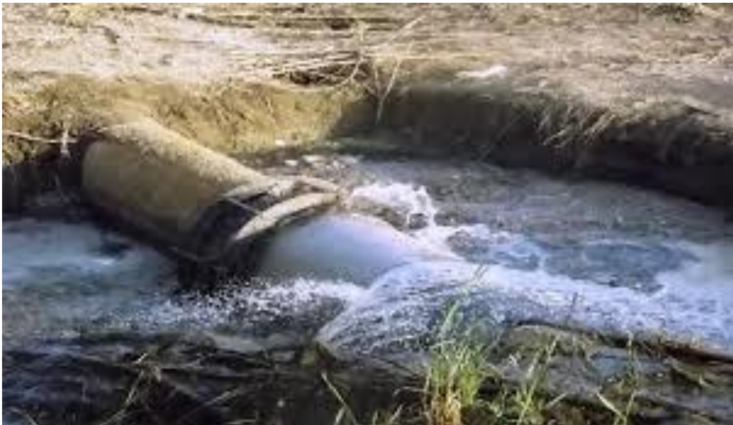
Slika 1. Prikaz neadekvatnih objekata za odvodnju otpadnih voda

Nažalost se i danas još otpadne vode često ispuštaju bez pročišćavanja u prirodne recipijente kao što je prikazano na slici 1.