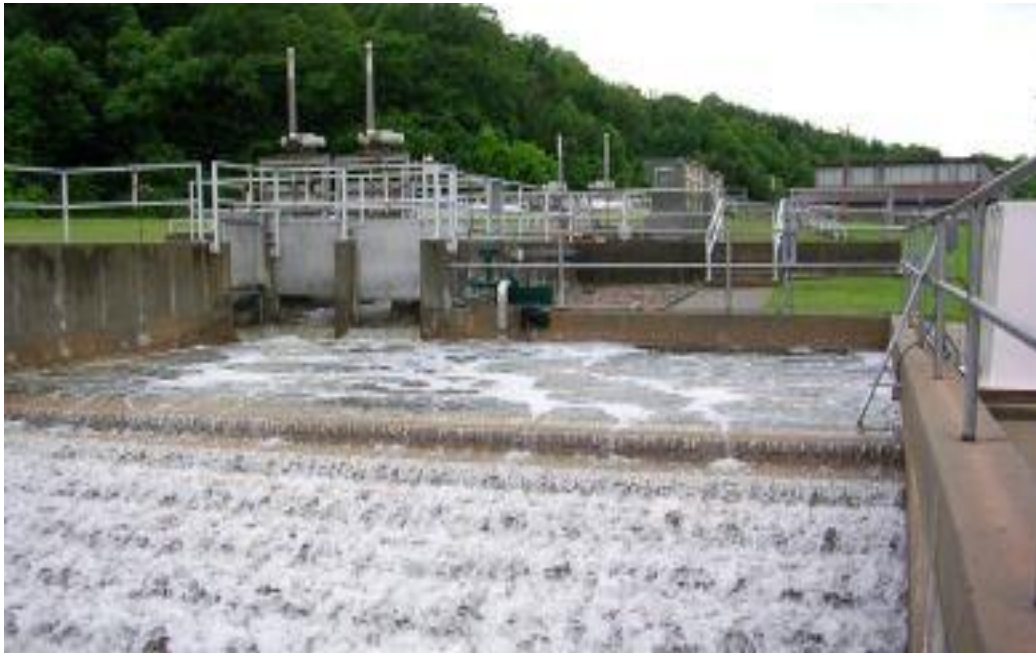
Slika 11. Prikaz pročiščavanja odpadnih voda