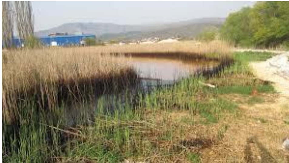
Slika3. Prikaz poljoprivrednih otpadnih voda

Sastav poljoprivrednih otpadnih voda ovisi o primjenjenoj tehnologiji obogaćivanja zemljišta gnojivom, hranjivim tvarima, primjenjenim herbicidima, biocidima, fungicidima i poljoprivrednim kulturama koje se pretežno na određenim područjima uzgajaju.