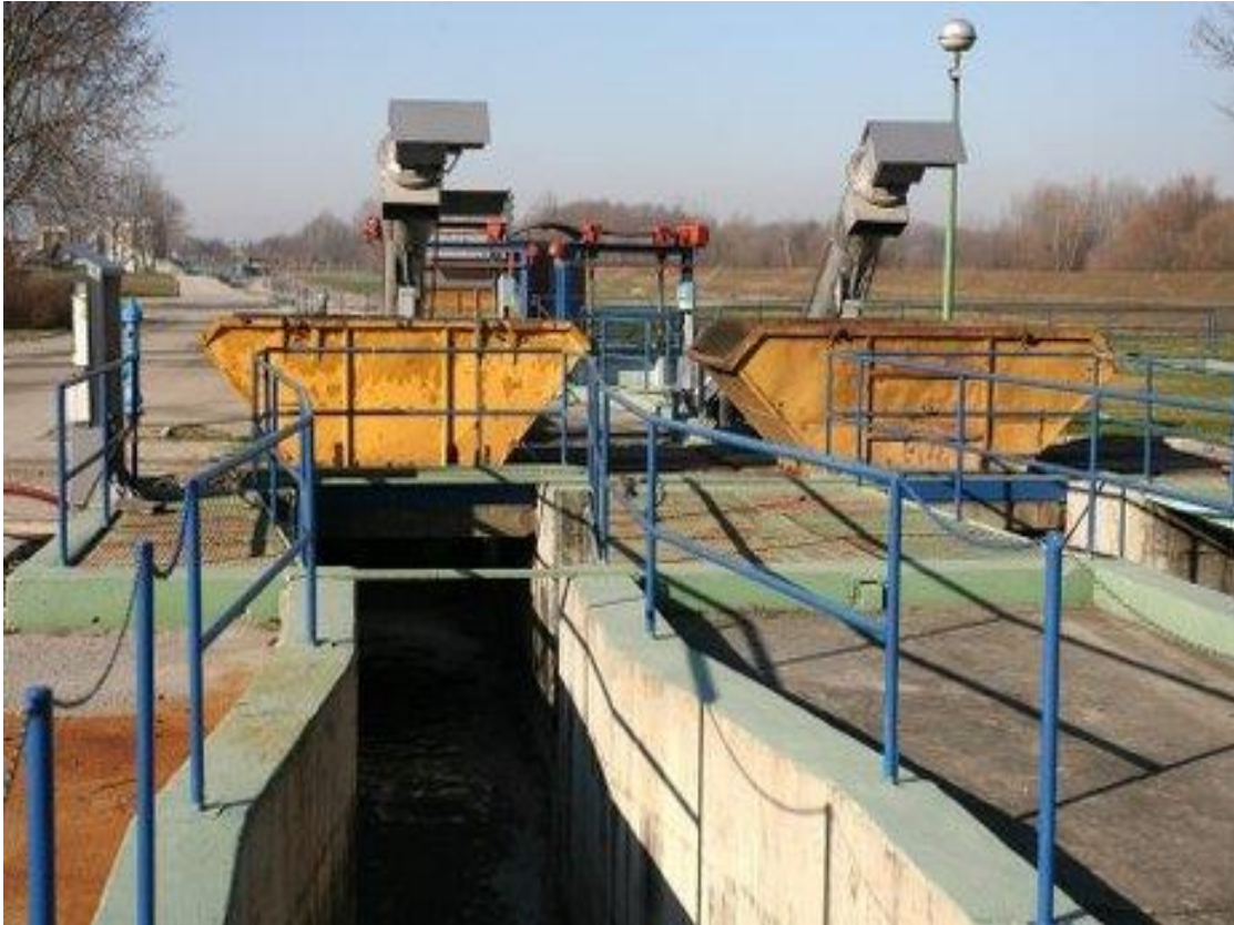
Slika10. Prikaz kanalizacijskog sustava

Javni kanalizacijski sustav sakuplja i provodi otpadnu vodu kućanstava, oborinsku vodu (koja ispire i nosi onečišćenja sa prometnih i okolnih poljoprivrednih površina) kao i obrađenu i neobrađenu industrijsku otpadnu vodu. Sakupljena otpadna voda se nakon pročišćavanja ili nepročišćena, ispušta u rijeku ili more uz obalu.