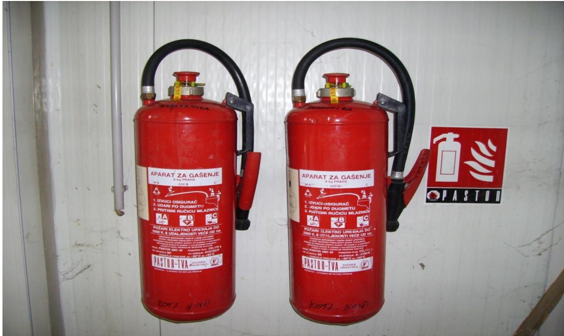
Slika 16. Vatrogasni aparat S 9 [izrada autora]