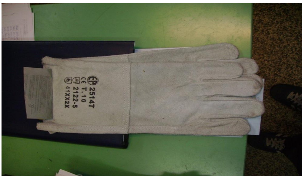
Slika 13. Zaštitne kožne rukavice [izrada autora]

Za zaštitu tijela zaposlenicima se na korištenje daje: