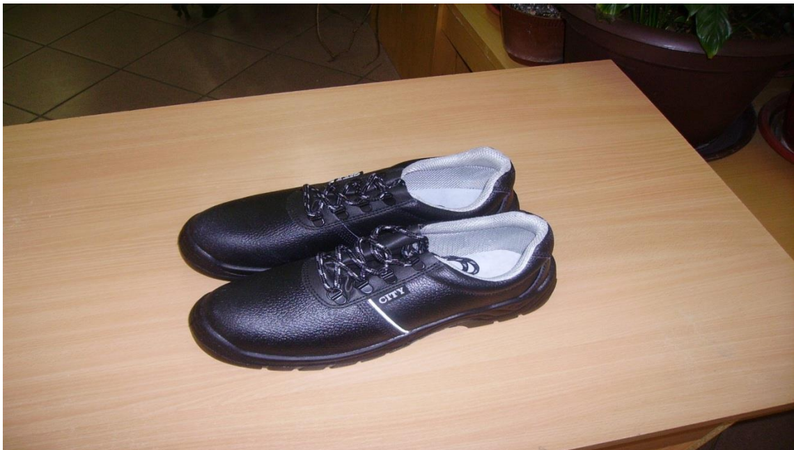
Slika 14. Zaštitne kožne niske cipele [izrada autora]