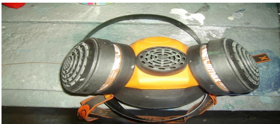
Slika 12. Maska s filterima [izrada autora]