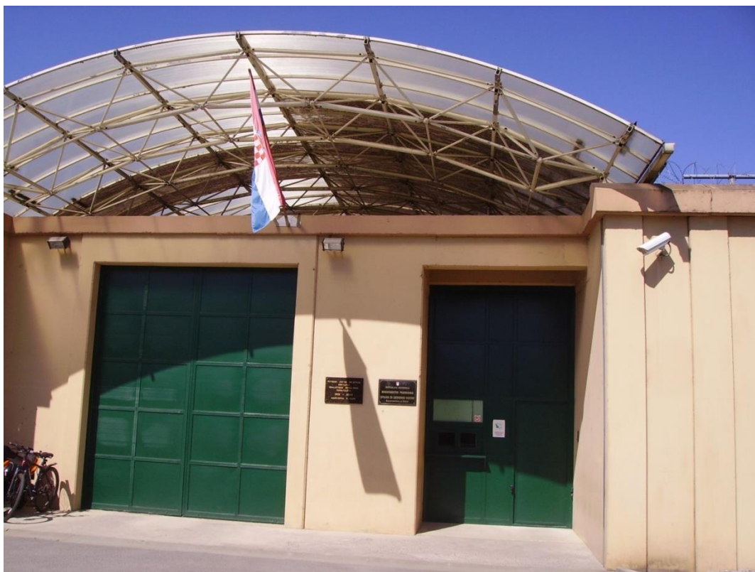
Slika1. Ulaz u Kaznionicu [izrada autora]

Kaznionica u Glini osnovana je u rujnu 1995 . godine na prostorima nekadašnjeg Doma za preodgoj maloljetnika u Glini (slika 1.). U okviru Doma djelovala je gospodarska jedinica pod imenom „Budućnost“ privredni pogoni Glina. U svom sastavu imala je metalski pogon, štampariju, građevinsko zanatski pogon, ekonomiju i auto servis sa stanicom za tehnički pregled vozila. Početkom rata došlo je do izmještanja Doma za preodgoj maloljetnika, najprije u Sisak, a kasnije u Turopolje, a privredni pogoni su prestali s radom.