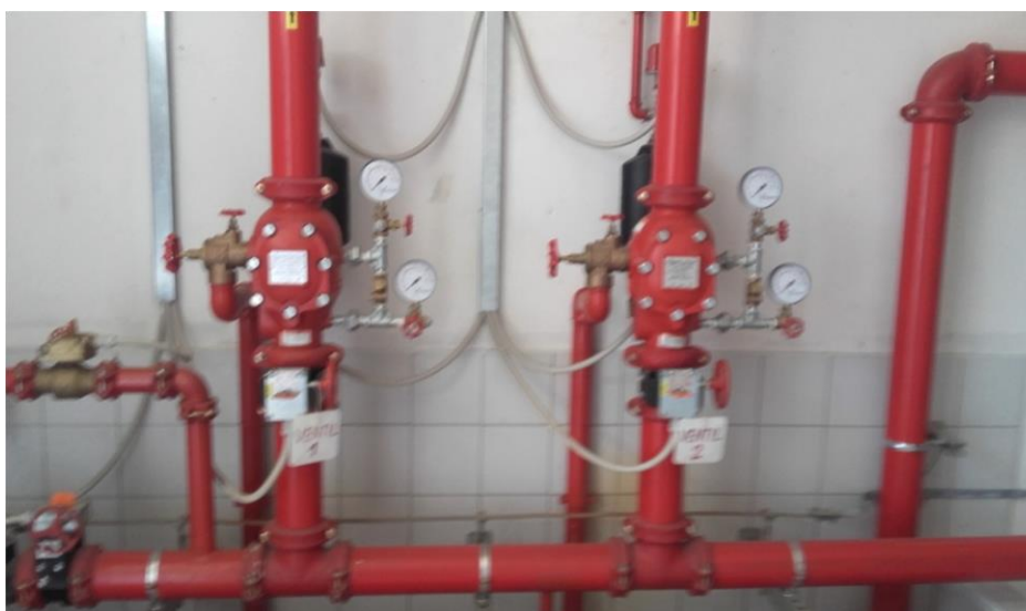
Slika 22. Slinkler instalacija

U novom objektu instalirana je slinkler instalacija (slika 22.) , prema pravilima zaštite na radu, te izdana uputstva za rukovanje od strane investitora i izvođača.