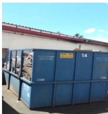
Slika 23. Spremnik s otpadnim papirom [izrada autora]