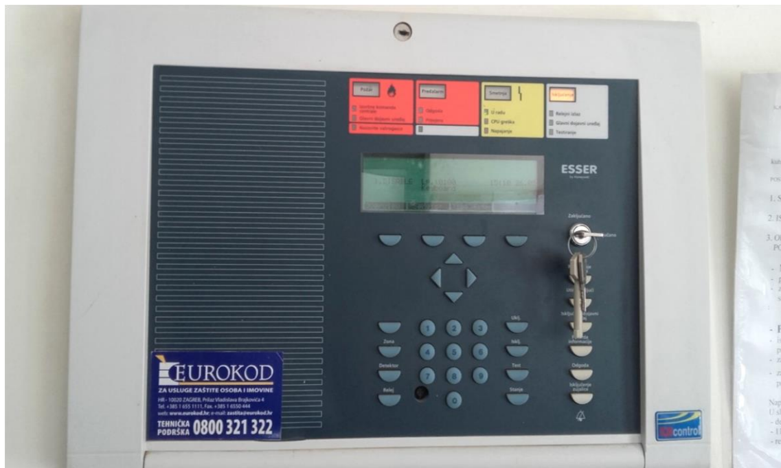
Slika 21. Vatrodojava