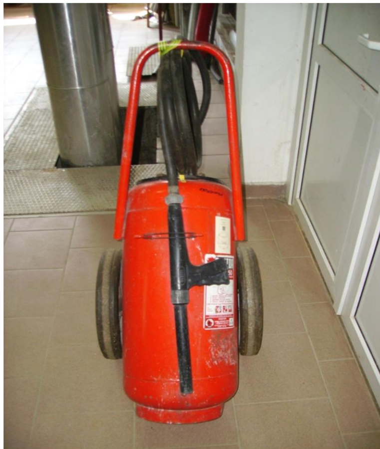
Slika 17. Vatrogasni aparat S 50 [izrada autora]