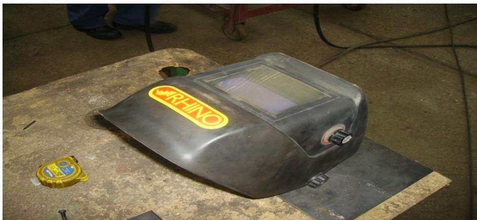
Slika 11. Štitnik za oči i lice s tamnim staklom [izrada autora]

Osim navedenih koriste se i druga sredstva za zaštitu očiju i lica kao što su zaštitne naočale s nepropusnim okvirom, zaštitne naočale s kobaltnim staklom, zaštitne naočale ili štitnici od žičanog pletiva itd.