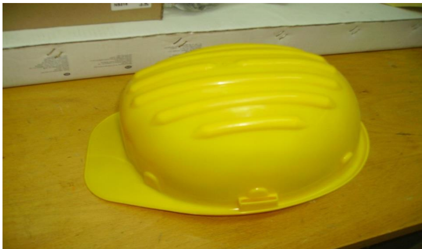
Slika 10. Zaštitna kaciga [izrada autora]

Za zaštitu očiju i lica zaposlenicima se daje na korištenje: