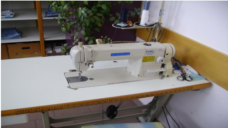
Slika 4. Šivaća mašina [izrada autora]