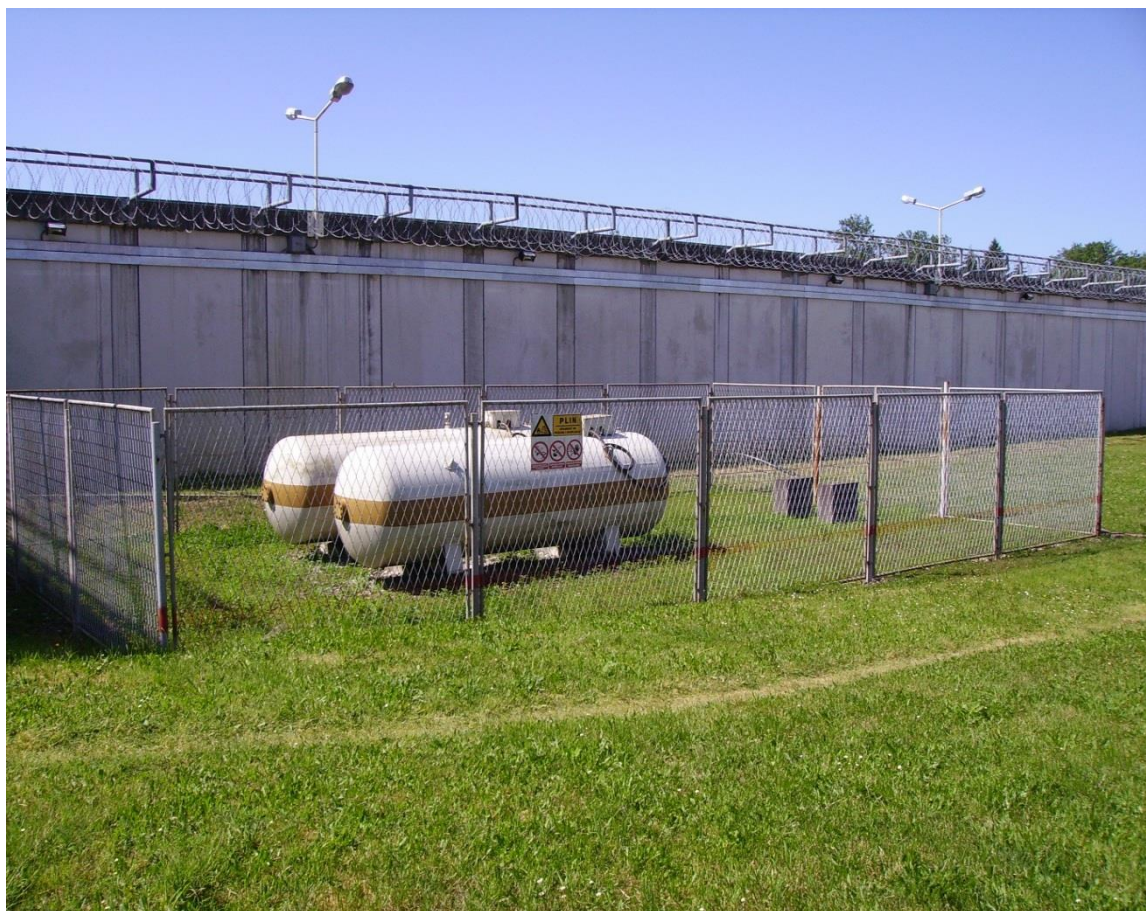
Slika 20. Spremnici UNP-a [izrada autora]

prostor ograđen žičanom ogradom. Udaljenost spremnika od građevine iznosi 16 metara, te su uzemljeni (slika 20).