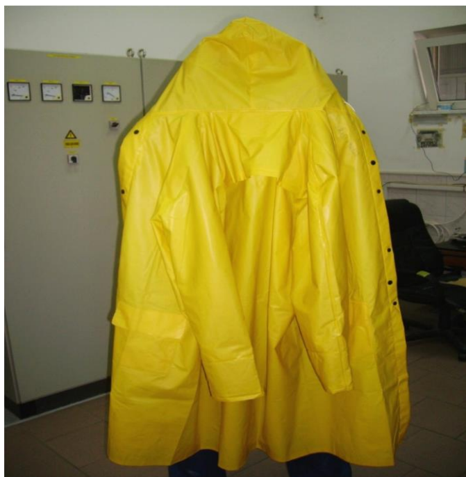
Slika 15. Kišna kabanica [izrada autora]

Za zaštitu od padova s visine ili u dubinu na radnim mjestima koja se zbog prirode posla ne mogu ograditi ili na drugi pogodan način zaštititi zaposlenicima se na korištenje daje zaštitni opasač opremljen zaštitnim prihvatnim užetom za privezivanje, a po potrebi i dopunskim užetom ovisno o procjeni opasnosti.