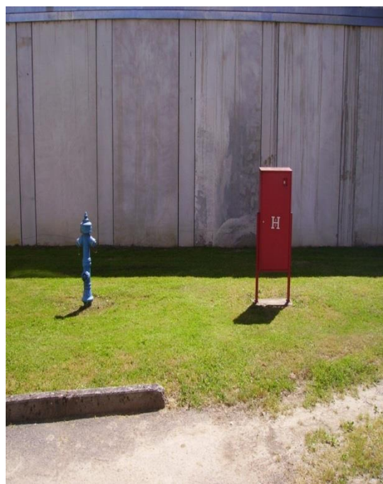
Slika 19. Vanjski hidrantski ormarić