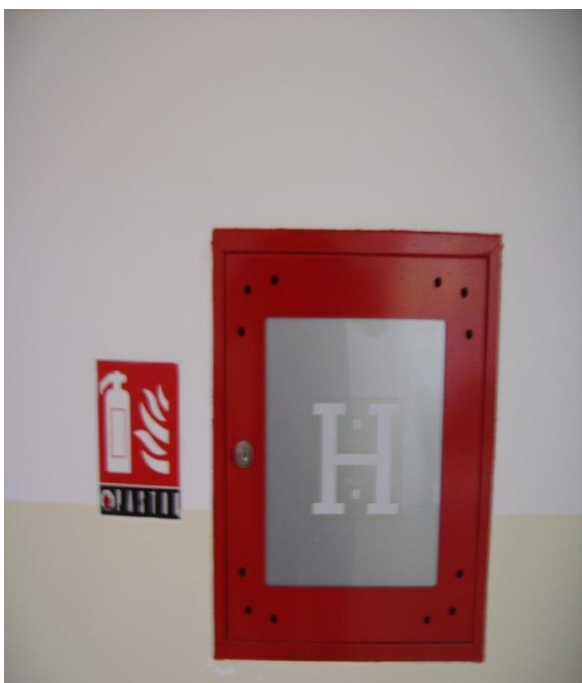
Slika 18. Unutarnji hidrantski ormarić [izrada autora]

Unutarnji (slika 18.) i vanjski hidrantski ormarići (slika 19.) raspoređeni su tako da omogućuju gašenje svih objekata. Najmanji tlak vode na mlaznici je 2.5 bara uz protok od 5 litra u sekundi za istovremeni rad dva hidranta. Svi hidrantski ormarići su vidno obilježeni s opremom: crijevo duljine 15 metara sa spojnicama i univerzalnom mlaznicom. Opskrba vodom je iz vodovoda preko vodovodnog okna iz javne vodovodne mreže. Ispitivanje se obavlja jednom u godini, a izvodi ga vanjska ovlaštena firma.