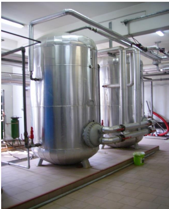
Slika 7. Kotlovnica [izrada autora]

Rukovanje kotlovnicom (slika 7.) obavljaju dva kotlovničara koji su stručno osposobljeni za isto. Grijanje prostorija kao i dobivanje tople vode (slika 8.) potrebne za funkcioniranje Kaznionice dobiva se iz obnovljivih izvora energije, odnosno toplovodom iz Drvnog centra Glina.