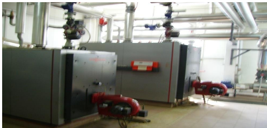
Slika 9. Peć na loživo ulje [izrada autora]

U slučaju nedovoljne potrebne količine energije Kaznionica ima kao rezervnu opciju dobivanje toplovođne energije putem peći na loživo ulje (slika 9.).