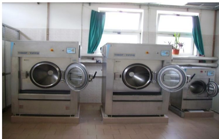
Slika 5. Mašine za pranje [izrada autora]