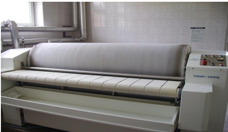
Slika 6. Valjak za peglanje [izrada autora]

Poslovi elektro održavanja obuhvaćaju održavanje i popravljanje električne opreme na strojevima i uređajima , gromobranskih instalacija, kao i sustava video nadzora, te rasvjete same Kaznionice. Svi poslovi se obavljaju na licu mjesta.