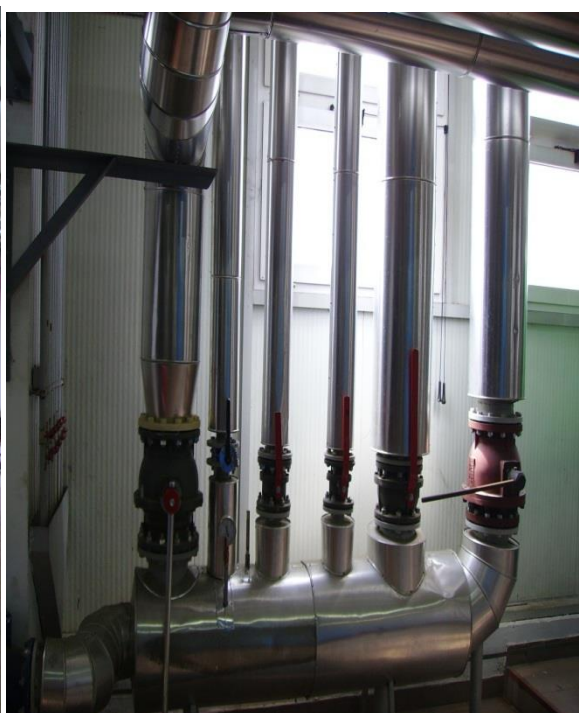
Slika 8. Kotlovnica – grijanje vode [izrada autora]

U slučaju nedovoljne potrebne količine energije Kaznionica ima kao rezervnu opciju dobivanje toplovođne energije putem peći na loživo ulje (slika 9.).