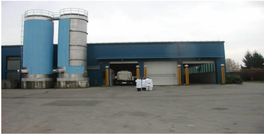
Slika 12. Skladište opasnih tvari