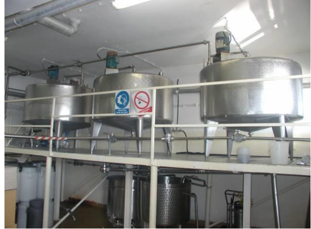
Slika 10. Linija fermentiranih proizvoda