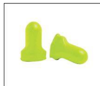
Slika 6. Čepići za uši

Vrste zaštitnih čepova formirani su i neformirani. Formirani se proizvode od čvrstog materijala, glatke površine s nastavkom za prihvat prstima kod stavljanja i vađenja u uho. Neformirani se proizvode od plastičnog materijala uz oblikovanje samog radnika koji ga koristi pri radu.