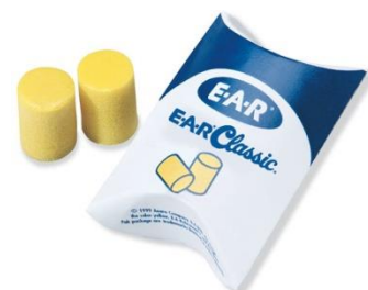
Slika 4. Zaštitne vate

Način uporabe: zaštitna vata pakirana je u određene kutije, iz koje se za jedno uho izvuče do 4 cm, otkine taj