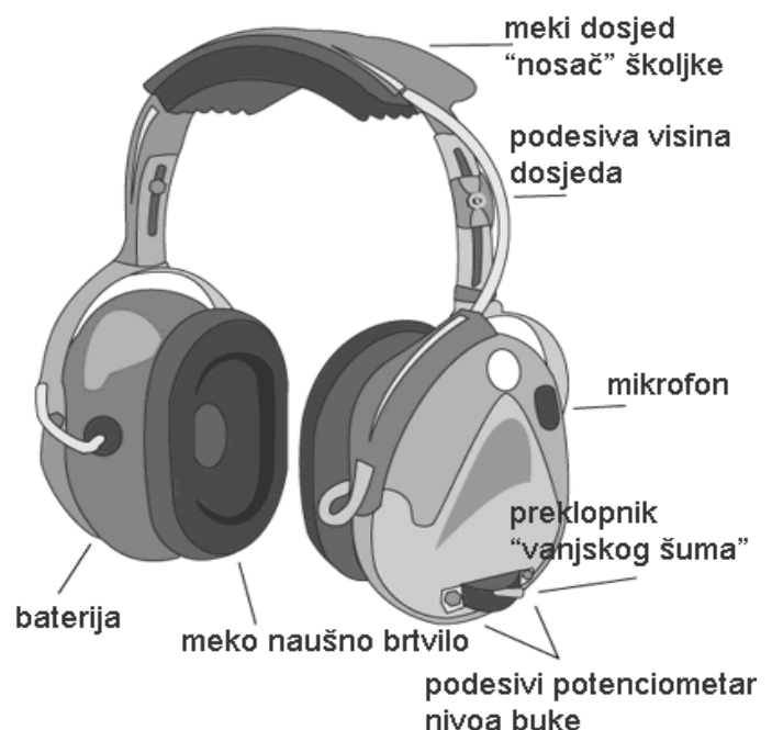
Slika 8. Ušni štitnici

Tijelo štitnika izrađuje se od materijala koji loše provodi buku, koji je teško zapaljiv, koji ne nadražuje kožu te nije štetan po zdravlje i ne pušta boju. Jastuci štitnika su od mekanog materijala koji ne propušta buku. Štitnici se moraju čuvati na suhom mjestu, sobne temperature i vlage. Pakiranje mora biti takvo da ne može doći do oštećenja prilikom transporta.