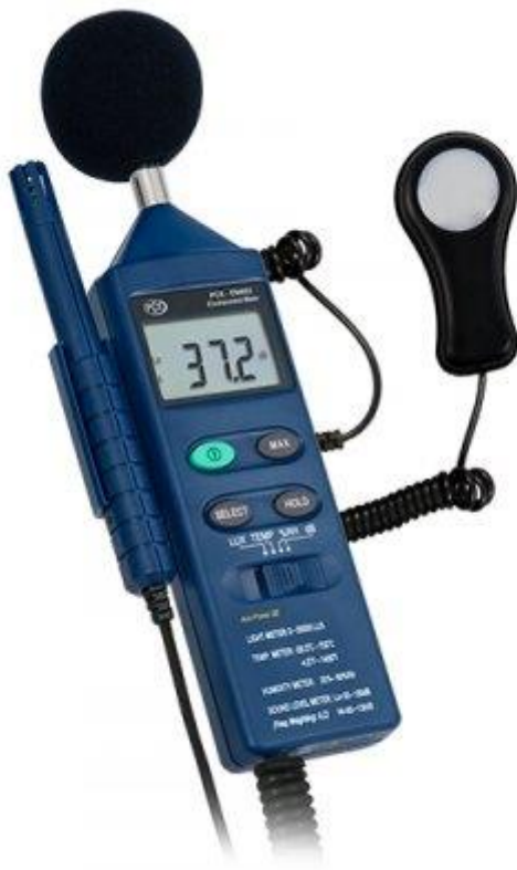
Slika 3. Zvukomjer

Primljenu je energiju lako odrediti za konstantnu razinu zvuka. Ako je razina zvuka promjenjiva, mjerenje se mora ponavljati tijekom određenog razdoblja uzorkovanja. Na temelju tih uzorkovanja moguće je izračunati vrijednost poznatu kao ekvivalentna neprekidna razina zvuka ( L_{eq} ) koja ima isti sadržaj energije i isto potencijalno oštećenje sluha kao promjenjiva razina zvuka. Ako su promjene razine zvuka slučajne, nije lako izračunati L_{eq} . U ovakvim slučajevima upotrebljavaju se integrirajući zvukomjeri koji automatski računaju L_{eq} . [2.]