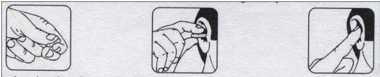
Slika 5. Način stavljanja zaštitne vate u uho

Pamučna vata koja služi za opću potrošnju ne smatra se zaštitnom vatom. Pri formiranju čepa vate i pri stavljanju čepa u uho, obavezno ruke moraju biti čiste. Veličina čepa vate mora odgovarati veličini šupljine uha jer o adekvatnoj veličini čepa vate ovisi količina prigušivanja buke. Svaki se čep vate u pravilu upotrebljava samo jedanput.[1.]