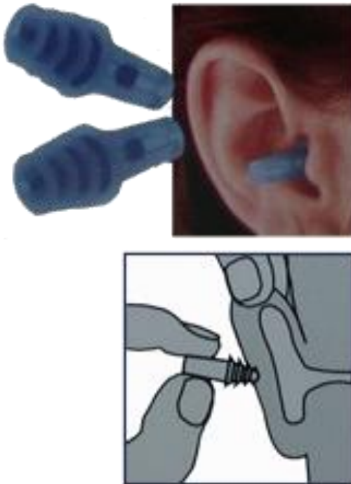
Slika 7. Način stavljanja čepića u uši