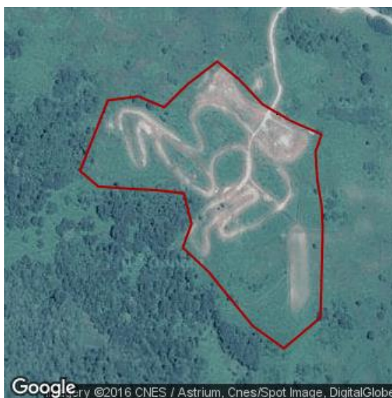
Slika 3: Motocross staza Grabarje