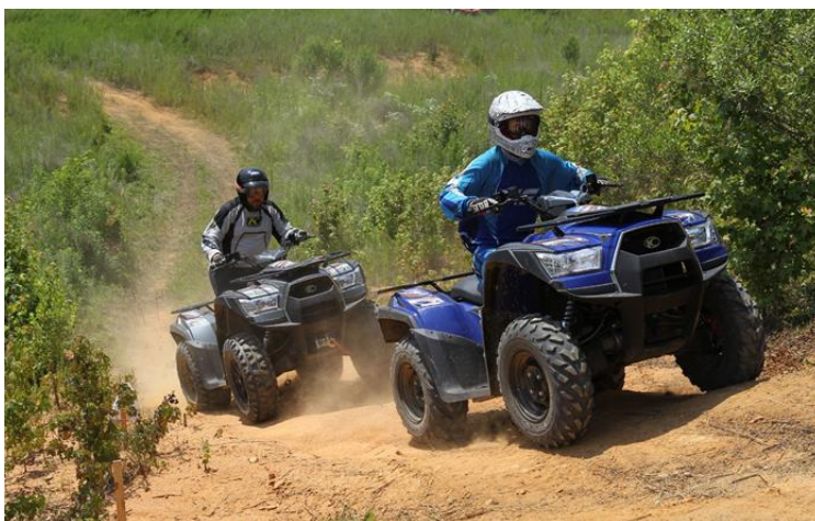
Slika 4: Quad avantura