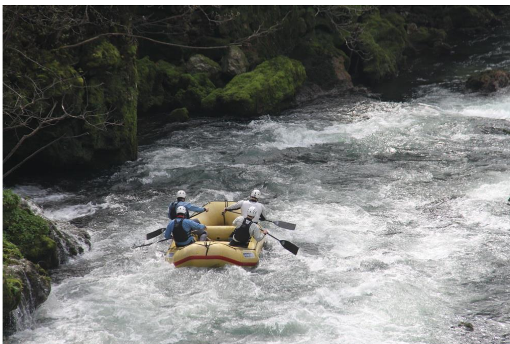
Slika 2. Rafting u Slunju