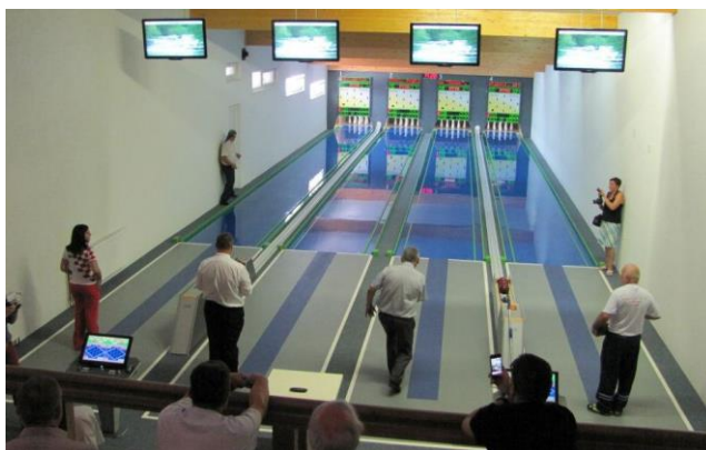
Slika 1: Kuglana u Slunju