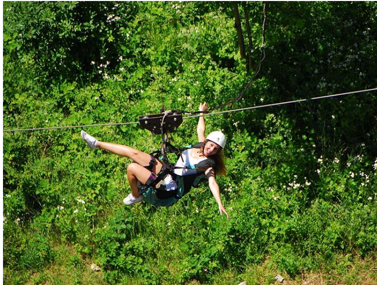
Slika 8: Zipline Korana