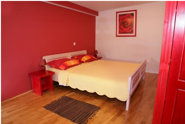
Slika 4. Soba „Ružica“ u ugostiteljskom objektu „Pastuh Pub“

Izvor: Turistička zajednica Grada Jastrebarskog http://www.tzgj.hr/hr/gdje_odsjesti/privatni_smjestaj/2-pastuh_pub.html (27.03.2016.)