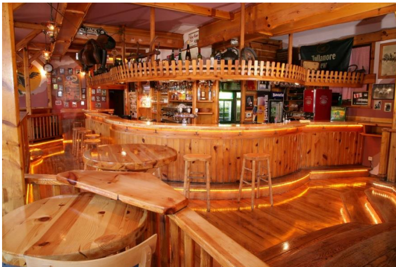
Slika 2. Uređenje interijera pivnice