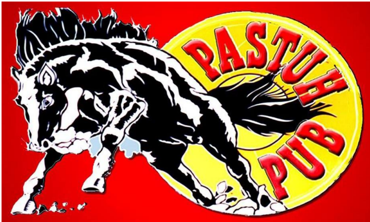
Slika 1. Logotip ugostiteljskog objekta „Pastuh Pub“