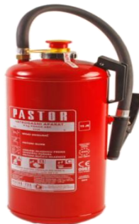
Slika 2. Aparat za početno gašenje požara

Glavni voditelj gradilišta ili po voditelju ovlaštena osoba dužna je odmah obavijestiti policijsku upravu o svakom požaru koji je nastao na radilištu. Voditelj radilišta dužan je provesti mjere za zaštitu od požara koje rješenjem naredi inspektor za zaštitu od požara, odnosno policijska uprava.