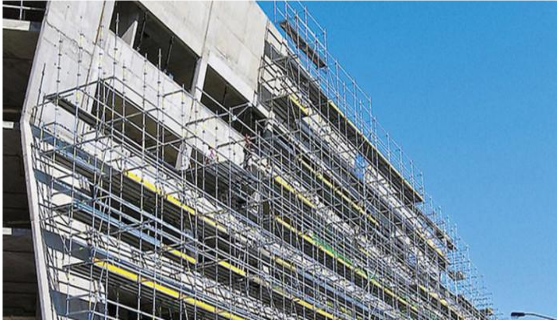
Slika 3. Skele za fasade

i sa unutrašnje strane potrebno postaviti propisanu zaštitnu ogradu. Skela se mora učvršćivati za objekt svakih 6 m u horizontalnom i vertikalnom smjeru. 13