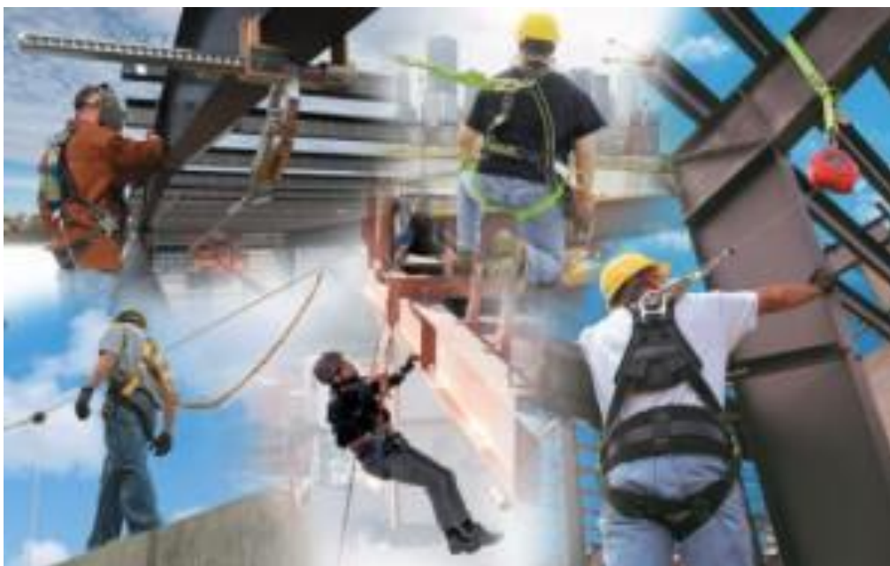
Slika 4. Zaštitni pojas

Također, prilikom podizanja oplata kranskom dizalicom, signalist odnosno vezač tereta mora posebnu pažnju obratiti na način na koji će zakvačiti oplatu. Prilikom podizanja tereta nosivo uža mora biti vortikalno u odnosu na radni pod s kojeg se teret podiže da prilikom podizanja tereta nebi došlo do nekontroliranog ljuljanja tereta te samim time može ugroziti vezača tereta te osobe koje se nalaze u blizini.