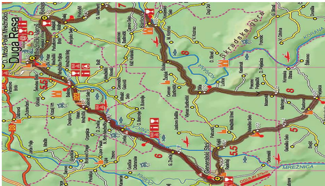
Slika 6. Biciklistička ruta Duga Resa