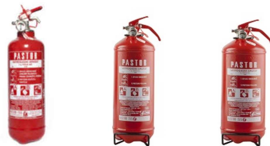
Slika 7: Vatrogasni aparati pod stalnim pritiskom tvrtke „PASTOR“: P1A, P2A i P3A