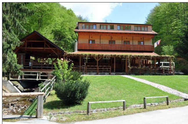
Slika 1. Lovački dom Muljava