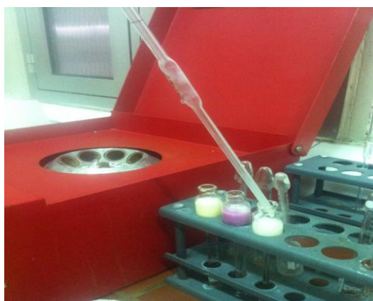
Slika 7. Određivanje udjela masti u sladolednoj smjesi metodom po Gerberu (Ledo d.d., 2016)

Metoda se zasniva na kemijskom otapanju zaštitne opne globule mliječne masti sumpornom kiselinom. Radi lakšeg odvajanja masti dodaje se amilni alkohol koji snižava površinsku napetost sladoledne smjese. Mast se odvoji centrifugiranjem i količina se očitava naskali butirometar. U butirometar se otpipetira 10 ml 90%-tne sumporne kiseline, 5 ml sladoledne smjese, 5 ml amilnog alkohola, te se začepi čepom. Sadržaj se promućka, te se butirometar stavlja u centrifugu na 4 minute. Nakon obavljene centrifuge, očitava se količina mliječne masti u sladolednoj smjesi.