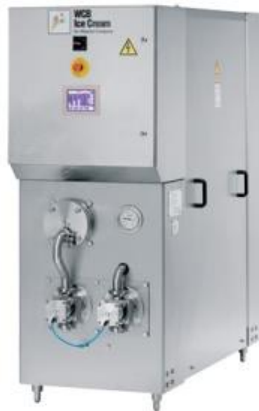
Slika 4 . Kontinuirani sladoledni frizer s automatskom kontrolom (Alfred & Co, 2016)

Sladoledna smjesa koja napušta zamrzivač je viskozna jer sadrži oko 50 % smrznute vode te 90 – 100 % inkorporiranog zraka.