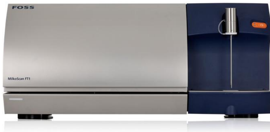
Slika 6. Spektroskopski uređaj za analizu mlijeka i sladoledne smjese MilkoScan FT1 (FOSS , 2016)