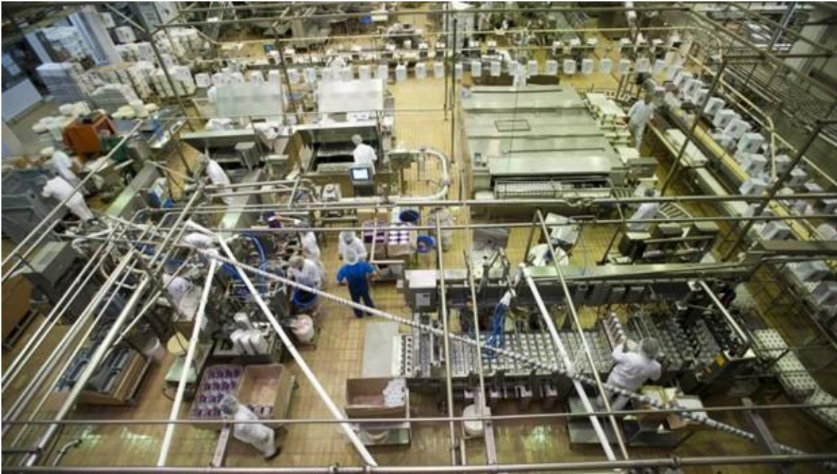
Slika 2. Pogon za proizvodnju sladoleda tvornice Ledo d.d. (Ledo d.d., 2016)