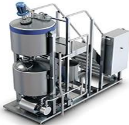
Slika 3. Almix uređaj za miješanje sastojaka sladoledne smjese (Webpackaging, 2015)

Ledo d.d. koristi Almix uređaj za miješanje sladoledne smjese.