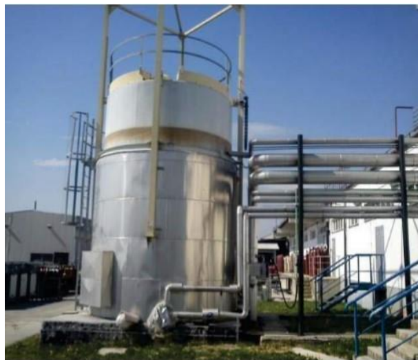
Slika 6 – Gazometar

Upravljanje razvijaaem odvija se preko 5 induktivnih rasklopnih kontakata na zvonu gazometra.