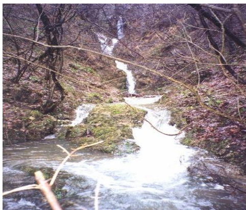
Slika 1 – Crni potok

Na jugoistočnom dijelu značajnog krajobraza Klek nalazi se izvor Mrzljak, a dvjestotinjak metara jugoistočno od njega je izvor Soviljica (TRPČIĆ i sur, 2014.). Površinska hidrografska mreža unutar zapadne granice značajnog krajobraza Klek je slabije razvijena nego što je to slučaj s njegove sjeverne i istočne strane. U tom zapadnom dijelu značajnog krajobraza Klek nalazi se izvor Košarice i tek nekoliko manjih povremenih izvora. Na Karti 3 prikazani su izvori i tokovi na području ZK Klek.