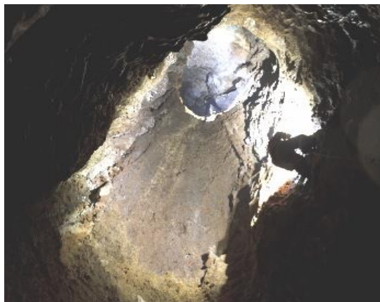
Slika 3 – Vještičja jama na Kleku

Iako se nalazi u neposrednoj blizini planinarskog doma na Kleku, Vještičja jama pronađena je i istražena tek tijekom 2006. i 2007. godine. Istraživali su je članovi HGSS-a stanica Ogulin i SO HPD Željezničar . Jama se nalazi na strmoj kosini oko 100 m jugozapadno od planinarskog doma na Kleku. Formirana je u krednim vapnencima, duž tektonske pukotine generalnog pravca pružanja sjeveroistok-jugozapad, iako se njen otvor (dimenzija 8x6m) proteže duž pukotine pružanja sjeverozapad-jugoistok. Dubina jame je 133,5m. U Vještičjoj jami uglavnom nema vode, no iznimka su nakapnice te manje lokve na dnu jame. Na dubini od 5m nalazi se prirodni most koji dijeli ulaznu vertikalnu na dva kraka. Zapadni se spaja na vertikalnu koja je ukupne dubine -105m, a istočni na glavnu vertikalnu (ŠUICA, 2014.).