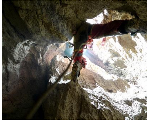
Slika 2 – Jama na Kleku

Jama se nalazi ispod heliodroma u blizini vrha Kleka, oko 20 minuta hoda stazom od planinarskog doma. Ulaz je na 1162m, što ovu jamu čini speleološkim objektom s najvišom nadmorskom visinom ulaza u Karlovačkoj županiji (ŠUICA, 2014.).