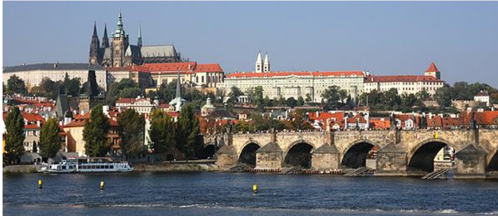
Slika 7. Praški dvorac