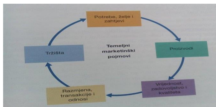
Slika broj 1. Temeljni marketinški pojmovi