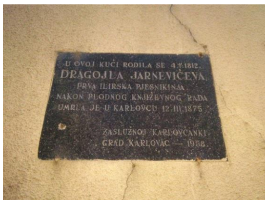
Slika 7: Spomen ploča na kući Dragojle Jarnević

U gradu se nalazi i rodna kuća prve ilirske pjesnikinje Dragojle Jarnević. Na kući stoji i stara spomen ploča iz 1958. godine koja pokazuje da je u njoj rođena i živjela Dragojla Jarnević. Treba postaviti novu spomen ploču koja će biti pisana i stranim jezicima te na taj način i stranim turistima omogućiti da saznaju tko je u toj kući rođen. Rodna kuća Dragojle Jarnević nalazi se na uglu današnjih ulica Ljudevita Gaja i Dragojle Jarnević. U Šimunićevoj ulici na kućnom broju 3 nalazila se sobica u kojoj je preminula Dragojla Jarnević. Na kuću treba postaviti spomen ploču koja će svjedočiti da je Dragojla Jarnević u njoj preminula. Osim kuće u kojoj se Dragojla Jarnević rodila i u kojoj je preminula, u Karlovcu se nalazi i osnovna škola koja je po poznatoj ilirkinji dobila ime Osnovna škola Dragojle Jarnević, a ispred škole se nalazi i bista same Dragojle.