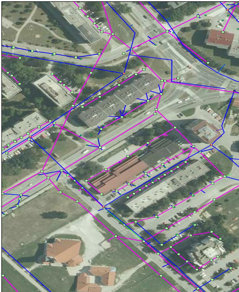
Slika 3. Shema priključaka vodovoda i kanalizacije

(vodovod i kanalizacije d.o.o. Karlovac)