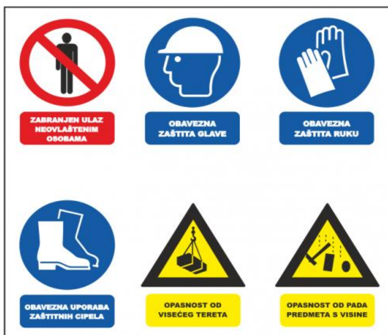
Slika 4. Skupna ploča obveznih znakova za privremena gradilišta