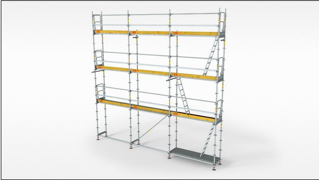
Slika 5. Fasadna cijevna skela

Pravila zaštite na radu se primjenjuju pri: