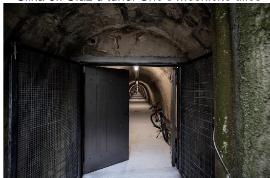
Slika 6.: Ulaz u tunel Grič s Mesničke ulice

Grad Zagreb krije nesvakidašnji biser – ogromni tunel Grič koji spaja nekoliko dijelova grada, a čime je dobio novu turističku atrakciju kojom se rijetko tko može pohvaliti, uključujući mnoge europske prijestolnice. Tunel Grič, koji spaja Mesničku i Radićevu ulicu, obnovljen je i otvoren za javnost. Sagrađen za vrijeme Drugog svjetskog rata kako bi bio sklonište, danas je mjesto na kojem uživaju brojni Zagrepčani, ali i turisti koji su do sada oduševljeni viđenim. Temperatura u tunelu je i do 10 stupnjeva niža nego vani pa je idealno rješenje od bijega pred sparnim ljetnim mjesecima. Unutra je stalno svježije pa se mnogi mogu odmoriti od gradske vreve i stresa, uživajući u glazbi uzduž cijelog tunela. Ima četiri izlaza: na Mesničku, Radićevu, Ilicu i Tomićevu ulicu, a gradit će se i peti izlaz na Gornji grad. Dugačak je 350 metara, širok tri metra, odnosno pet i pol metara na središnjem dijelu. 28