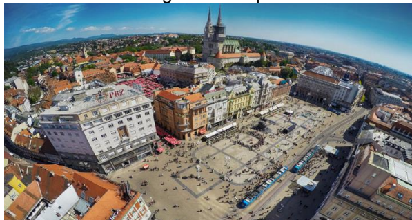
Slika 1.: Trg bana Josipa Jelačića

Zagreb se stoljećima razvijao kao bogato kulturno i snažno trgovačko i gospodarsko središte. Vršeći desetljećima ulogu vodećeg hrvatskog središta, u Zagrebu se turizam razvija dulje od stotinu godina. Duga tradicija u turizmu, cjelogodišnja i veoma raznolika ponuda brojnih sadržaja i događanja, karakterističnih za metropolu, čine bogatstvo turističke ponude Zagreba, koja se oslanja na kvalitetnu smještajnu i raznovrsnu ugostiteljsku ponudu. U receptivnom turizmu Republike Hrvatske Zagreb se svrstava među vodeće turističke destinacije Hrvatske.