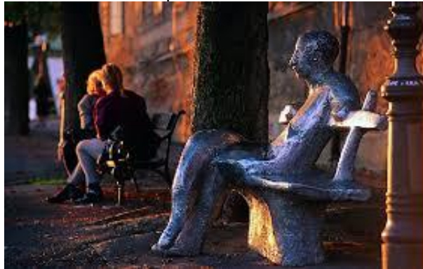
Slika 7.: Spomenik A. G. Matoša

Pod drvoredom kestena šetači u društvu pjesnika A. G. Matoša uživaju u najromantičnijoj panorami Zagreba. Iako nije rođen u Zagrebu, Antun Gustav Matoš (1873. – 1914.), jedan je od najvećih zaljubljenika u grad u kojem je odrastao. Bez dlake na jeziku piše feljtone, putopise, kritike i polemike kojima šokira i oduševljava suvremenike, a njegova lirika jedan je od najvrjednijih opusa hrvatske književnosti. Živio je boemski, najčešće sam, umro je rano i ostao zapamćen kao buntovnik i sanjar. Skulptura, djelo kipara Ivana Kožarića postavljena je na Strossmayerovo šetalište 1978. godine.