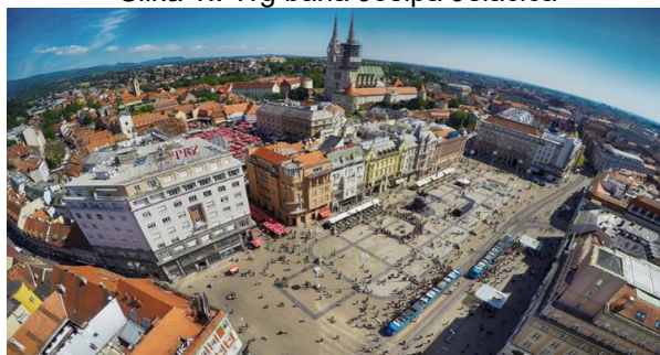
Slika 1.: Trg bana Josipa Jelačića

Zagreb se stoljećima razvijao kao bogato kulturno i snažno trgovačko i gospodarsko središte. Vršeći desetljećima ulogu vodećeg hrvatskog središta, u Zagrebu se turizam razvija dulje od stotinu godina. Duga tradicija u turizmu, cjelogodišnja i veoma raznolika ponuda brojnih sadržaja i događanja, karakterističnih za metropolu, čine bogatstvo turističke ponude Zagreba, koja se oslanja na kvalitetnu smještajnu i raznovrsnu ugostiteljsku ponudu. U receptivnom turizmu Republike Hrvatske Zagreb se svrstava među vodeće turističke destinacije Hrvatske.