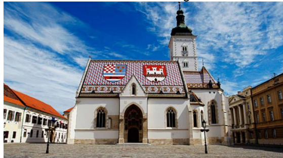
Slika 4.: Crkva svetog Marka

Crkva sv. Marka spada u red najstarijih arhitekturnih spomenika grada Zagreba, jedan je od njegovih simbola, a ujedno je i najstarija župna crkva u gradu. Prvi put spominje se 1256. godine, kroz iduća dva stoljeća dobiva glavne vanjske konture, a obnovljena je u 19. stoljeću, čime se kreira današnji unutrašnji izgled. Jedan od najvrjednijih dijelova crkve raskošni je gotički južni portal iz 14. stoljeća, dok se na sjeverozapadnom zidu nalazi najstariji zagrebački grb iz 1499. godine. Taj figuralno najbogatiji gotički portal u Hrvatskoj izrađen je u Parlerovoj radionici, jednoj od najpoznatijih srednjovjekovnih kiparskih radionica. U 19. stoljeću, prilikom velike crkvene obnove, arhitekt Schmidt je pokrio crkvu sv. Marka čuvenim krovom, koji je ukrašen s dva grba – grbom Trojedne kraljevine Hrvatske, Slavonije i Dalmacije te grbom grada Zagreba, koji je s vremenom postao prepoznatljivim zagrebačkim simbolom. Od 20. stoljeća unutrašnjost krasi djela svjetski poznatog kipara Ivana Meštrovića. 18 Toranj Markove crkve nastradao je u požaru 1706., pa ga je trebalo ponovno popravljati, odnosno nanovo graditi. Kako nije bilo dovoljno novca, popravljalo se vrlo sporo i uz velike prekide te su dovršeni tek 1725. godine. Te, zacijelo, prilično velike radove obavio je spomenuti talijanski graditelj Machedo. 19