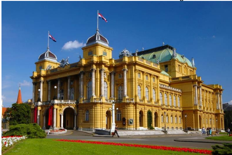
Slika 3.: Hrvatsko narodno kazalište u Zagrebu