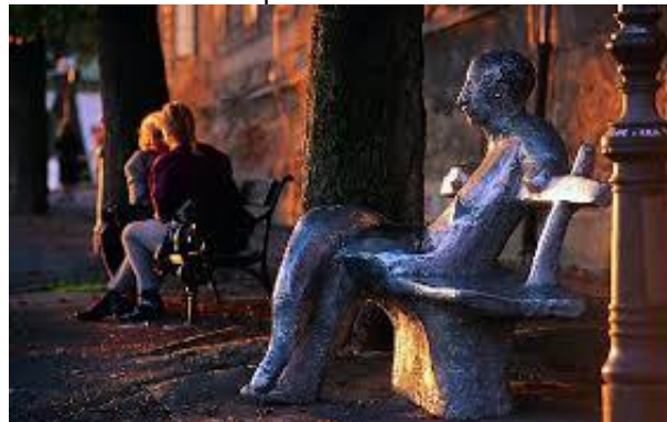
Slika 7.: Spomenik A. G. Matoša

Pod drvoredom kestena šetači u društvu pjesnika A. G. Matoša uživaju u najromantičnijoj panorami Zagreba. Iako nije rođen u Zagrebu, Antun Gustav Matoš (1873. – 1914.), jedan je od najvećih zaljubljenika u grad u kojem je odrastao. Bez dlake na jeziku piše feljtone, putopise, kritike i polemike kojima šokira i oduševljava suvremenike, a njegova lirika jedan je od najvrjednijih opusa hrvatske književnosti. Živio je boemski, najčešće sam, umro je rano i ostao zapamćen kao buntovnik i sanjar. Skulptura, djelo kipara Ivana Kožarića postavljena je na Strossmayerovo šetalište 1978. godine.