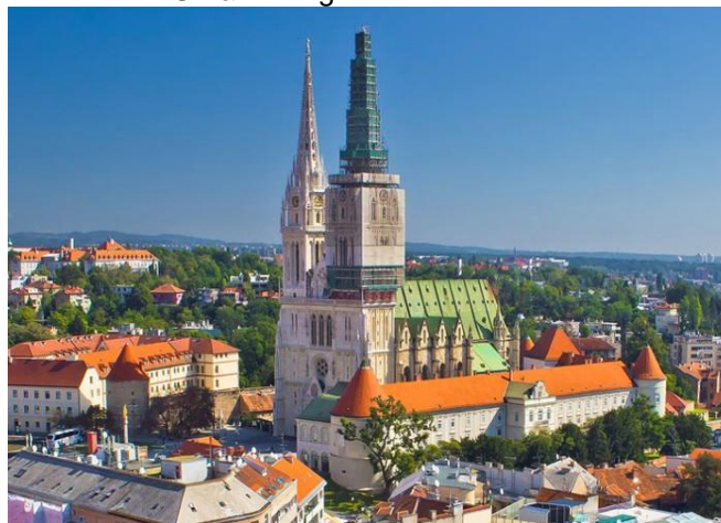
Slika 2.: Zagrebačka katedrala