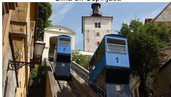
Slika 5.: Uspinjača

Zagrebačka uspinjača je uspinjača koja spaja Gornji i Donji grad. Donja postaja nalazi se u Tomičevoj ulici, a gornja postaja na Strossmayerovom šetalištu, podno kule Lotrščak. S prugom dugom 66 metara, poznata je i kao najkraća žična željeznica na svijetu namijenjena javnom prometu. S trajnim radom započela je 1893. godine, isprva na parni pogon, a kasnije na električni.