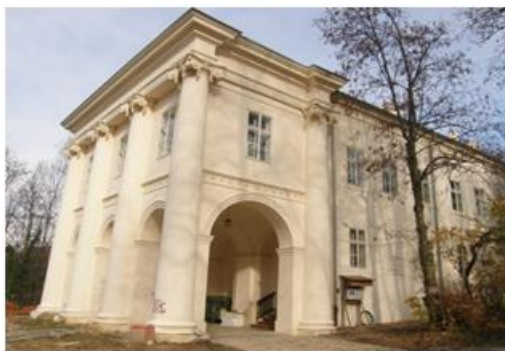
Slika 6: Palača Magdalenić-Drašković-Jelačić

Palača Magdalenić-Drašković-Jelačić izgrađena je 1754. godine prema projektu Matije Leonharta, za Baltazara Magdalenića. Oko 1830. godine palači je s južne strane prigraden klasicistički portal. Palača Magdalenić-Drašković-Jelačić sa stambenom zgradom svojom slojevitošću objedinjuje izgradnju nekoliko epoha, povezujući ih u skladnu cjelinu. 26 Smještena je na rubu zagrebačkog Gradeca na mjestu dodira sa srednjovjekovnim zidinama i kulama.