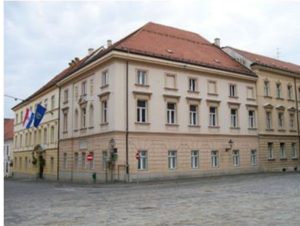
Slika 10: Stara gradska vijećnica