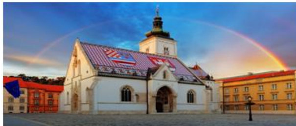
Slika 2: Crkva svetog Marka