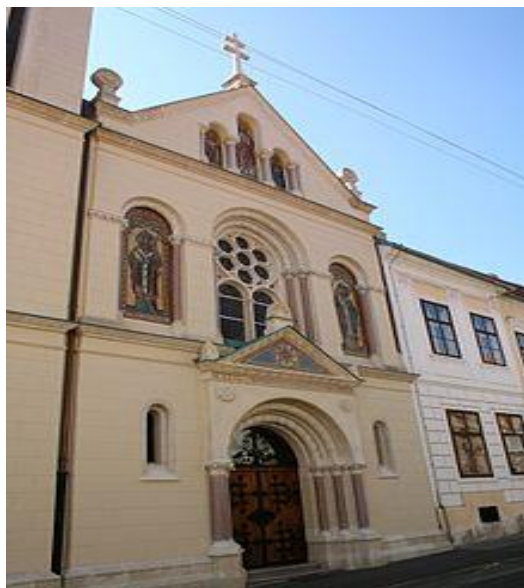
Slika 13: Grkokatolička crkva sv. Ćirila i Metoda