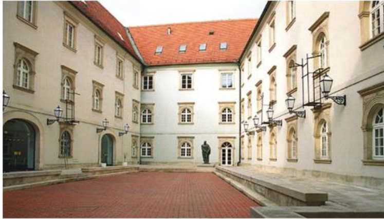
Slika 7: Klovićevi dvori