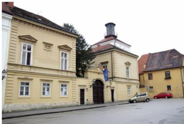
Slika 8: Palača Dverce