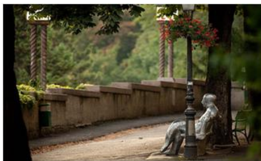
Slika 15: Strossmayerovo šetalište