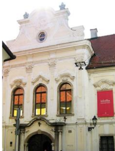
Slika 9: Palača Vojković-Oršić-Rauch