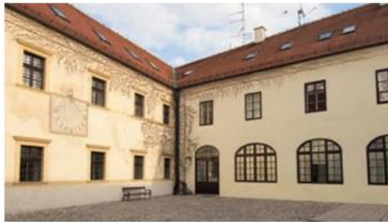
Slika 18: Muzej grada Zagreba