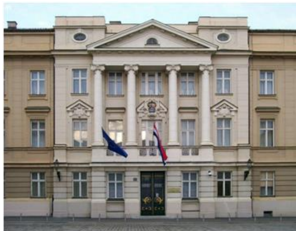
Slika 12: Palača Hrvatskog Sabora