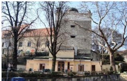
Slika 14: Popov toranj