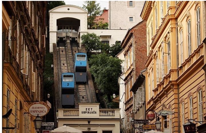
Slika 15: Zagrebačka uspinjača