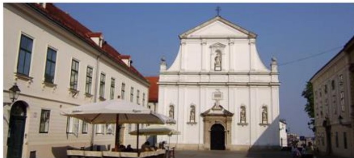
Slika 5: Crkva svete Katarine