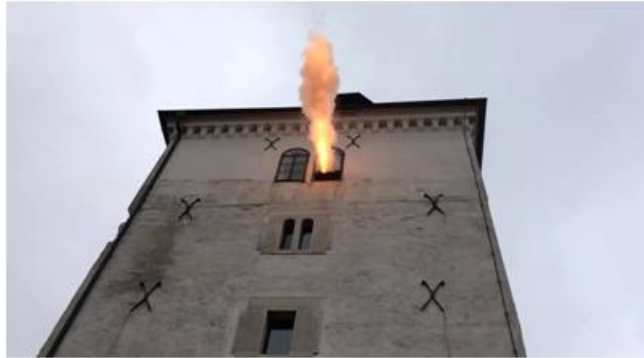
Slika 3: Kula Lotrščak