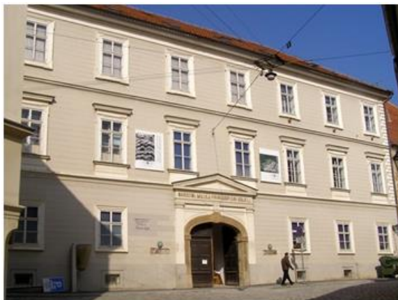
Slika 19: Hrvatski prirodoslovni muzej

osnivaču i voditelju mađarskom grofu Antonu Amadeu de Varkonyu, velikom županu zagrebačkom.