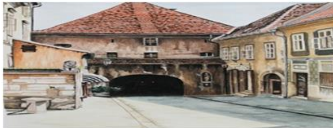
Slika 4: Kamenita vrata