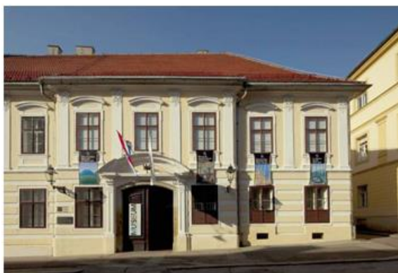
Slika 16: Hrvatski muzej naivne umjetnosti