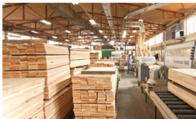
Slika 1. Drvna industrija u Republici Hrvatskoj