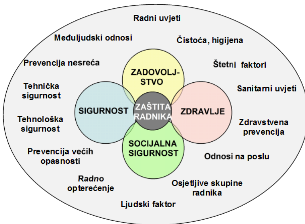
Slika 1: Aspekti rada koji utječu na zaštitu radnika 15

Svaki poslodavac je dužan izraditi procjenu opasnosti/rizika koja se odnosi na vrstu poslova koje obavljaju u poduzeću ili organizaciji. Naravno, pri tome treba primjenjivati zakonska pravila i pravila struke s kojima se otkriva potencijalna opasnost te osigurati njezino potpuno otklanjanje ili ako je moguće, određenu kontrolu opasnosti kako bi se mogao nastaviti radni proces bez posljedica za zdravlje radnika. Radi otkrivanja razine rizika od opasnosti provodi se procjena štetnosti koja je glavno polazište za provođenje temeljne politike i usmjeravanja poduzeća za rad na siguran način.