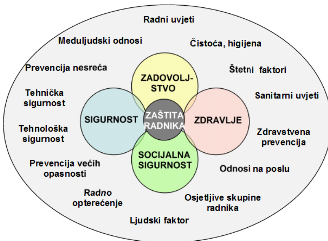
Slika 1: Aspekti rada koji utječu na zaštitu radnika 15

Svaki poslodavac je dužan izraditi procjenu opasnosti/rizika koja se odnosi na vrstu poslova koje obavljaju u poduzeću ili organizaciji. Naravno, pri tome treba primjenjivati zakonska pravila i pravila struke s kojima se otkriva potencijalna opasnost te osigurati njezino potpuno otklanjanje ili ako je moguće, određenu kontrolu opasnosti kako bi se mogao nastaviti radni proces bez posljedica za zdravlje radnika. Radi otkrivanja razine rizika od opasnosti provodi se procjena štetnosti koja je glavno polazište za provođenje temeljne politike i usmjeravanja poduzeća za rad na siguran način.