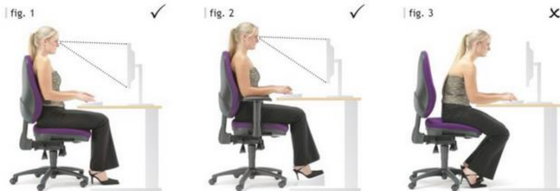
Slika 2: Prikaz pravilnog i nepravilnog načina sjedenja na radnom mjestu 70