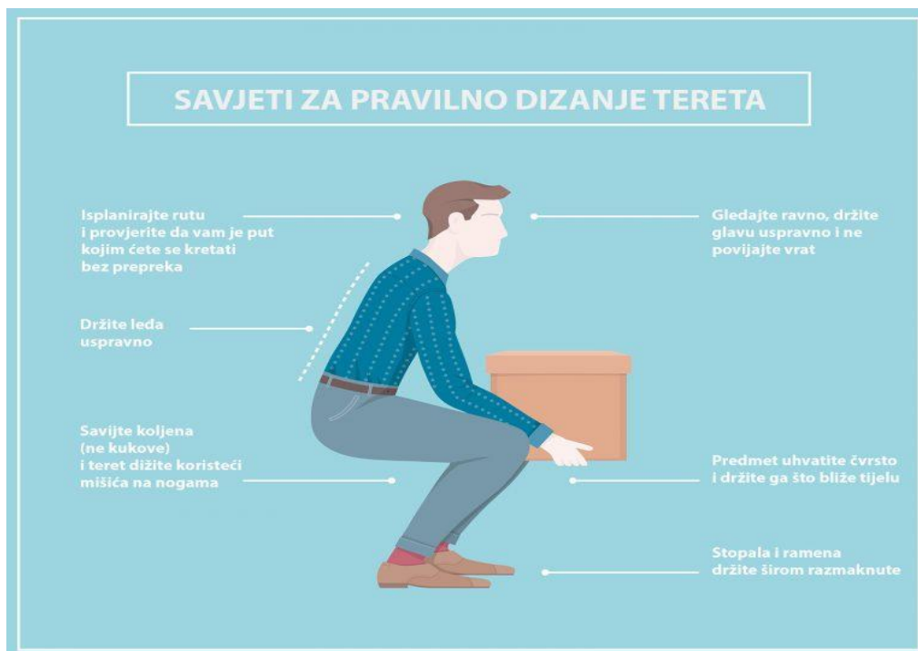
Slika 3: Vodič za pravilno podizanje tereta 78

Prilikom podizanja tereta moraju se držati leđa ravno, noge se moraju saviti u koljenima i moraju se koristiti za dizanje tereta, stav nogu mora biti malo razdvojen, otprilike u širini ramena, predmet se treba primiti s obadje ruke ispružene prema podu, teret se treba približiti što bliže tijelu te prilikom dizanja se ne smije rotirati tijelo. 79