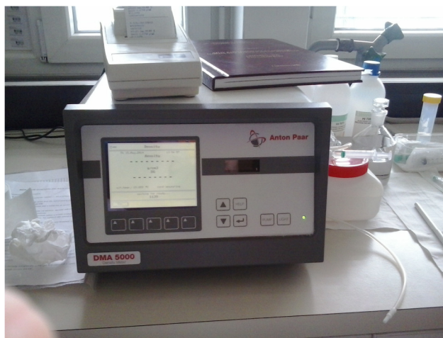
Slika 3. Denzimetar Mettler Toledo DE45.

Gustoću sladovine izmjerena je pri 20 °C s digitalnim denzimetrom. Denzimetar mjeri vrijeme koje je potrebno da se ispitivana otopina u kapilari preračuna u gustoću otopine. Denzimetar je kalibriran pomoću vode (pročišćena MilliQ) i zraka. Prije početka mjerenja uzorak je termostatan 10 minuta, kako bi se ujednačila temperatura između kalibrirane