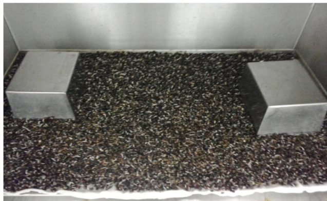
Slika 1. Klijanje heljde u termostatoranoj komori.

Nakon namakanja zrna je preneseno na metalne ploče. Svakih 24 sata zrna su okrenuta radi ujednačenosti klijanja. Klijanje se odvijalo pri temperaturi 20 °C, 24 sata, 48 sati i 72 sata i relativni vlazi 96-98 %.