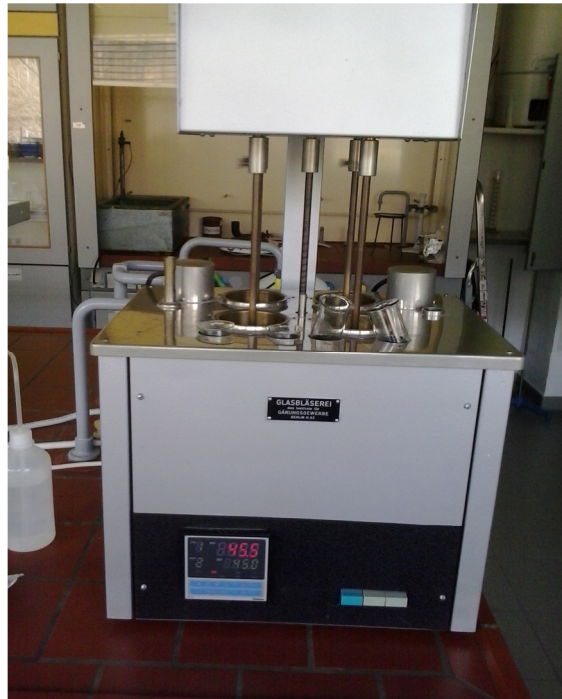
Slika 2. Uređaj za pripremu sladovine po kongresnoj metodi Glasbläserei.

znati vlaga ispitivanog slada (Schuster i sur., 1990). Kongresna metoda je korištena za heljdu klijanu 24, 48 ili 72 sata sušenu na 60 ili 80°C.